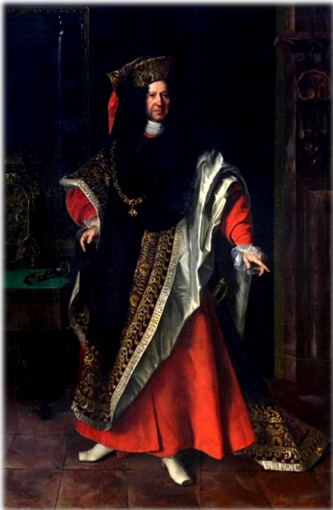
1. Norbert Leopold Libštejnský ve slavnostním rouchu řádu Zlatého rouna Jan Frans van Douven, 1713