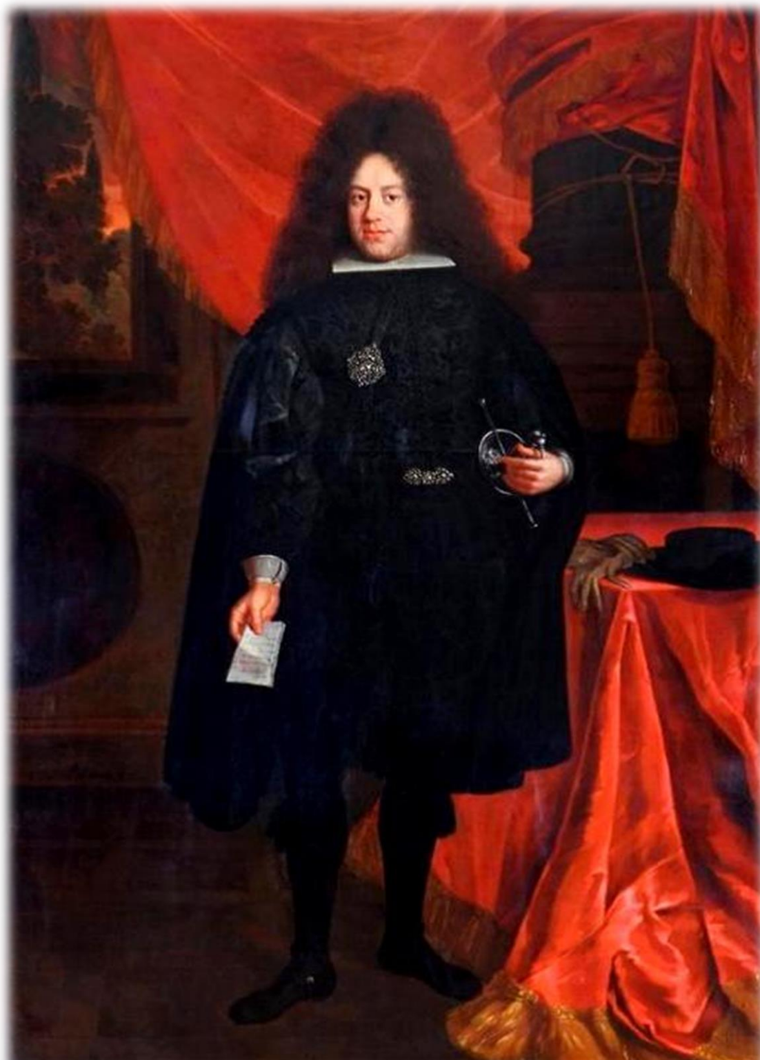
2. Portrét ze španělské mise Jan Frans van Douven, 1688. D. JANSOVÁ, Sbirka portrétů .