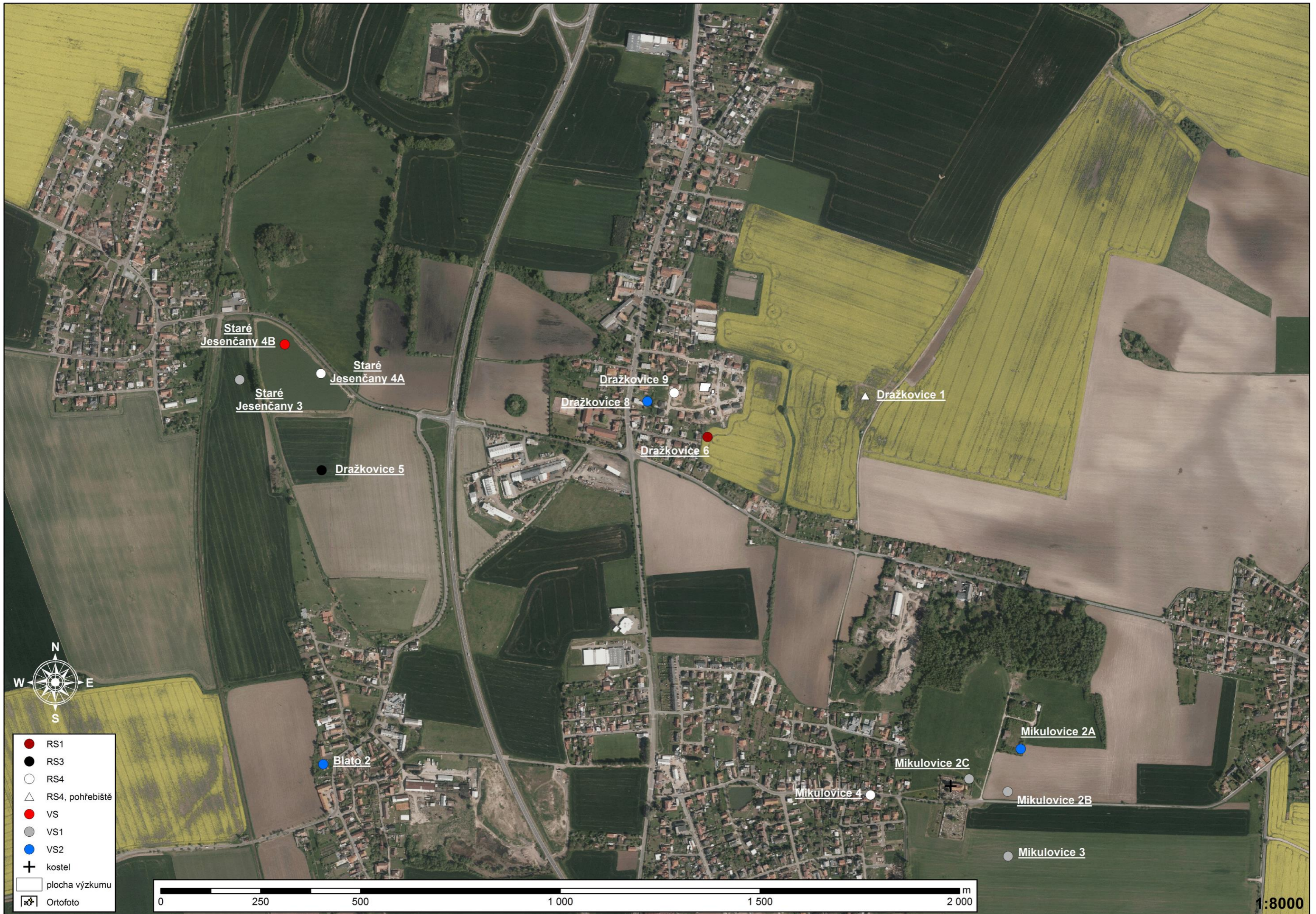
Mapa 2: lokality sídlištního komplexu, ortofoto. Autor: Martin Lanta.