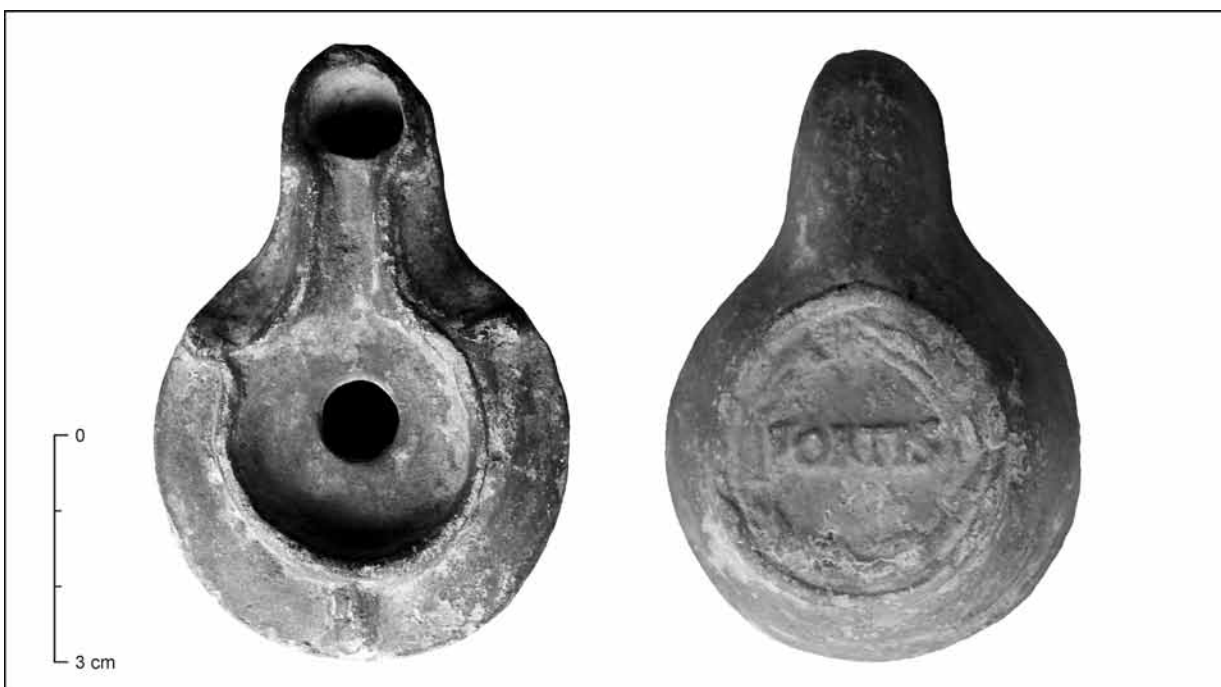
Obr. 2. Veľký Harčáš. Keramická lampa.