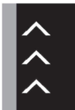
Obr. 4 – Dopravní značka IP 32 - Bezpečný odstup