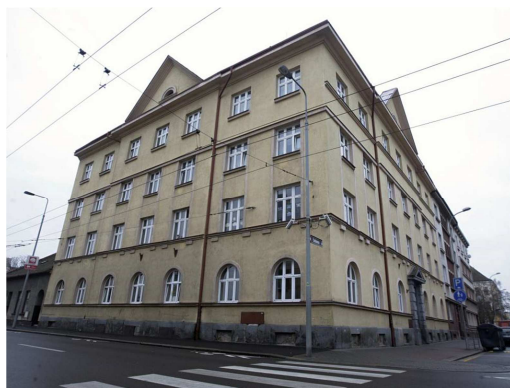
Obr. 4 Ubytovna v Češkově ulici [16]

V nedávné minulosti zde existovaly neudržované byty bez rekonstrukce, tzv. byty 4. kategorie. V roce 2003 byty prošly rekonstrukcí a vznikla zde ubytovna pro osoby mající potíže s placením poplatků spojených s bydlením. Ubytovna má vnitřní systém typický pro takovýto druh ubytovacích kapacit, 37 bytových jednotek pro přibližně 120 lidí. Sociální zařízení je společné na každém poschodí.