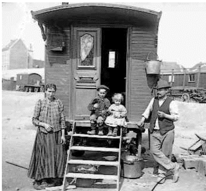
Obr. 2. Romové – kočovníci [14]

V roce 1940 byly otevřeny tři tzv. kárné pracovní tábory. Do táborů byli umisťováni muži bez prokazatelného zdroje obživy, kteří se vyhýbali práci nebo kočovali, což byl další nástroj, jak „řešit“ situaci s Romy. Romové pod označením C tvořili 5-15% z celkového počtu uvězněných. Správa nad tábory byla v rukou četníků v souladu s protektorátními zákony. Nacisté schvalovali veškerá přijatá opatření s tím, že v kárných pracovních táborech viděli možnost internace romských mužů. Po nástupu Reinharda Heydricha do funkce zastupujícího říšského protektora v roce 1941, došlo ke stupňování represivních opatření a záležitostí spojených s Romy se začala zabývat kriminální policie. Od roku 1942 mohly být Romové, nyní již muži i ženy, uvězněni i případně, že se vzdálili bez povolení z místa pobytu, nepracovali nebo spáchali trestný čin. V transportech bylo v letech 1942 – 1944 odvezeno 2618 osob (123 romských mužů a 121 romských žen). Represivními orgány byly vypracovány dokumenty, na jejichž základě byla přijímána rozhodnutí o tom, zda se jedná o Roma, romského míšence. Například za cikánského míšence byla považována osoba, která, měla mezi svými osmi předky alespoň jednoho Roma. Výsledkem bylo určení 6500 Romů a míšenců, přičemž část z nich byla uvězněna v cikánských táborech. Příkladem cikánského tábora mohou být Lety u Písku, kde bylo umístěno 1308 osob. V roce 1943 byli do koncentračního tábora Auschwitz II.- Birkenau transportováni první Romové z protektorátu,