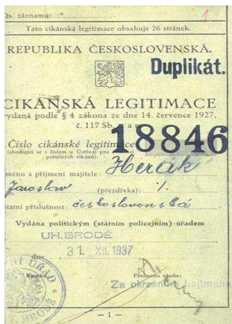
Obr.1. Cikánská legitimace [9]

Podle statistik z let 1922 – 24 žilo na území tehdejšího Československa celkem 56 266 Romů a to velké většiny na Slovensku (v Čechách 579, Moravě 2 139). Romové na Moravě žili usazeným způsobem života, často v romských osadách, čeští Romové kočovali. I když obživa byla stále provozována formou tradičních řemesel, stále více Romů začínalo pracovat jako námezdní pracovníci v průmyslu a zemědělství. V některých případech se Romové dopouštěli zejména drobné kriminální činnosti. Vzestup nacistické ideologie v Německu s tím spojená radikální protiromská opatření způsobila migraci německých Romů do Československa. Odtud byli dle výše zmiňovaného zákona č.117/27 Sb. posíláni zpět. Po okupaci pohraničí, na základě říšskoněmeckého výnosu z roku 1938 o potírání cikánského zlořádu, byla provedena další evidence - Cikánů, cikánských míšenců a osob žijících po cikánském způsobu. Vyhláška protektorátního ministerstva vnitra o zákazu kočování z roku 1939 zapříčinila usazení kočujících Romů. [9]