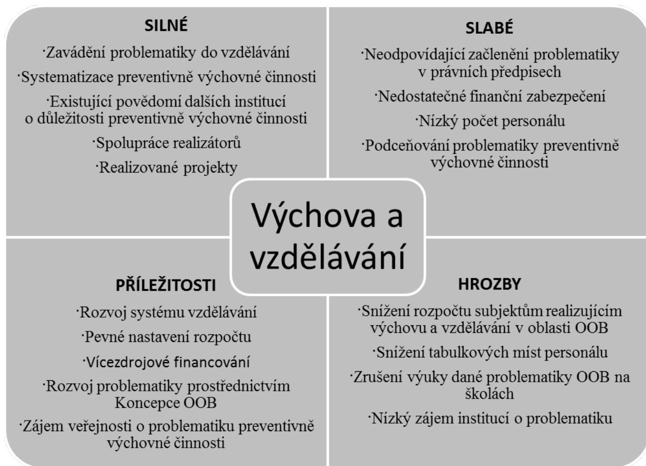
Obrázek 2: SWOT analýza oblasti „Výchova a vzdělávání“