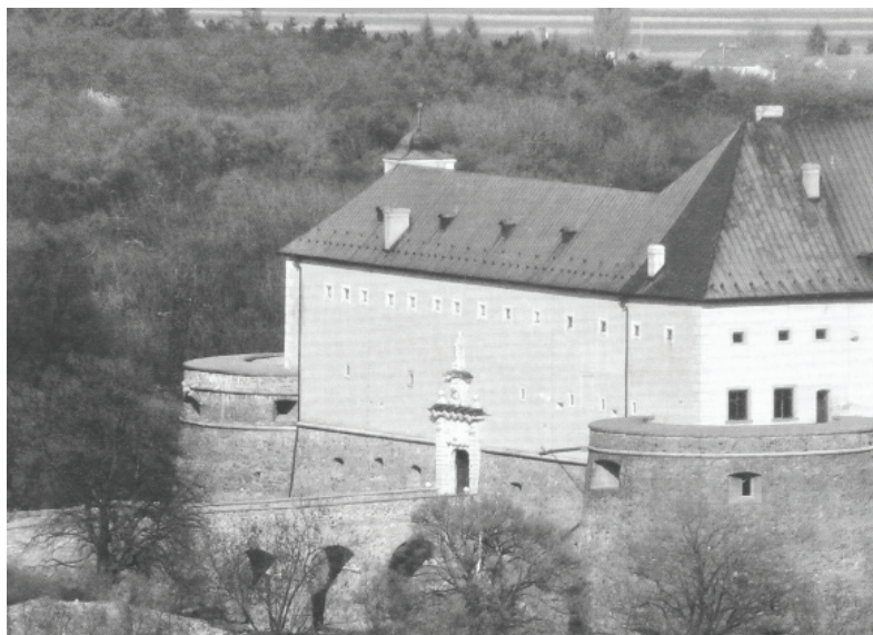
Obr. 1: Hrad Červený Kameň v súčasnosti.