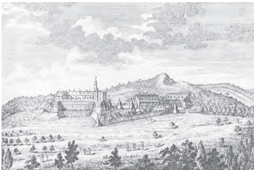
Obr. 2: Hrad Červený Kameň okolo roku 1735. Repro: Tamže, prevzaté z: Matthiae BEL, Notitia Hungariae Novae Historico-Geographica. Tom. II. (Part.3.-4.). Viennae 1736.