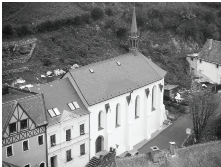
Obr. 2: Špitální kostelík sv. Ducha v Krupce. Foto: Jan Kilián, 2011.