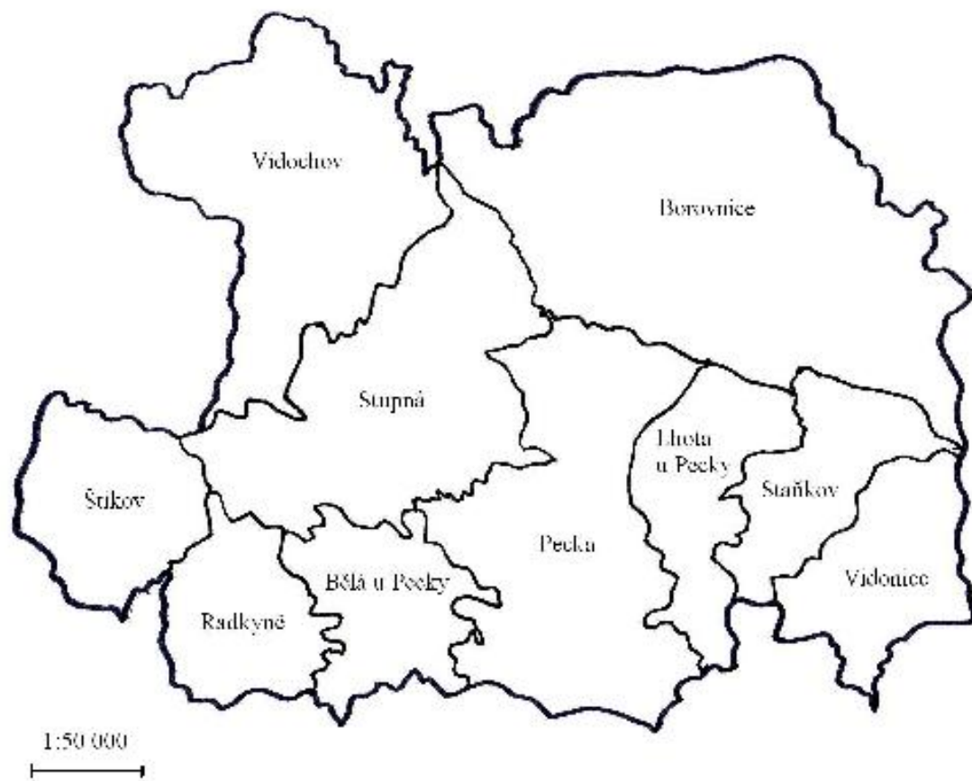
Příloha č. 1 - mapa panství Pecka roku 1716