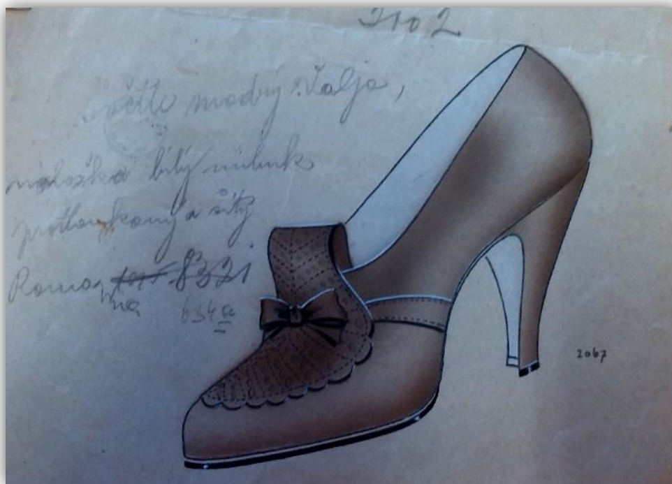
Obr. 9: Dámská botka na vysokém podpatku, zdobená žlutými kroužky a hranolky, z hnědého boxcalfu, 20. léta 20. století 457