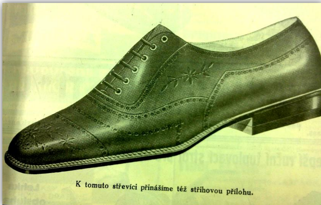
Obr. 11: Moderní pánská polobotka, jednobarevná, zdobená vysekáváním, vhodná pro letní nošení, r. 1931 459