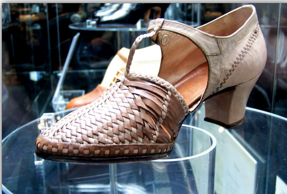
Obr. 4: Dámské střevičky, večerní společenská obuv, svršek splétán – pásky ze stříbrného nebo zlatého dracounu, Heřmanův Městec/Holice, 20. léta 20. století 465