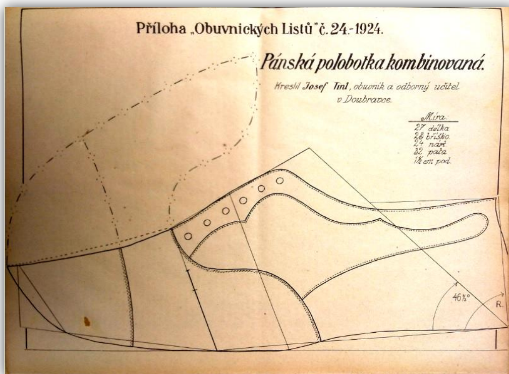
Obr. 5: Pánská polobotka – kombinovaná, předpokládaná podoba modelu dle střihu výše 453