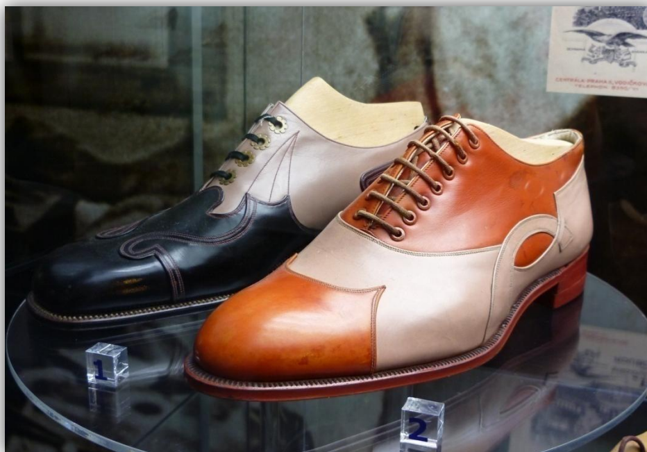
Obr. 2: Dámské střevičky, usňové, 20. léta 20. století, výrobcem Tilla - výroba jemné obuvi Skuteč 463