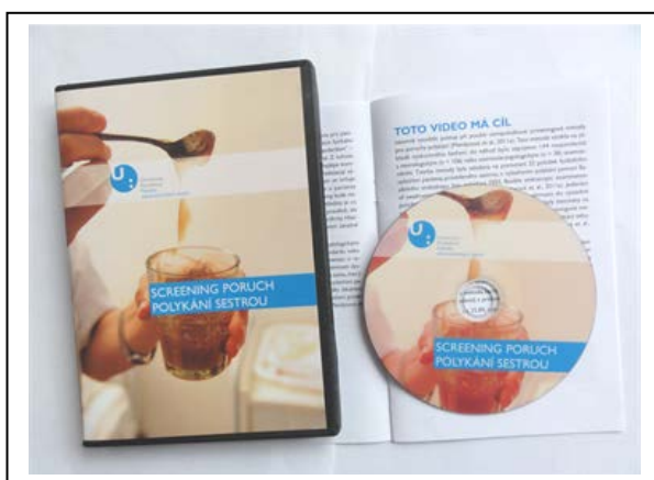
Obr. 1 Video Screening poruch polykání sestrou (Mandysová a Dobra, 2011)

Jednalo se o 15minutové video (Mandysová a Dobra, 2011) natočené ve spolupráci s Konferenčním centrem Univerzity Pardubice (Obr. 1). Za asistence zaměstnance tohoto centra) byl sestaven scénář. Kameraman následně asistoval při přípravě prostředí k natáčení a veškeré scénky natáčel. Střih, četba komentáře (sestaveného autorkou disertační práce), grafická úprava a hudba byly zajištěny Konferenčním centrem.