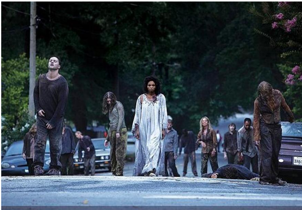
Příloha č. 4 Detail moderního zpracování představy o zombie. Ukázka z The Walking Dead