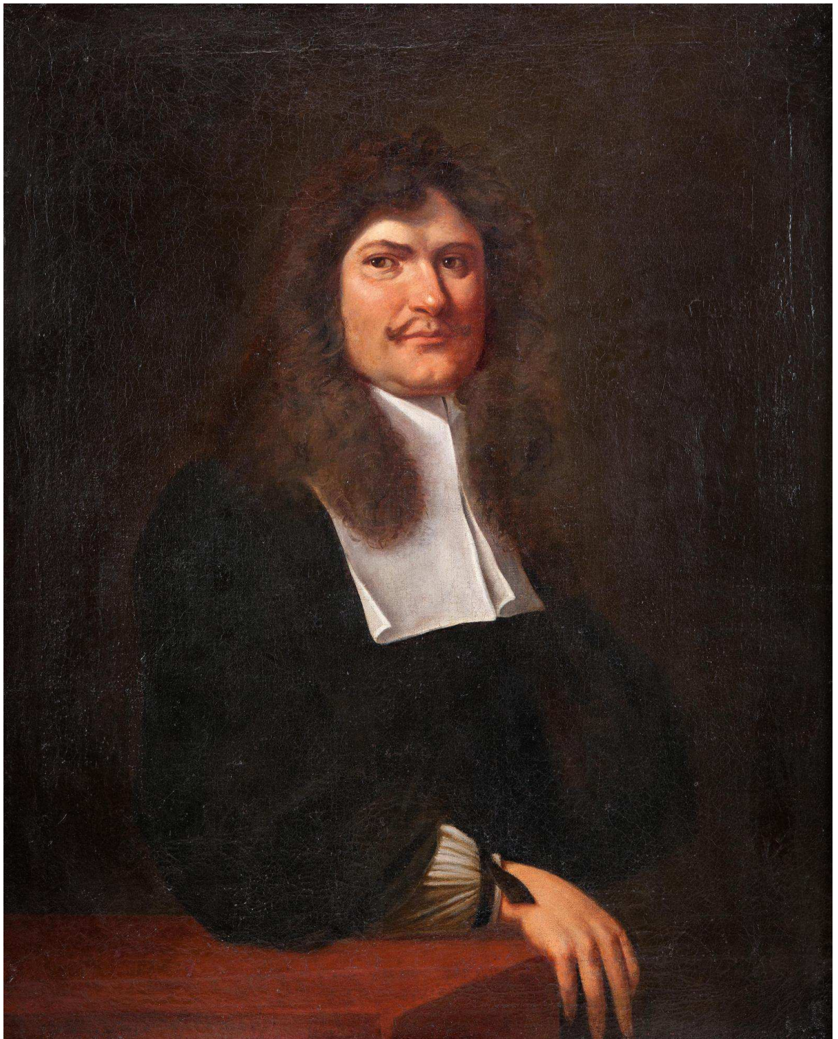
Obr. 4 Primátor Starého Města pražského Matyáš Maxmilián Macht z Löwenmachtu