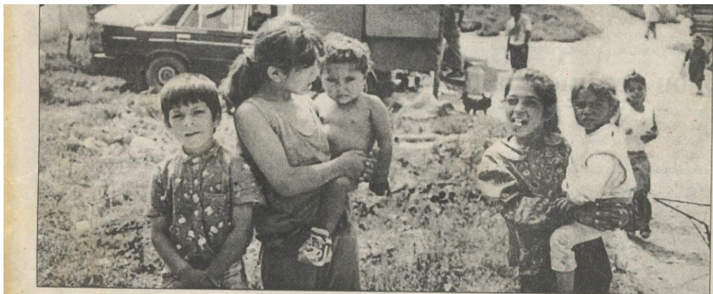
Podľa slov starostu Letanoviec sú Rómovia naklonení presťahovaniu do novej osady.