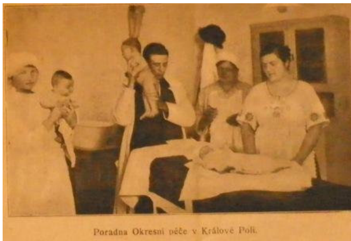
Příloha č. 4: