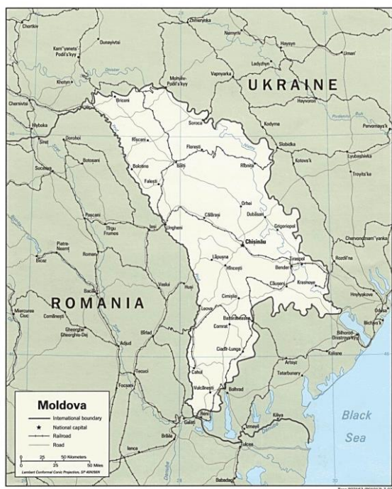
Obrázek 1: Moldavská republika

Moldavsko (oficiálním názvem Moldavská republika) se rozkládá ve východní Evropě mezi Rumunskem a Ukrajinou (viz obrázek č. 1), je vymezené na západě řekou Prut (na území státu 700 km) a na východě řekou Dněstr (na území státu 400 km). Rozloha státu činí 33 843 km 2 (bez započtení Podněsteří 79 , jež leží na ploše 4 163 km 2 ). Moldavsko je tvořeno převážně nízkou pahorkatinou, do níž se zářývají četné řeky. Výsledkem erozní činnosti vody je mnoho údolí a roklí. Charakteristická je velmi úrodná půda, 75 % rozlohy tvoří černozem. Celých 55% rozlohy tvoří zemědělsky obděláná půda, což řadí zemi v tomto ohledu po Bangladéši na druhé místo na světě. Kopce v severní části jsou součástí Volyňsko-podolské vyvýšeniny, která sem vybíhá z Ukrajiny. Nejvýchodnější oblasti Moldavska jsou součástí rozsáhlých euroasijských stepí 80 . Nejvyšším bodem země je Balaneš (Dealul Bălănești) s 430 m. n. m., nejnižším pak řeka Dněstr (2 m. n. m.).