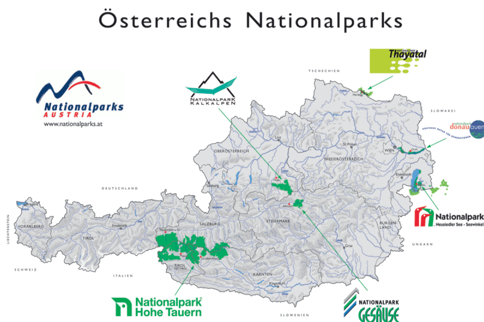
Obrázek 8. 2 Národní parky Rakouska

Rakousko vyhlásilo šest nejceněnějších území za národní parky, pokrývají přes 235 000 ha a tím okolo 3 % území státu, jsou zobrazeny na obrázku 2.