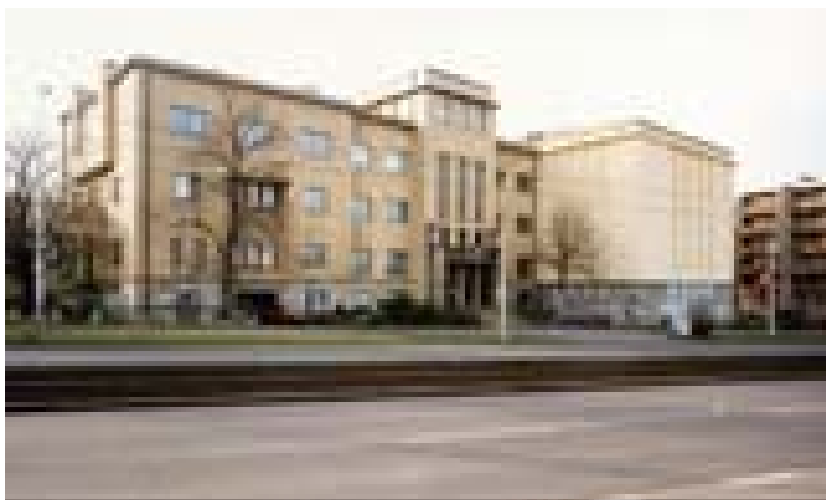
Obrázek č. 2. : Slovenský národní archiv 169