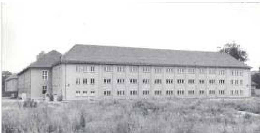
Obrázek č. 6. : Budova ředitelství Francouzského národního archivu - Hôtel de Soubise 173