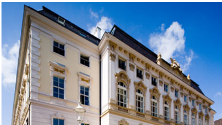
Obrázek č. 4. : Spolkový archiv v Koblenz - Wöllershof 171