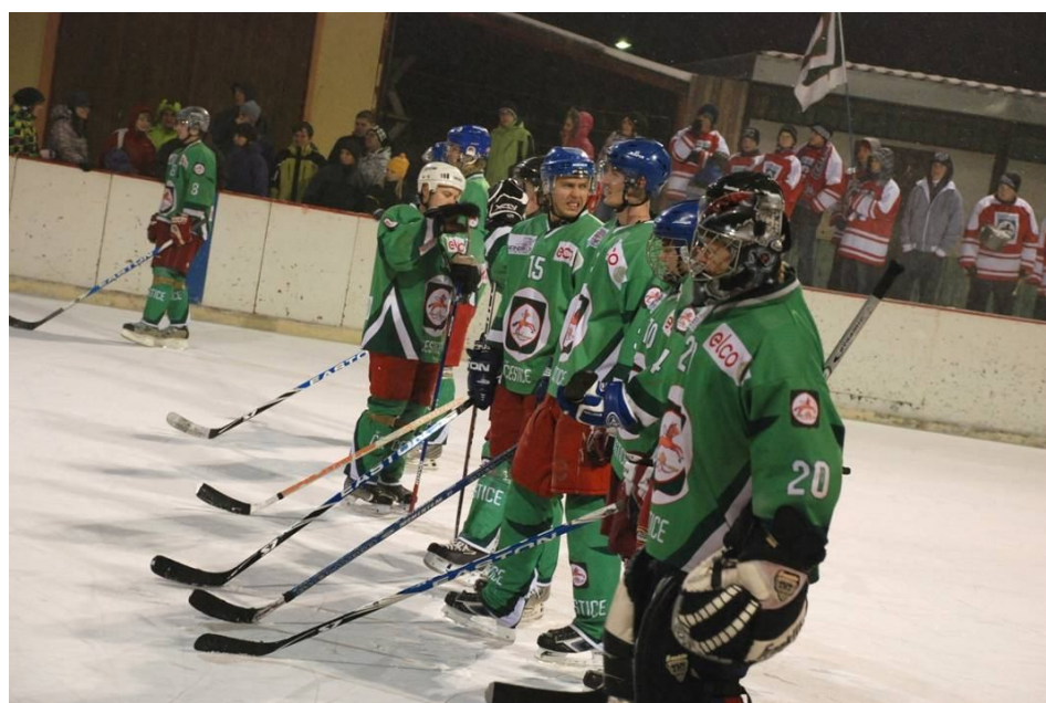
11. Hráči čestického hokeje se připravují na začátek zápasu