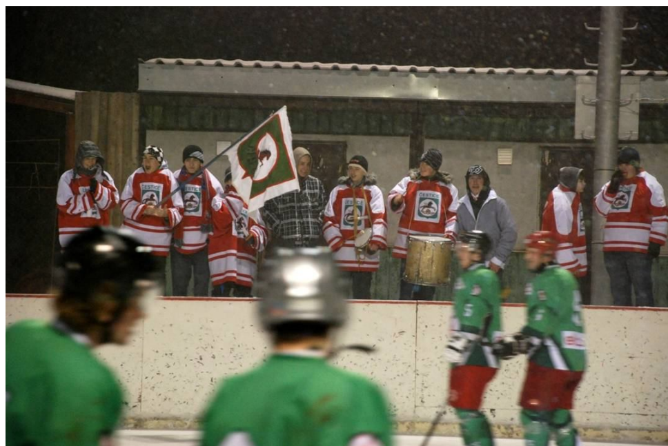
13. Burácející fanoušci při vítězném gólu na přírodním hřišti v Česticích v roce 2011