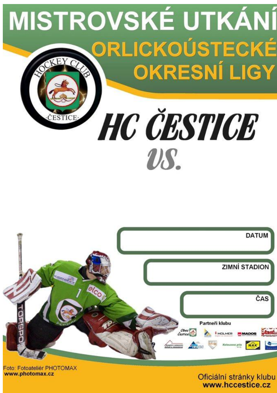
3. Plakát o oznámení hokejového utkání Čestice