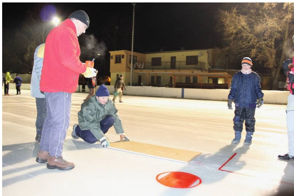
9. Příprava ledu na hokejové utkání