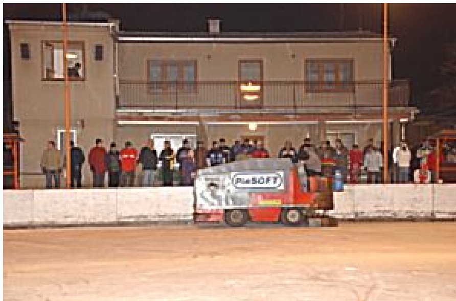
4. První rolba čestického družstva