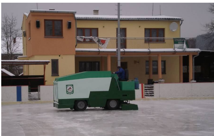
5. Nově zakoupená rolba, funkční od roku 2007 a zrekonstruovaná TJ Sokol - nadstavba kabin s klubovnou v pozadí