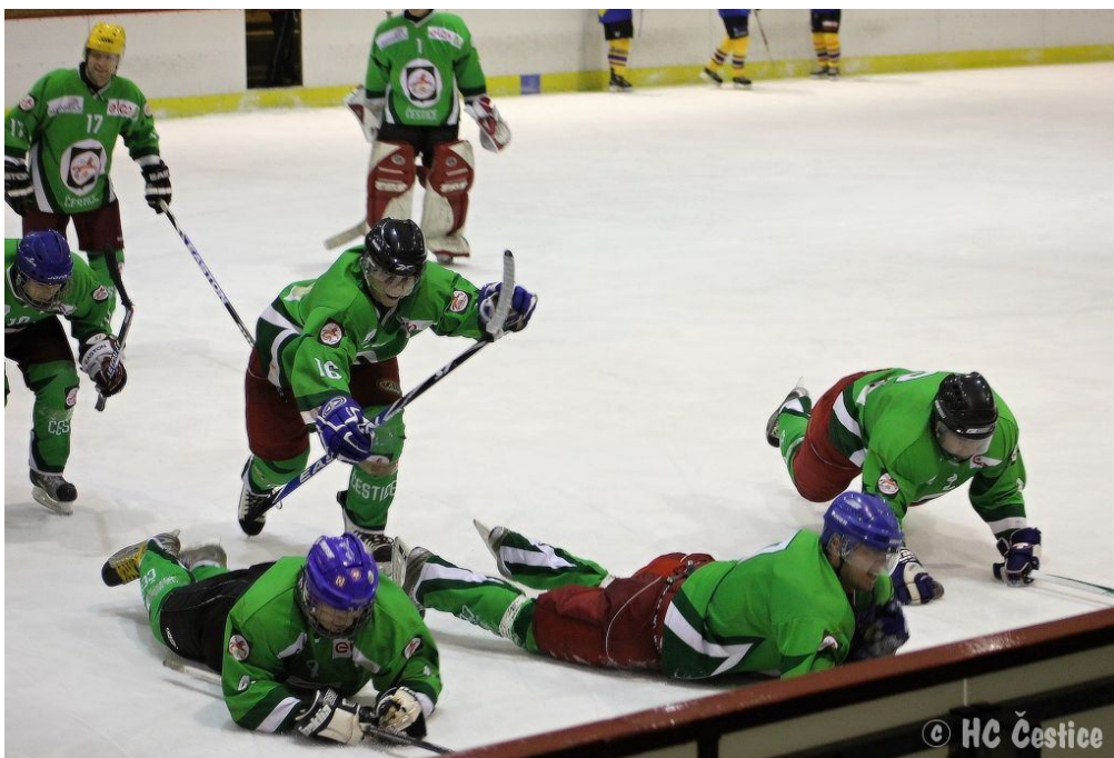
14. Vítězný skluz po odehraném zápase