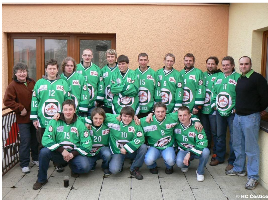
12. Hokejový tým HC Čestice se svým trenérem (vpravo) a asistentem trenéra ( vlevo), (zdroj: archiv autora)