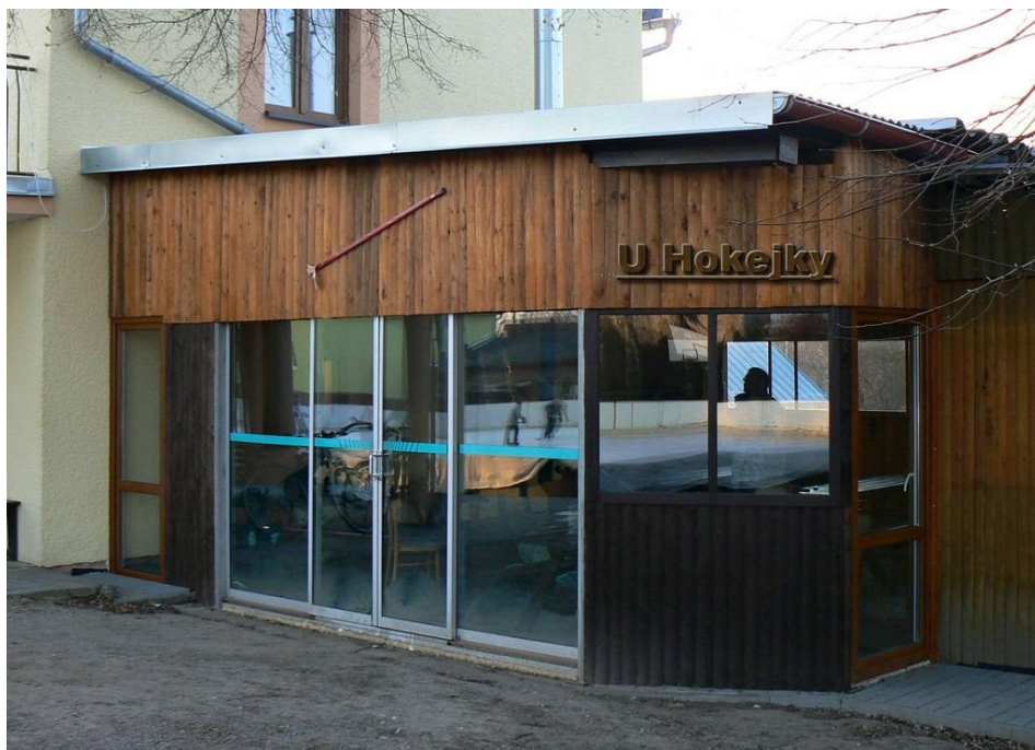
6. Nově zateplený kiosek U hokejky