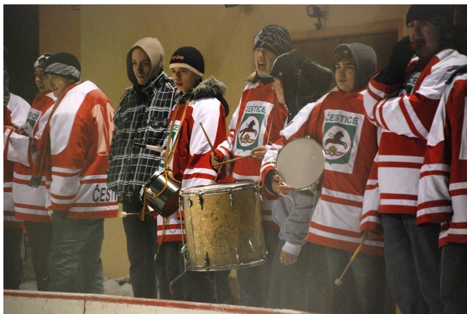
10. Nejmladší vrstva čestických fanoušků vybavená svými dresy a doprovodnými nástroji