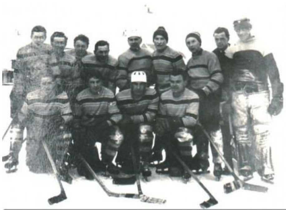
8. Historická fotografie prvního založeného hokejového družstva v Česticích. Fotka z roku 1966