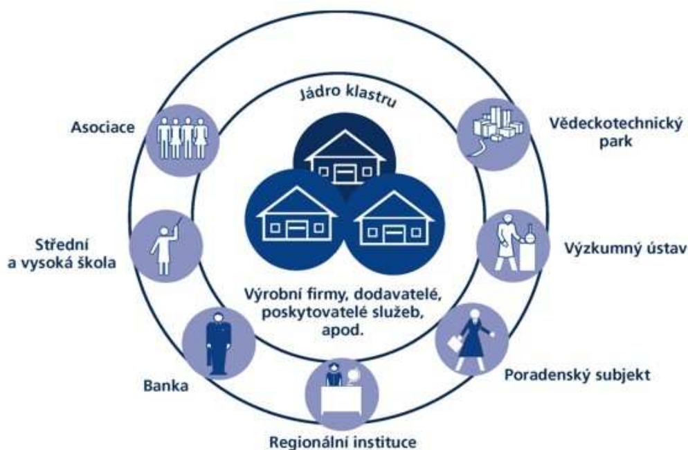
Obr. 2: Struktura klastru 27

Obr. 2 znázorňuje strukturu klastru v českých podmínkách. Obr. 3 pak uvádí porovnání členů klastru v ČR a zahraničí.