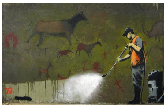
obrázek č. 10