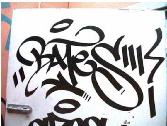
Obrázek č. 1