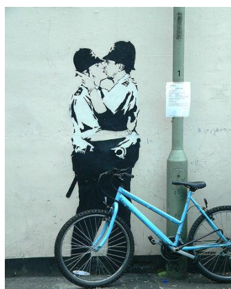
Obrázek č. 9