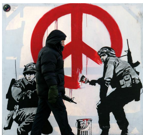
Obrázek č. 11