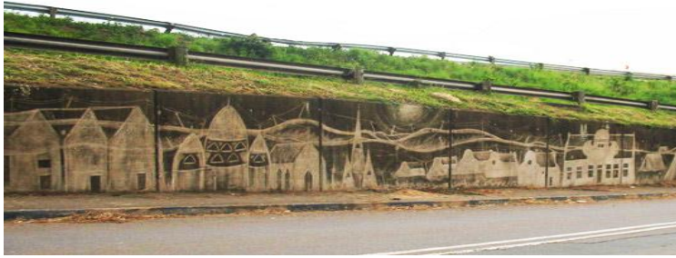
Obrázek č. 4