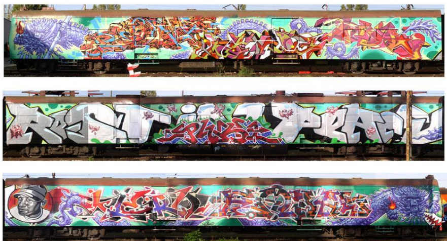
Obrázek č. 3