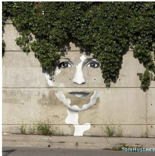
Obrázek č. 6