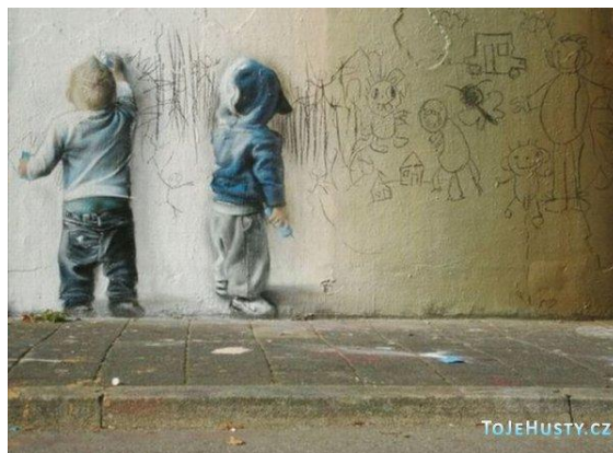
Obrázek č. 8