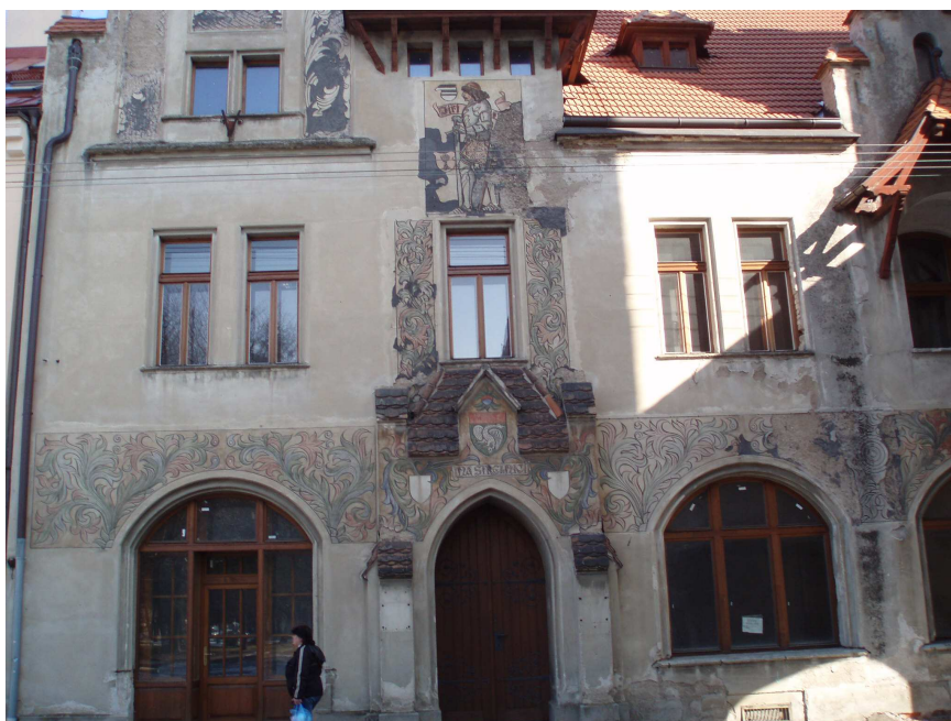
Obr. č. 15 Budova na střelnici č. p. 1