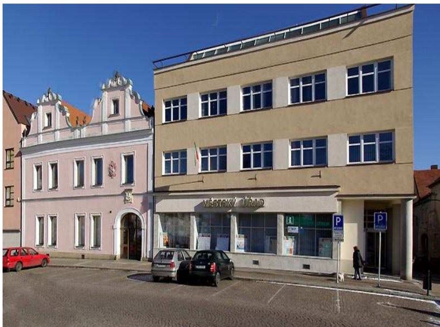
Obr. č. 21 Městský úřad ulice B. Smetany 92