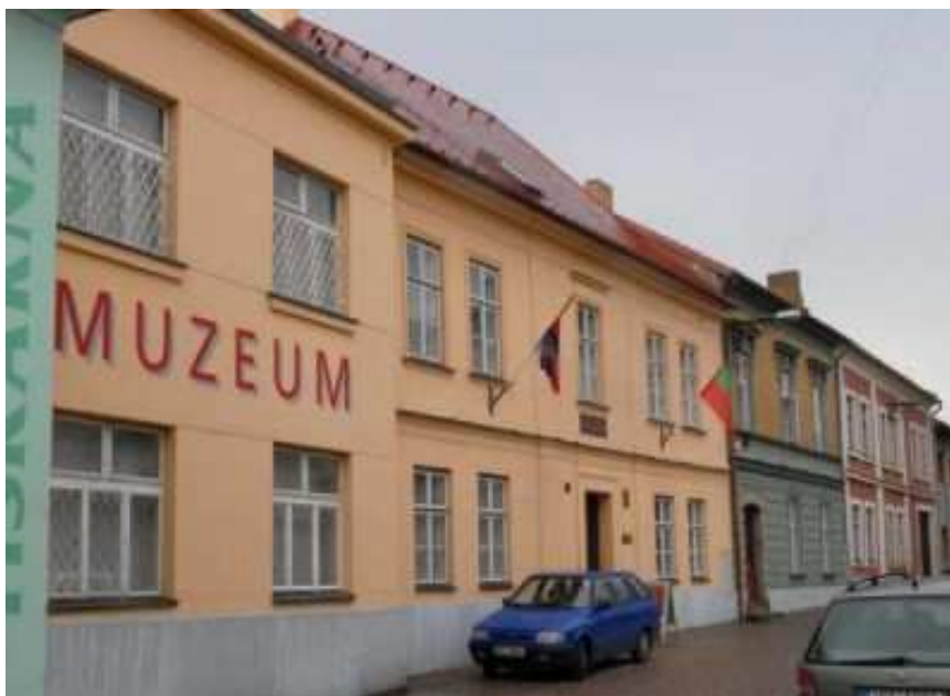
Obr. č. 13 Regionální muzeum ulice A. V. Šembery 125