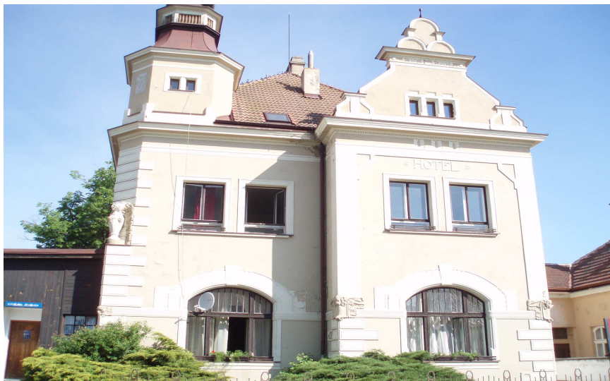
Obr. č. 4-5 Secesní budova vlakového nádraží č. p. 236/IV