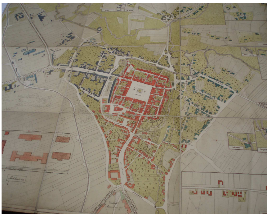
Obr. č. 22 Mapa města z roku 1830