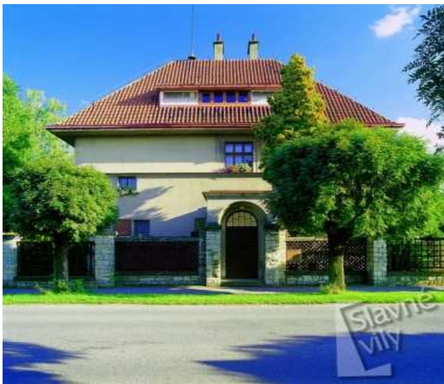
Obr. č. 18 Vila Viléma Charváta ( http://www.slavnevily.cz/vily/pardubicky/vila-vilema-charvata )