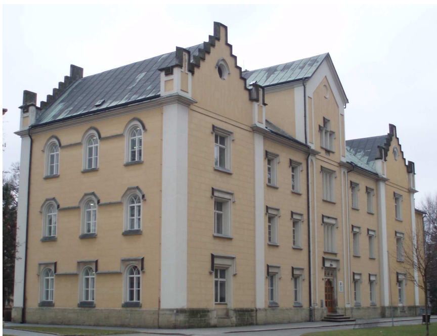
Obr. č. 8 Základní škola náměstí Vaňorného č. p. 273