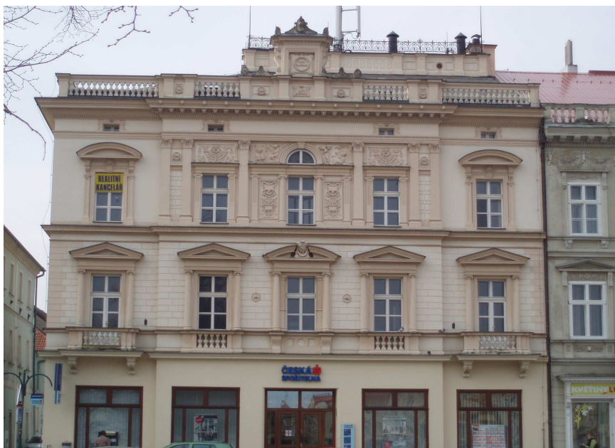
Obr. č. 6 Budova dřívější První záložny č. p. 190