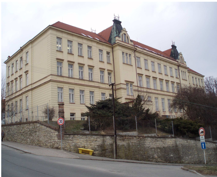
Obr. č. 10 ZŠ Javornického 2 (fotografie autor)