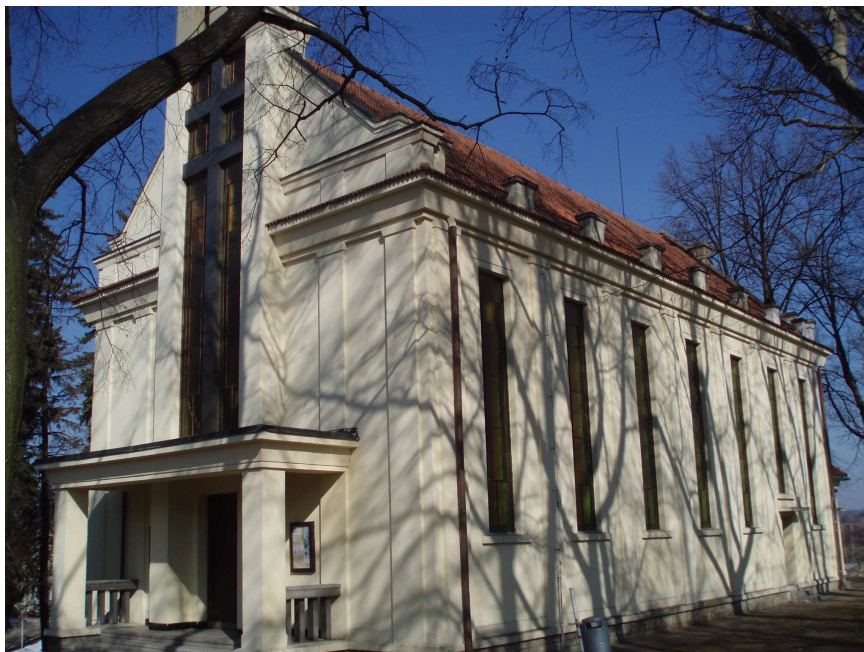
Obr. č. 19 Husův sbor