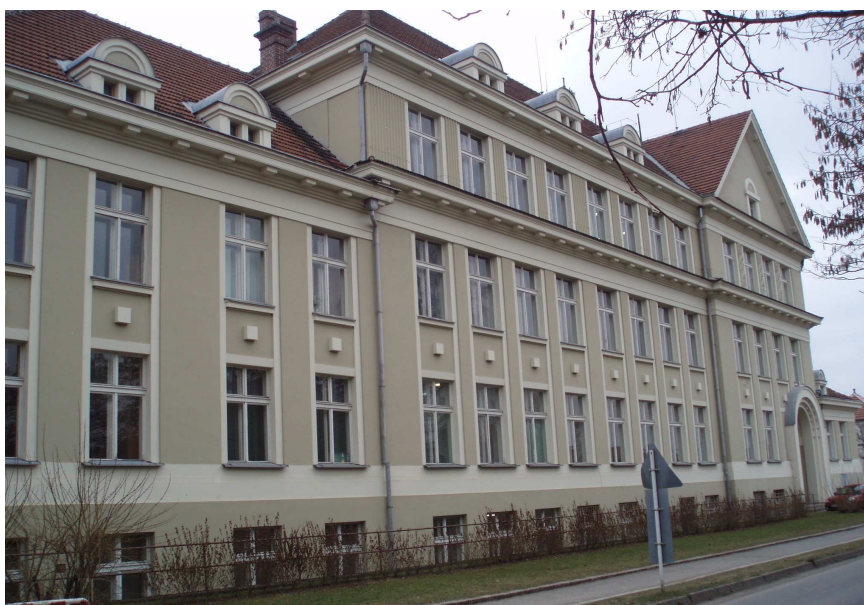
Obr. č. 11 Základní škola č. p. 317 (Dívčí škola)