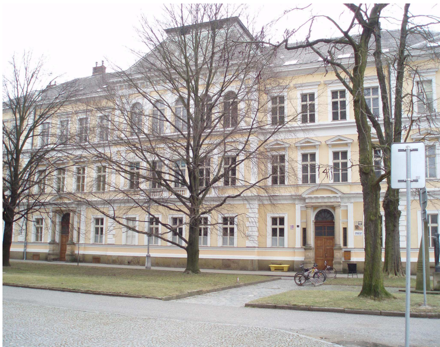
Obr. č. 9 Budova gymnázia Vaňorného 153/1