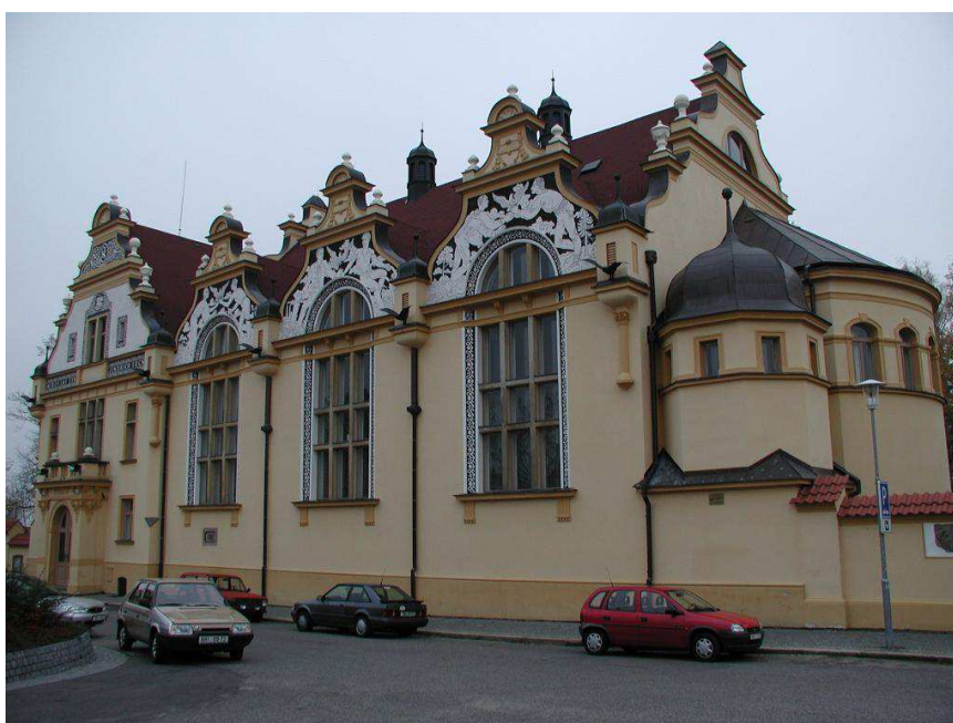
Obr. č. 14 Budova tělovýchovné jednoty sokol č. p. 55