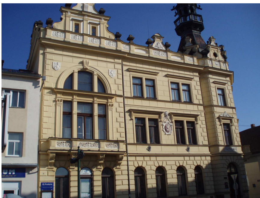
Obr. č. 16 Budova dřívější Pošty č. p. 24 (fotografie autor)