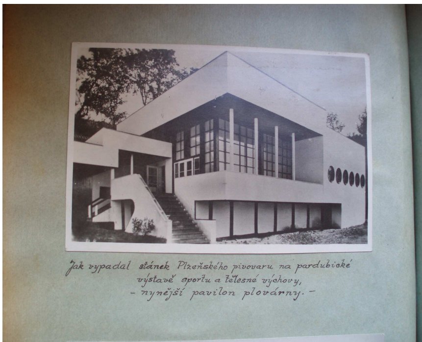
Obr. č. 20 Budova Tyršovy veřejné plovárny, č. p. 328