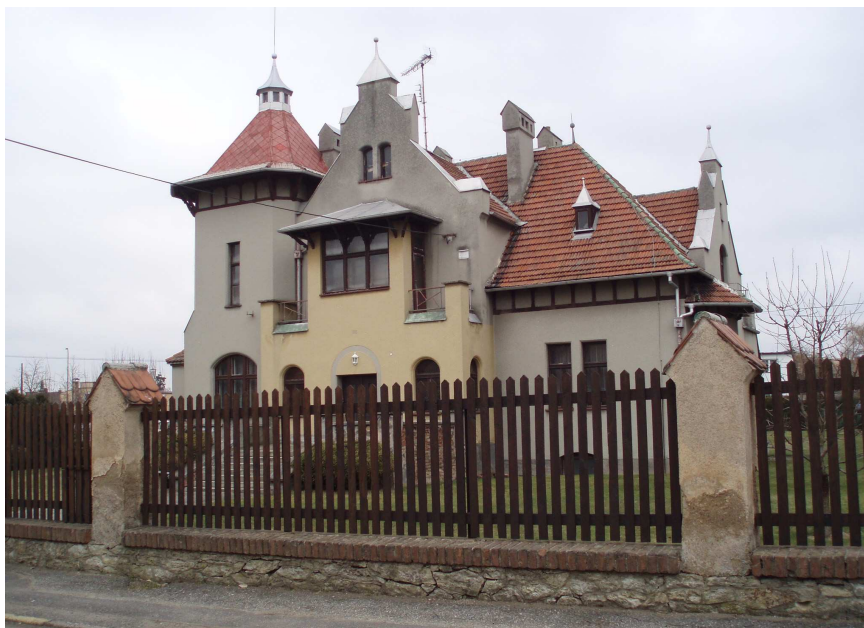
Obr. č. 17 Vila Josefa Šímy č. p. 186