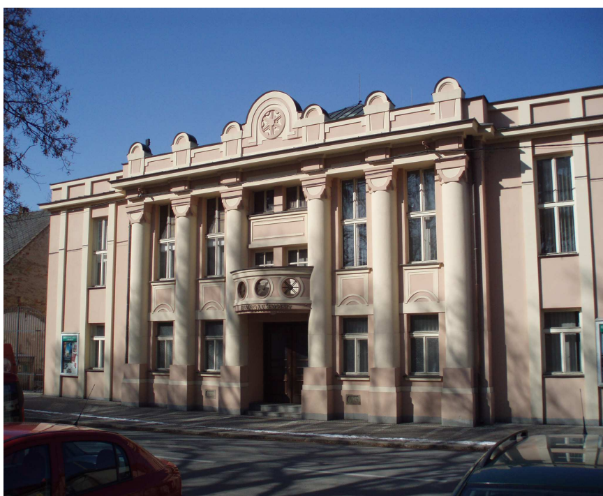
Obr. č. 12 Šemberovo divadlo č. p. 281