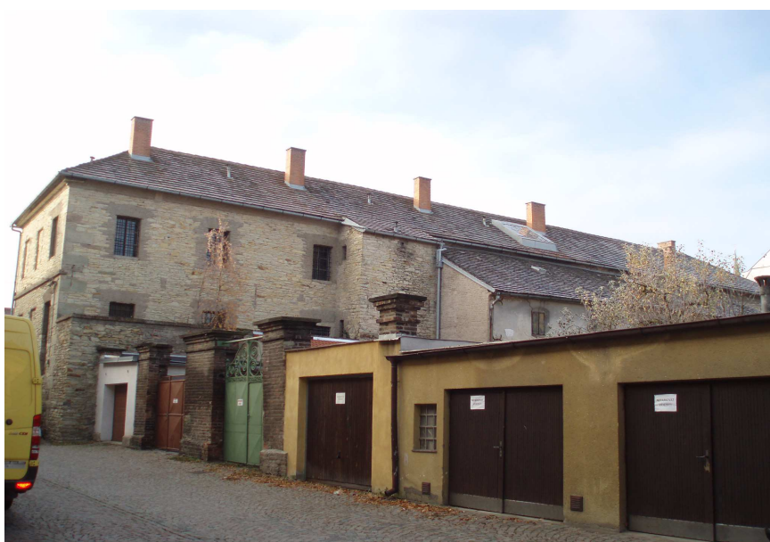
Obr. č. 1-2 Budova staré věznice č.p. 165