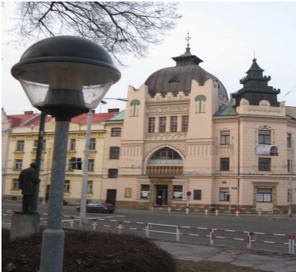
jaro 2011