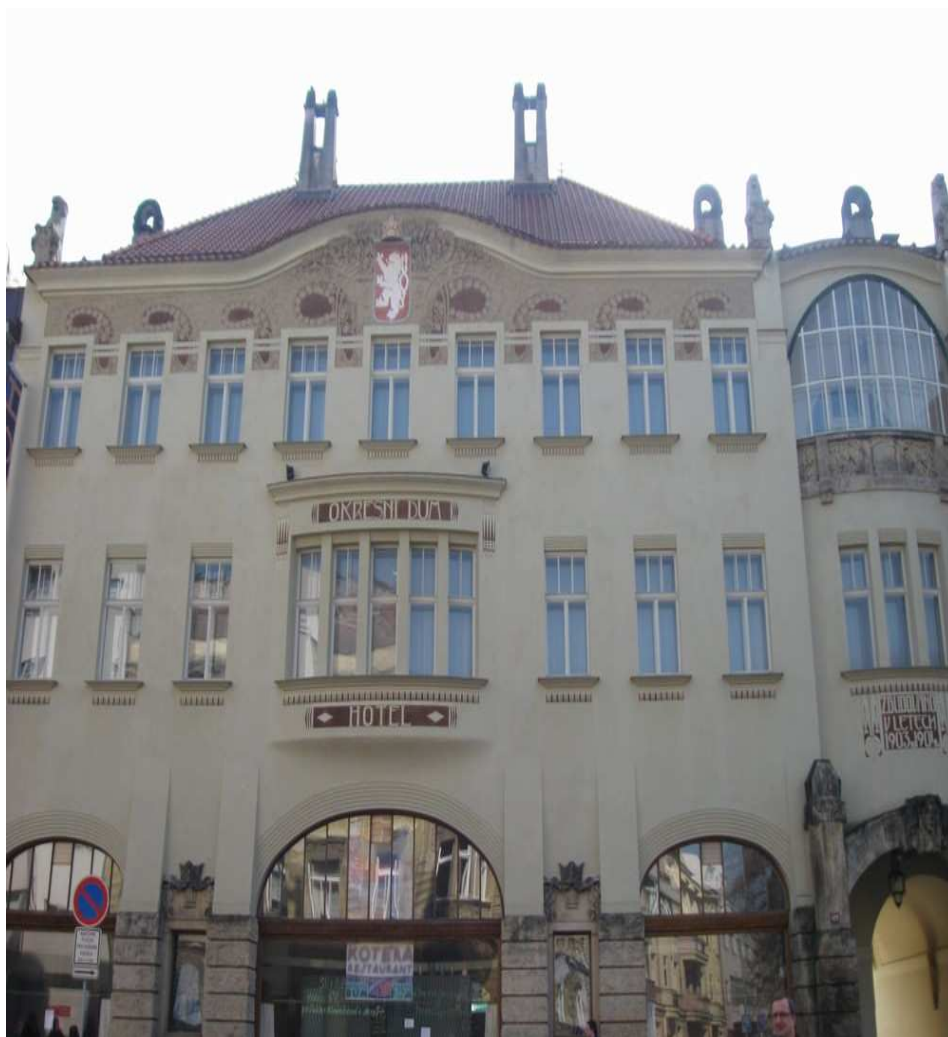
jaro 2011

Jan Kotěra, Palackého č.p. 409, 1903 - 1904