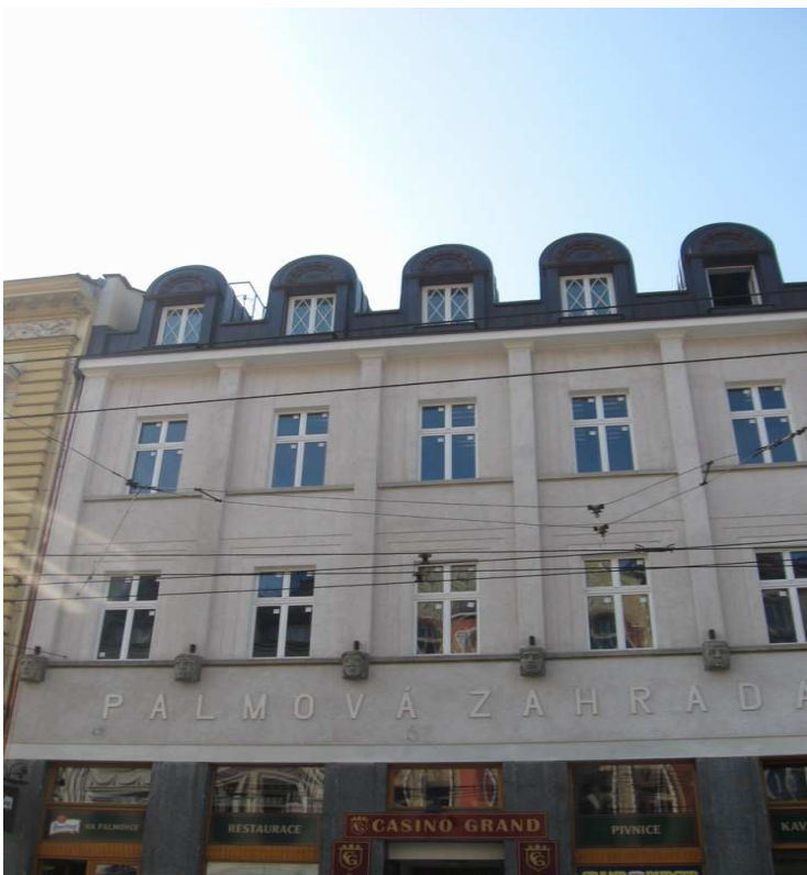
jaro 2011

Jan Kotěra, Československé armády č.p. 275, 1910 - 1911