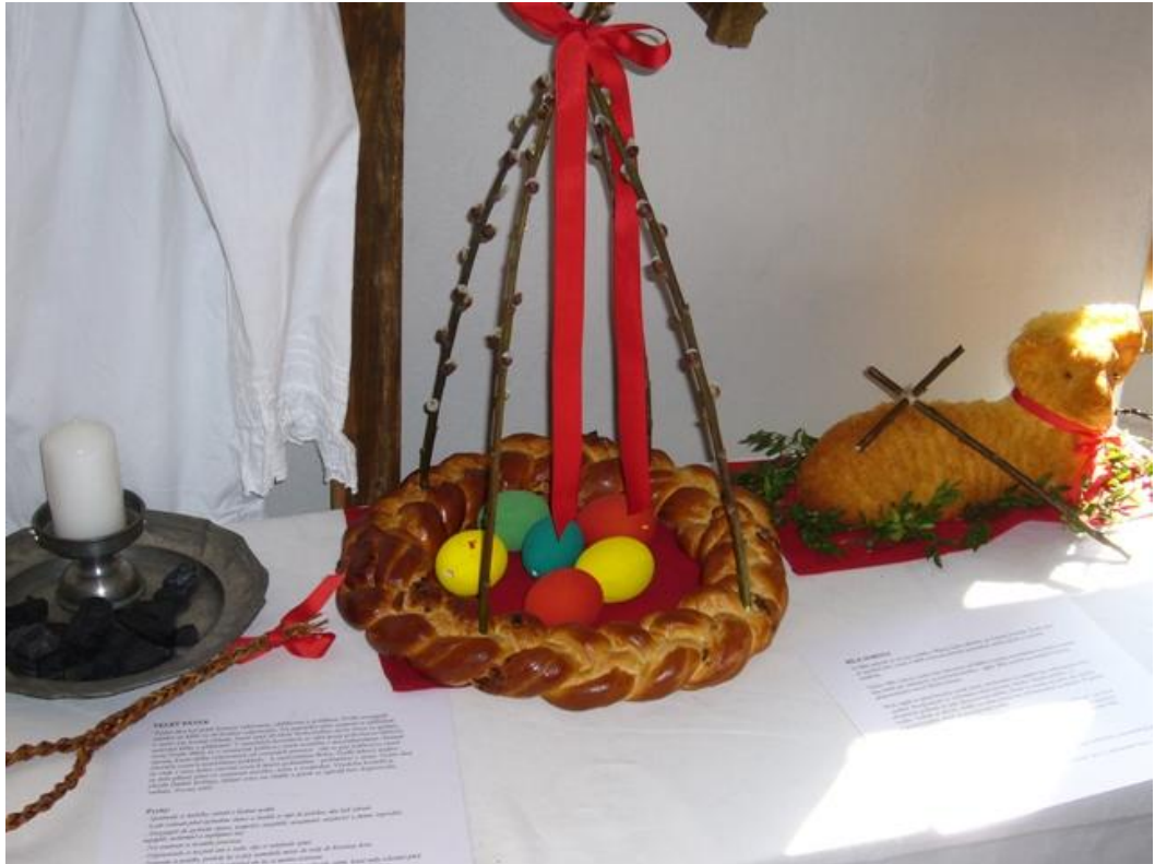
Obrázek č. 2 – Velikonoční symboly