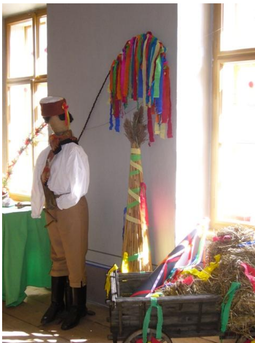
Obrázek č. 4 – Tradiční velikonoční oděv