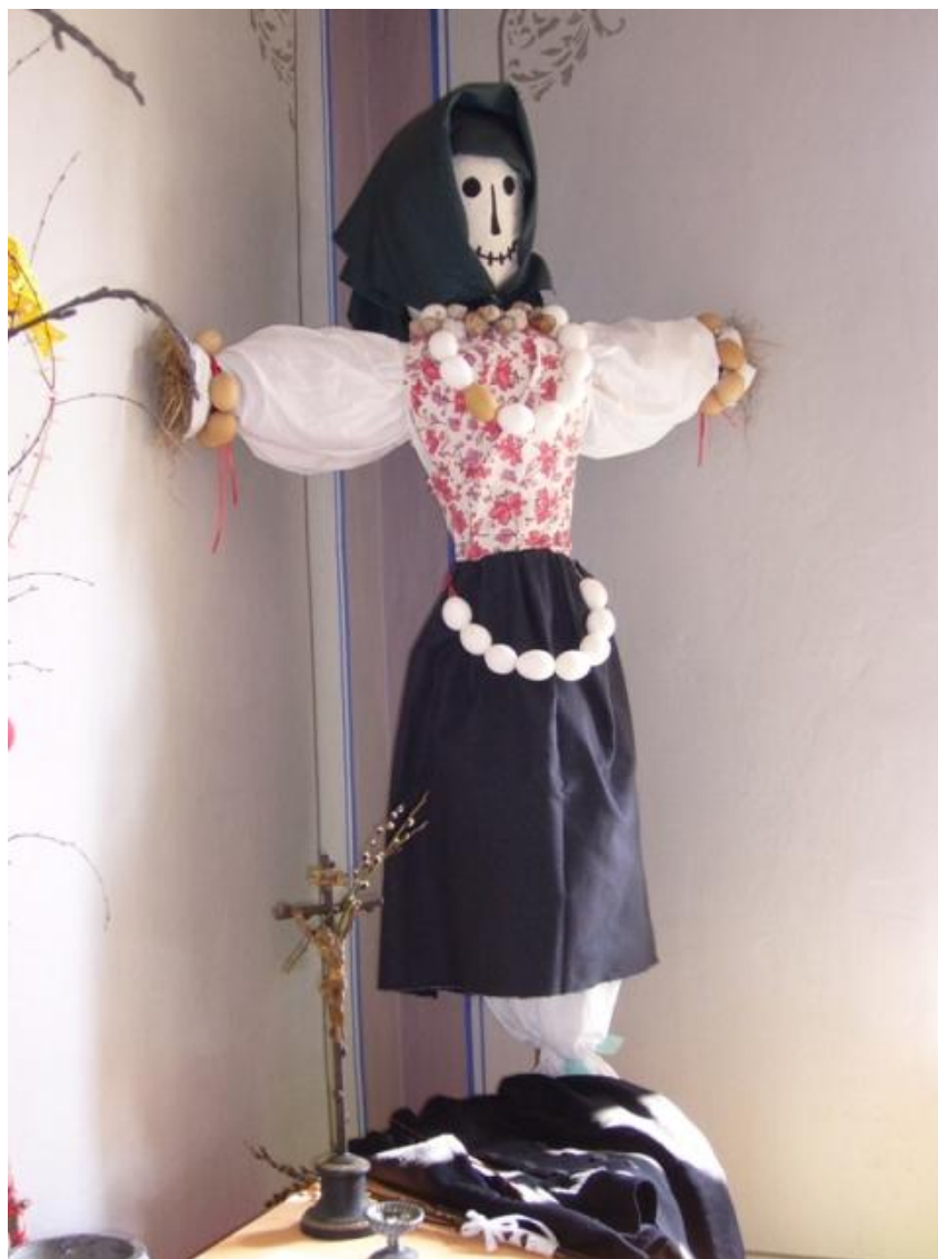
Fotografie č. 1 - Morana, tradice vynášení smrti o Smrtné neděli