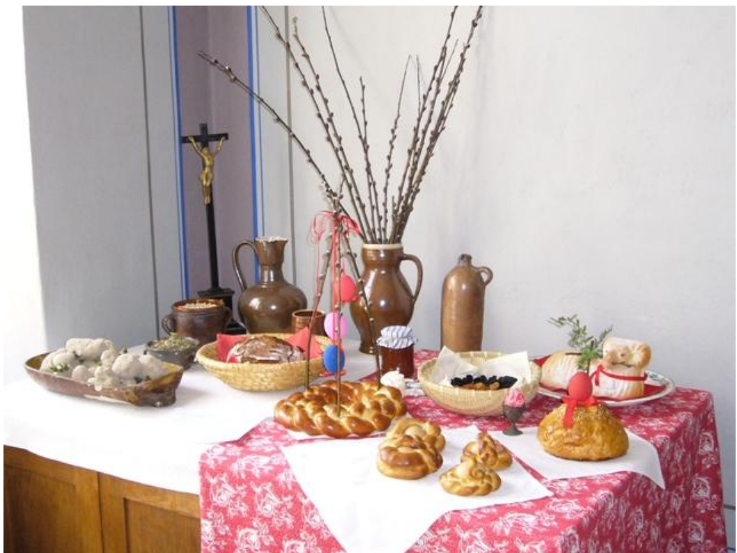
Obrázek č. 3 – Velikonoční symboly a tradiční pokrmy