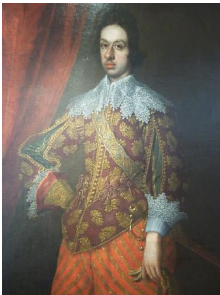
Obr. č. 3. Obraz Ferdinanda II. Medicejského od Valora Casini. Datováno s přibližnou určitostí k roku 1634.