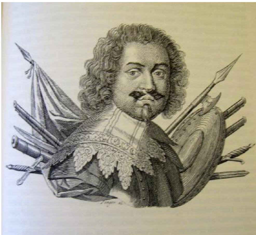
Obr. č. 1. Grafický portrét Francesca Ottavia Piccolomini, rytina ze 17. století. Převzato z: HRA3E, J. K. Dějiny Náchoda , s. 47.