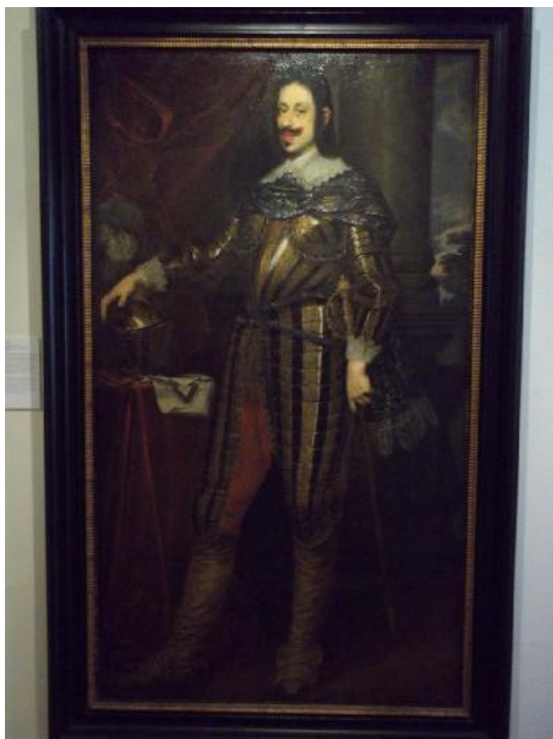
Obr. č. 4. Obraz Ferdinanda II. Medicejského od Justa Sustermanse: Datováno s přibližnou určitostí k roku 1640.