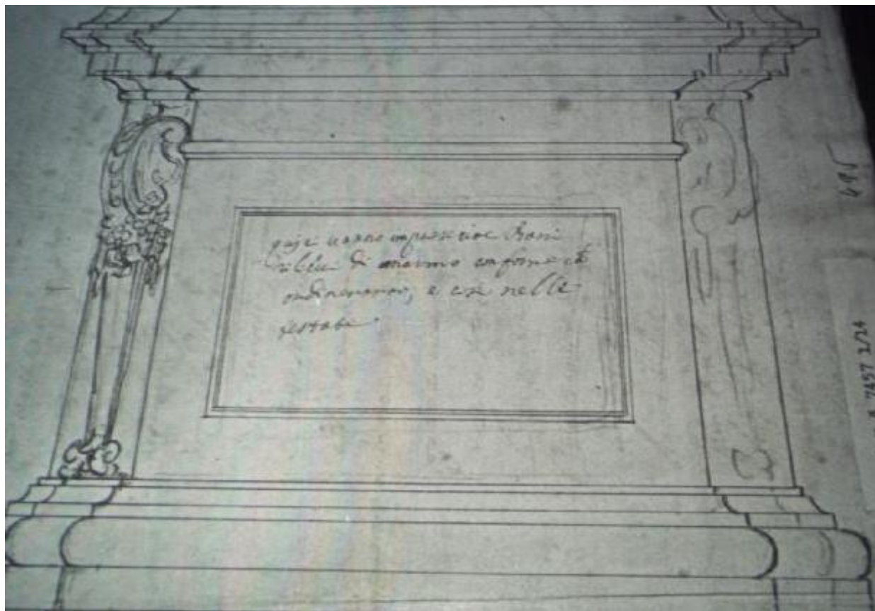
Obr. č. 2. Nákres podstavce pro Ottaviovu jezdeckou sochu z roku 1650.