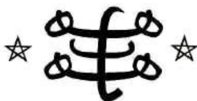
The Ringstone Symbol

V obzvláštní lásce jsou uchovávány kaligrafické formy slova Bahá (arabsky sláva), které jsou známy jako Největší Jméno, což je odkaz na Bahá'u'lláha. Do této kategorie spadá i níže uvedený symbol, který je vyryt na osobních prstenech a zobrazen na budovách, aby poukazoval na jejich Bahá'í identitu.