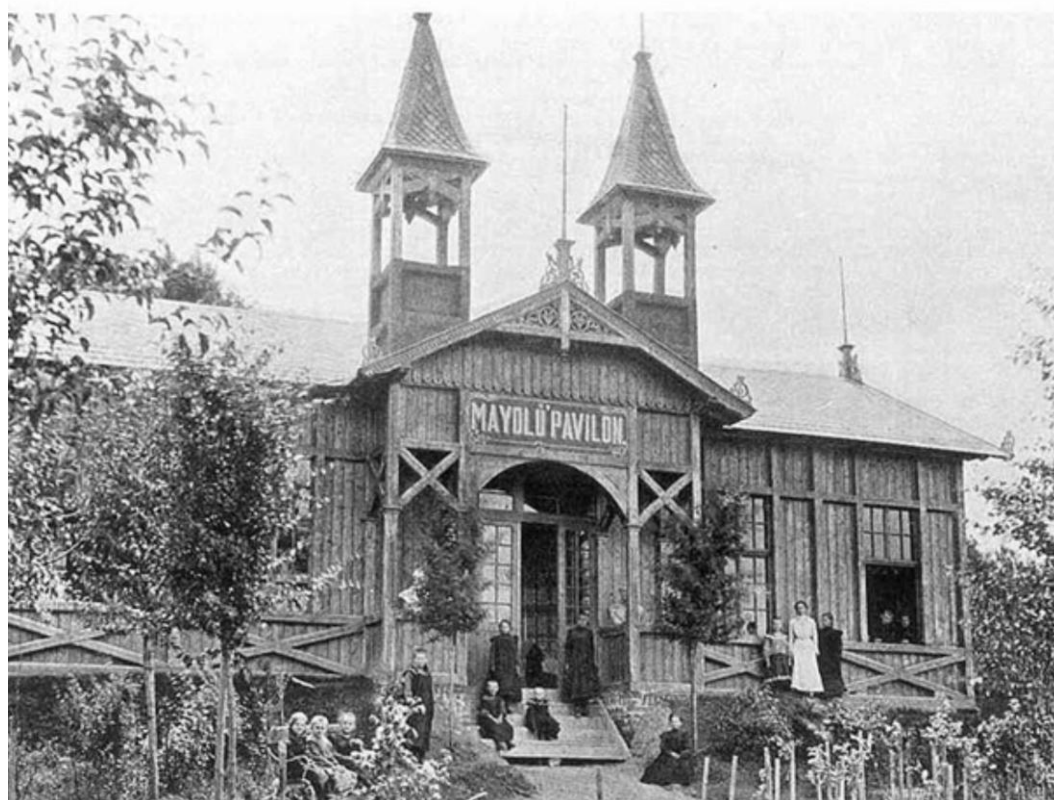
5. Maydlův dřevěný pavilon