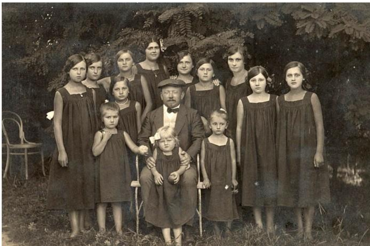
8. Dívky v typickém ústavním obleku, tzv. empíru