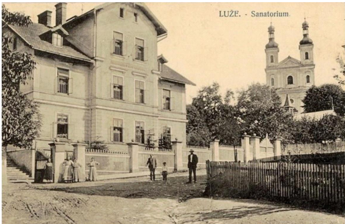
6. Pohled na lužské sanatorium