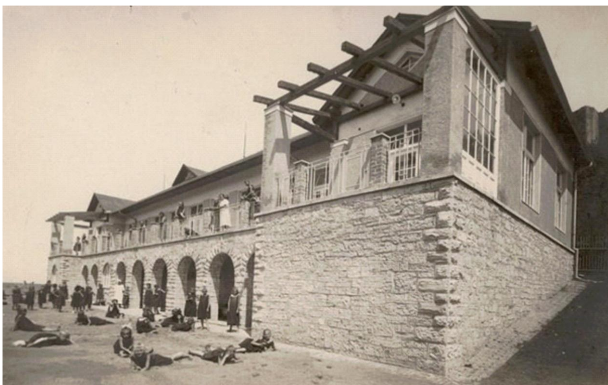
11. Sluneční pavilon