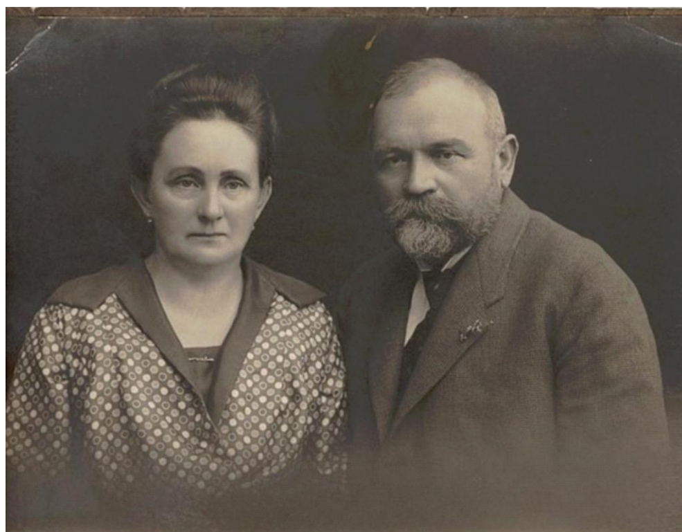
3. Manželé Hamzovi