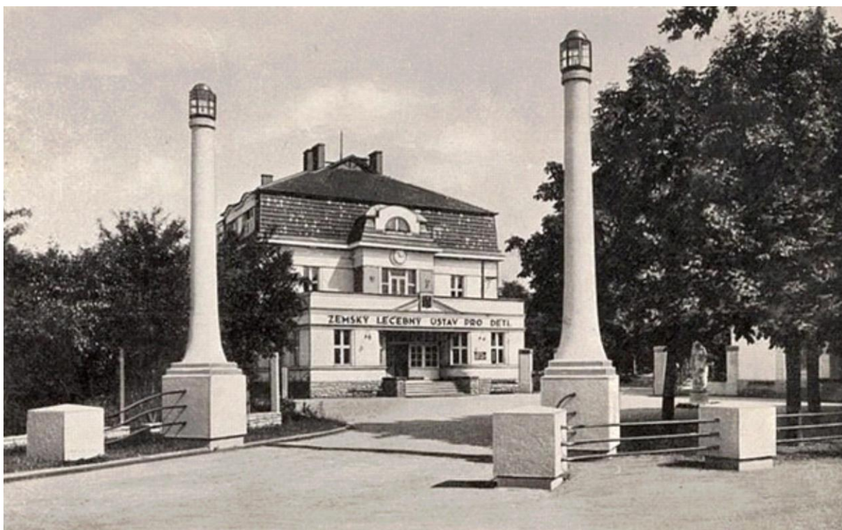
10. Pohled na vstup ústavu