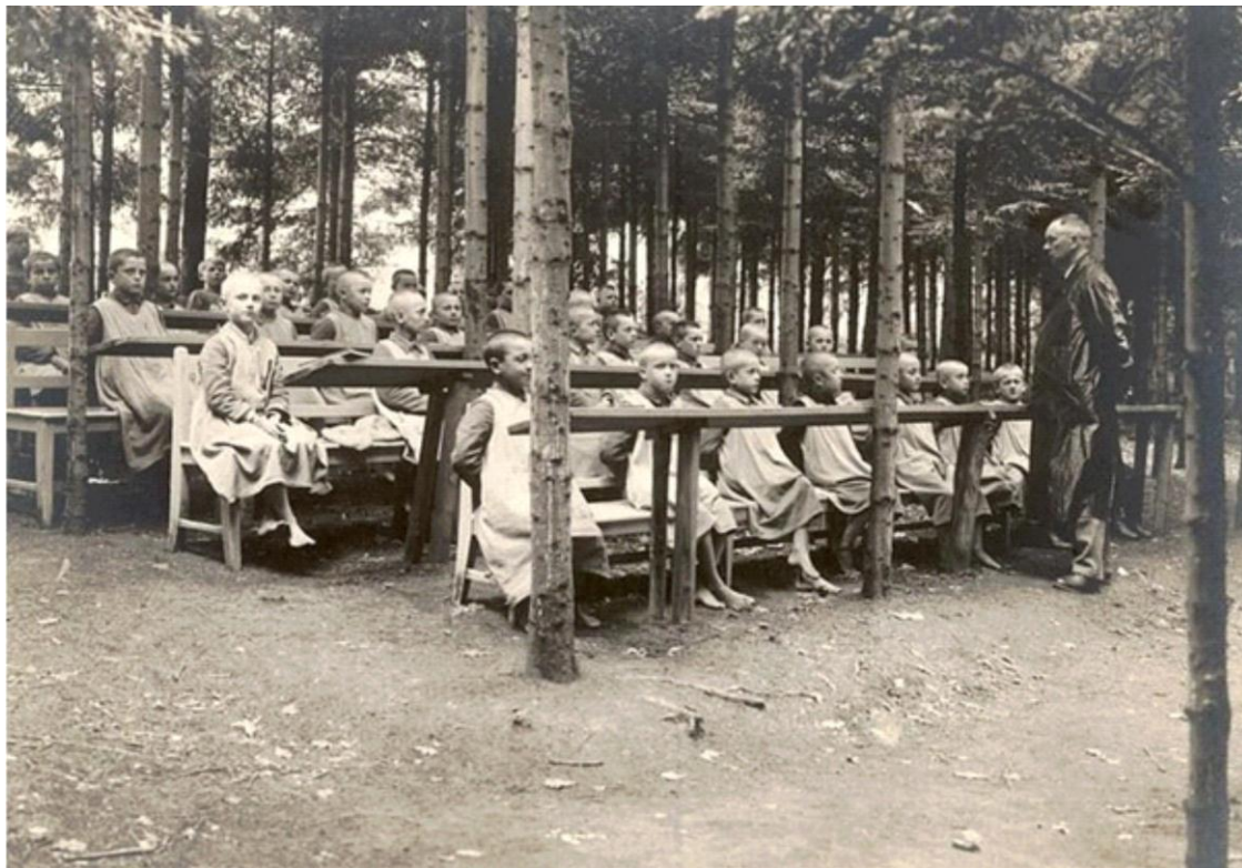
7. Výuka v lesní škole