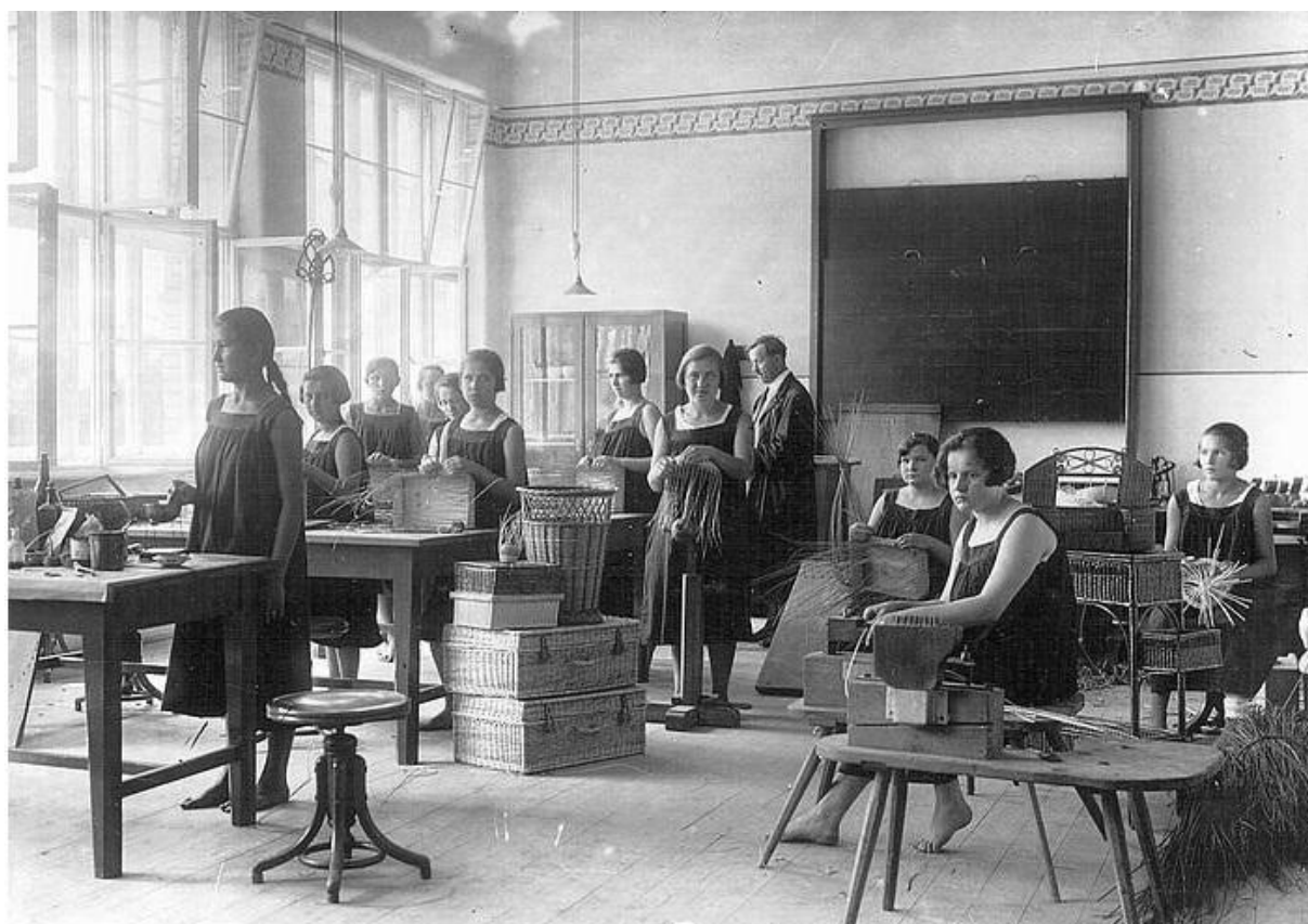
9. Výuka v košíkářské dílně