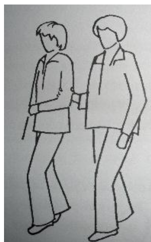
Obr. 3 – chůze nevidomého člověka s průvodcem

Všechny tyto věci jsem si vyzkoušela při své odborné praxi a průvodcovskou službu jsem poskytovala neustále, když byla potřeba. Byla jsem velmi ráda, že mohu být nějak nápomocná takto postiženým lidem a velmi mě práce s nimi bavila.