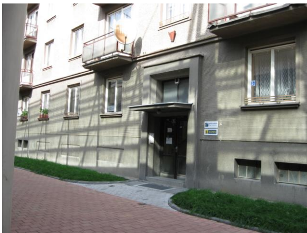
Obr. 2 – TyfloCentrum Hradec Králové, o. p. s.

TyfloCentrum Hradec Králové, o. p. s. má celkem 12 pracovníků. 9 pracovníků pracuje na hradeckém pracovišti, 1 pracovnice je na detašovaném pracovišti v Jičíně, 1 pracovnice je na detašovaném pracovišti v Náchodě a 1 pracovnice je externí. Je tu 8 sociálních pracovníků, kteří musí mít buď vyšší odborné vzdělání, nebo vysokoškolské vzdělání. 2 pracovníci v sociálních službách, kteří musí mít kurz pracovníka v sociálních službách. A 2 lektori náročných kompenzačních pomůcek, kteří musí mít kurz pracovníka v soc. službách nebo vzdělání jako sociální pracovníci. Vše dle Zákona o sociálních službách č. 108/2006 Sb.