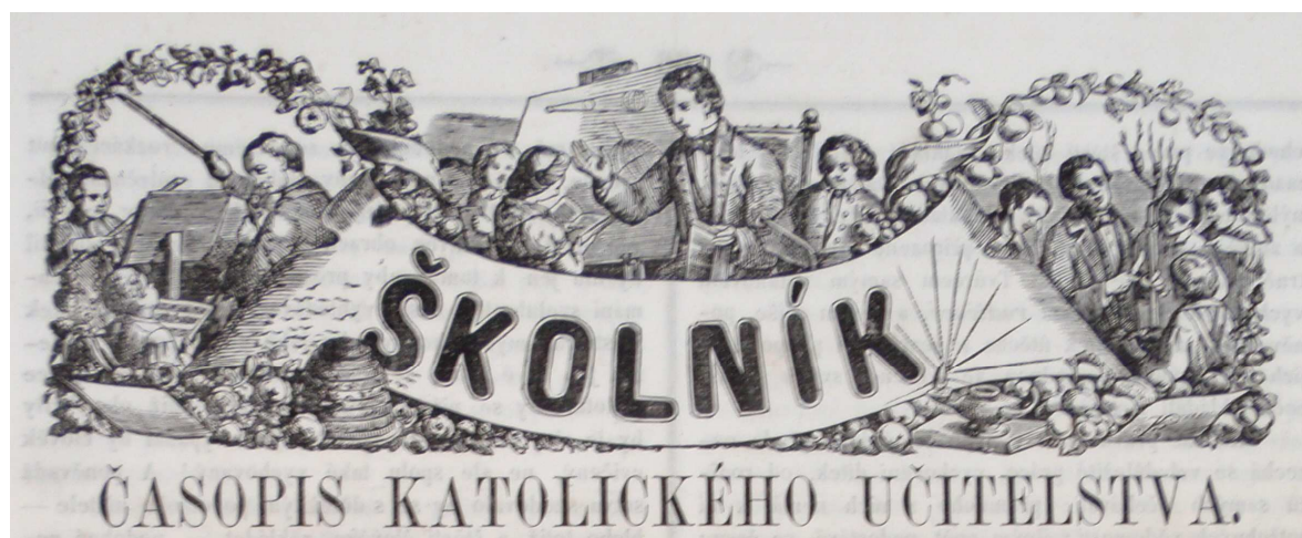
Záhlaví časopisu Školník ( Školník , 1864, roč. 4, č. 9)