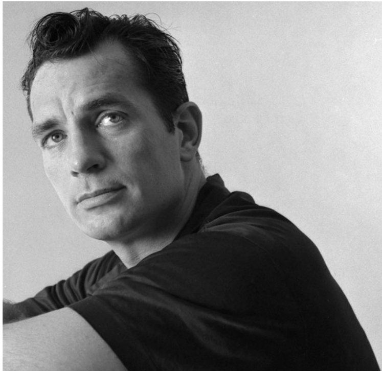
Ilustrace III: portrét Jacka Kerouaca