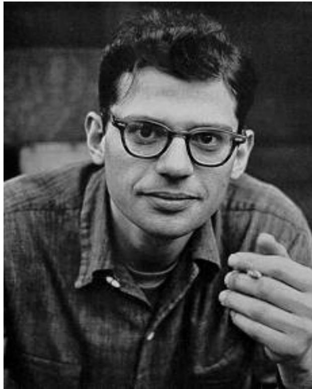
Ilustrace V: portrét Allena Ginsberga