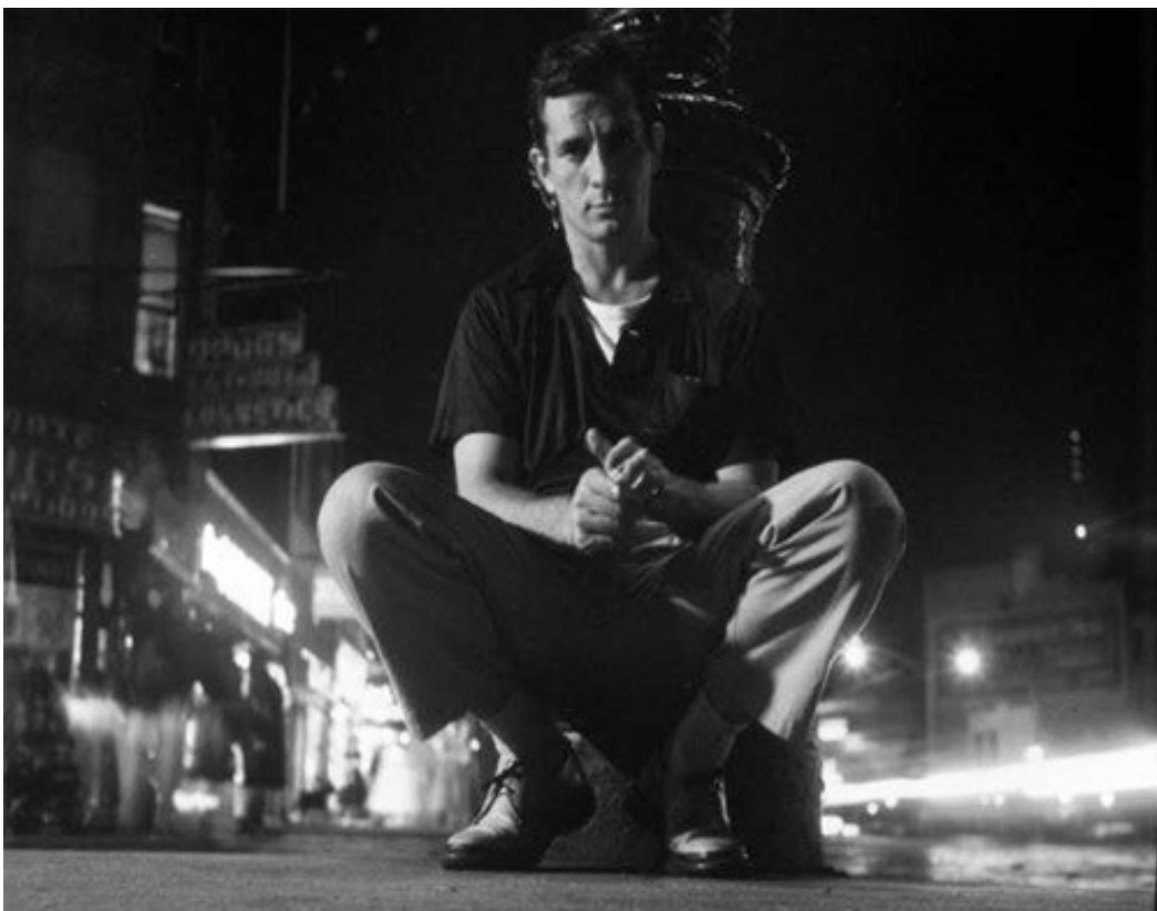
Ilustrace IV: Jack Kerouac