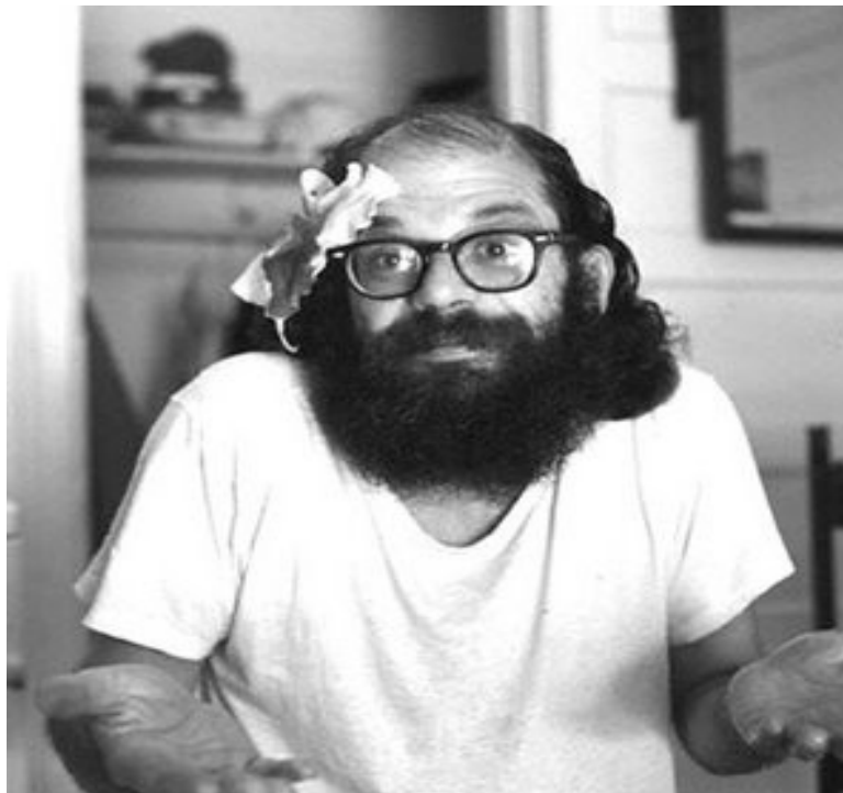
Ilustrace VI: Allen Ginsberg