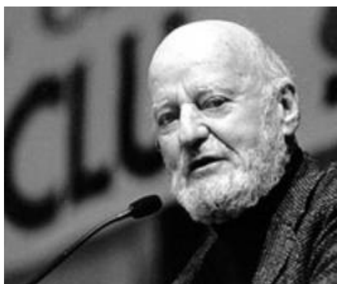
Ilustrace VIII: Lawrence Ferlinghetti