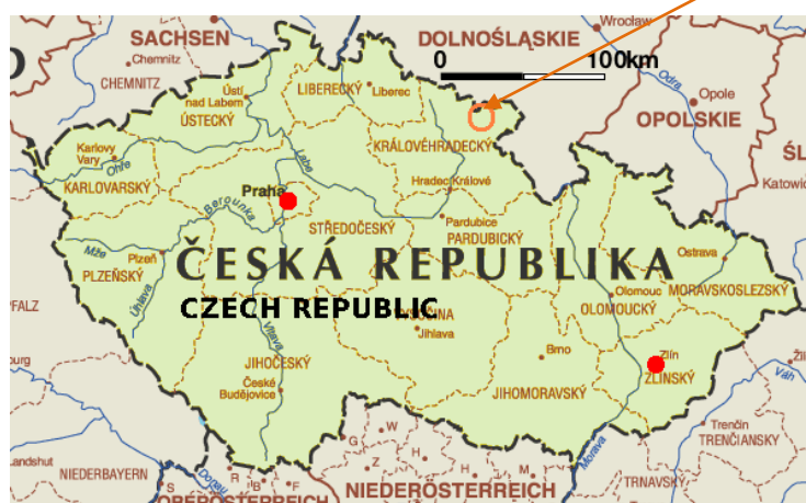
Obr. 1: Lokalizace mikroregionu v kontextu České republiky

Celkem zde žije 15 249 5 obyvatel, kteří se na celkovém počtu obyvatel okresu Trutnov podílí 12,5 %. Hustota osídlení je 137 obyvatel / km 2 .