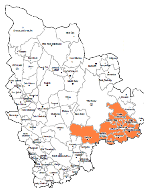
Obr. 2: Vymezení mikroregionu v rámci okresu Trutnov