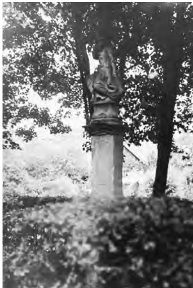
Chyjice, pilíř se sochou Krista nesoucího kříž, 1935

Účty se zapisují do zvláštní knihy v archivu uložené.