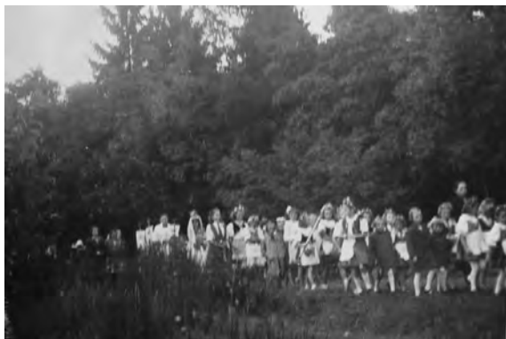
Děková procesí na Loretu, 1945