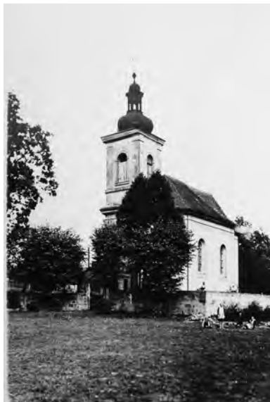
Kaple sv. Matouše v Dolanech, 1935

Tento kostel býval již ve 14. století plebanským, což tím nápadnější se býti jeví, jelikož ves pouze 24 čísel popisných se 191 obyvateli čítá a nadto vše v blízkém sousedství jejím dva plebanské kostely, na východ kostelecký a na západ chyjický, stávaly. Tvořila totiž celou plebanií samojediná ves Dolany, proto také odváděl zdejší kostel pouze tři groše z desátku. Lze si to poněkud odtud vysvětliti, že zemanstvo a rytířstvo zdejší krajiny v oné době podníceno příkladem zbožného krále a otce vlasti Karla IV., jakož i neméně zbožností svou věhlasného arcibiskupa pražského Arnošta z Pardubic a ze Staré, 261 jakoby v závod na svých svobodných statcích kostely stavělo a plebánie zakládalo, dávaje tudy najevo péči o náboženské vzdělání a duchovní blaho svých poddaných.