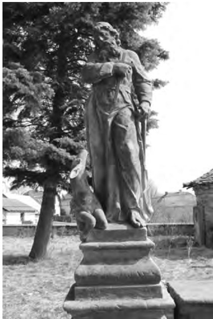
Současný stav sochy, foto 2010

Socha sv. Ivana má celkovou výšku 176 cm. Světec je zobrazen s laní ležící u pravé nohy. Socha je provedena ve světlém jemnozrnném pískovci pocházejícím s největší pravděpodobností z panských lomů nedaleko Veliše.