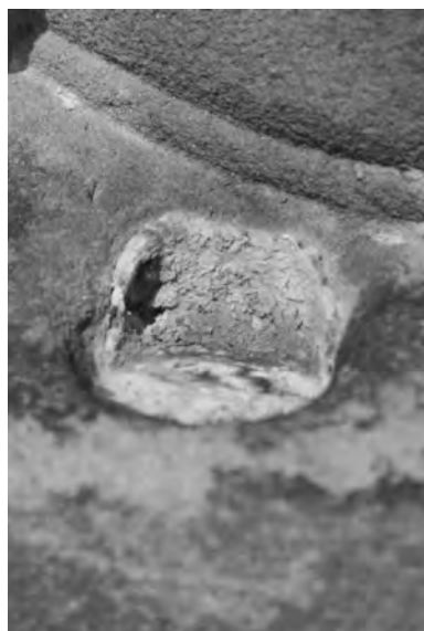
Detail jamky pro zasazení berly u sochy sv. Metoděje na rampě u kostela ve Velišiš

Informace o umělcích, kteří pracovali na konkrétních zakázkách, jsou cenným přínosem každé kroniky. Tvoří základní kameny pro práci uměleckého historika a mohou pomoci také restaurátorům. Pokud hledají pro poškozená díla srovnání v celém souboru uměleckých artefaktů jednoho autora, mohou nalézt podobná výtvarná řešení a při nedostatku starší fotodokumentace tak dosáhnout pravděpodobné rekonstrukce poničeného objektu per analogiam.