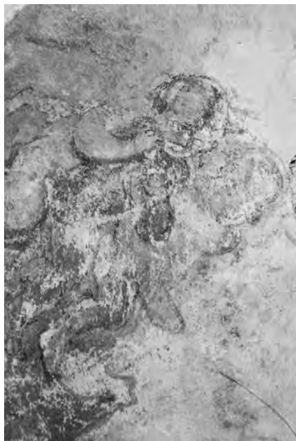
Detail letících andělích postav vlevo od středu scény

Nástěnná malba s motivem Piety se nachází nad oltářní sarkofágovou menzou ve čtvercové přízemní kapli se skosenými hranami ze smíšeného pískovcovo–cihlového zdiva. Kaple je zaklenutá klášterní klenbou a zastřešená stanovou střechou krytou pálenými taškami. Na vrcholu kaple je umístěna kamenná socha anděla posledního soudu.