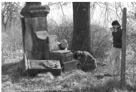
Průzkum polychromie a měření poničeného sousoší sv. Jana Nepomuckého, Vavřince a Donáta pod vrchem Velišiš

Informace o umělcích, kteří pracovali na konkrétních zakázkách, jsou cenným přínosem každé kroniky. Tvoří základní kameny pro práci uměleckého historika a mohou pomoci také restaurátorům. Pokud hledají pro poškozená díla srovnání v celém souboru uměleckých artefaktů jednoho autora, mohou nalézt podobná výtvarná řešení a při nedostatku starší fotodokumentace tak dosáhnout pravděpodobné rekonstrukce poničeného objektu per analogiam.