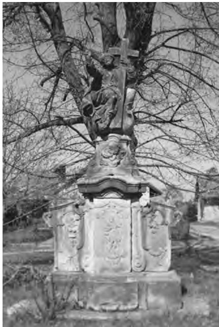
Současný stav sousoší s chybějícími andálky, 2010

Pozdně barokní sousoší Spasitele o celkové výšce cca 380 cm je situováno na širokém trojdílném soklu a je obráceno čelem k jihovýchodu. Vzniklo v roce 1770 a od počátku stojí, jak místo charakterizuje kronika: „ na náměstí u studny “. Základnu sousoší tvoří masivní sokl (200 x 47 x 245 cm), ve předu uprostřed vypouklý, zdobený reliéfem sv. Floriána v rokajové kartuši. Boční podstavce jsou v horní části do stran odsazeny a zvýrazněny esovitými profilovanými články. Zakončují je šikmé volutové římsy. Na čelní straně podstavců jsou vytesány asymetrické kartuše. V kartuši zezadu podstavce stojí sv. Linhart s mitrou, berlou a knihou a beránky u nohou. Střední sokl završuje oblounovitá římsa, boční sokly úseky volutových říms s reliéfními hlavičkami andálků. Vrchol sousoší tvoří Kristus v rozevlátém šatě sedící na zeměkouli, vysoký 135 cm. Obkročmo svírá latinský kříž, který nahoře přidržuje levou rukou. Pravíci žehná. Postavy andálků byly odcizeny před několika málo lety. Sousoší stojí pod vzrostlými listnatými stromy, což způsobuje značné biologické napadení mechy a lišejníky. Na kameni se tvoří tmavé depozity, zřejmě krusty, které způsobují úbytek hmoty (pod křížem na kouli, v čelním reliéfu). Statika základny je narušená prorůstajícím keřem, který mezi kameny působí jako klín. Žehnající ruce Krista schází dva prsty. Drobné stopy polychromie. Sousoší je zapsáno ve státním seznamu nemovitých kulturních památek.