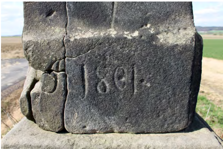
● Chyjice, kříž u lípy v poli jižně od obce, datace na soklu