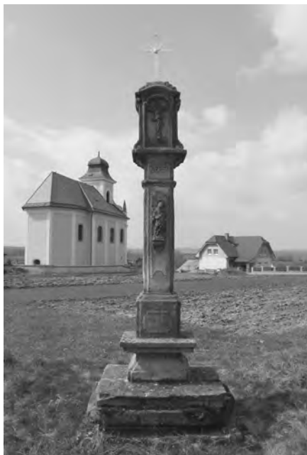
Současný stav božích muk, foto 2010

Boží muka stojí nad obcí Chyjice, vedle raně barokního kostela sv. Šimona a Judy, nedaleko křižovatky cest do Vesce a Kostelce. Pilíř s vrcholovou kaplicí je orientován zadní stranou ke kostelu a čelem k cestě.