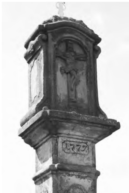
Detail vrcholové kaplice s datací, foto 2010