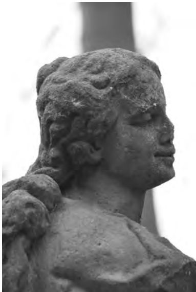
Fotografie poškozené hlavy Panny Marie z piliře v Kostelci

V následující kapitole čtenář najde část práce, kterou studenti 3. ročníku v rámci semináře Dokumentace a historický výzkum – management regionálního dědictví odvedli. Publikované texty jsou jen mezistupněm vytvořeným pro potřeby sborníku. Výsledné dokumentace v podobě orientačních restaurátorských průzkumů v současnosti teprve vznikají. Jejich informace mohou do budoucna sloužit nejen jako pramen zachycující stav sledovaných děl v roce 2010, ale také jako základní báze pro žádosti o grant nebo jako poučení, v jakém fyzickém stavu jednotlivé památky jsou, a zda je nutné věnovat jim odbornou pozornost.