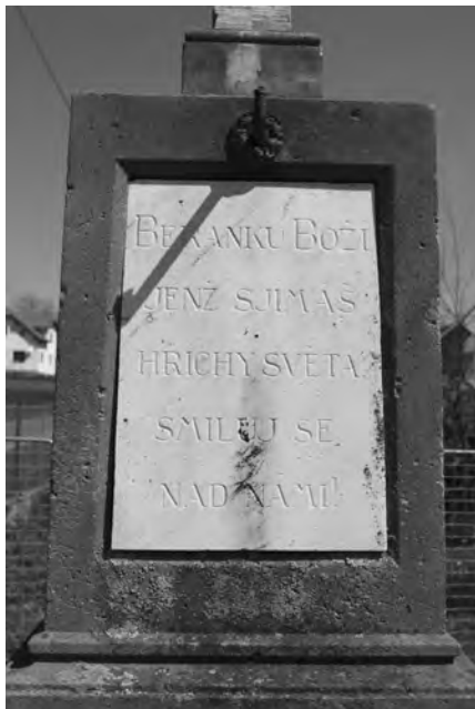
Mramorová nápisová deska na čelní straně soklu.

Kamenný kříž o celkové výšce 290 cm stojí na kamenné základně pyramidového tvaru třech podstavců o půdorysu 101 x 60 cm. Je ohraničen čtyřmi kamennými sloupky zakončenými jehlancovitě, z nichž jeden je vyvrácen a leží na zemi u objektu. Ve sloupcích jsou vysekané kulaté otvory pro dřevěný plůtek, který však schází. Hranolový podstavec pod křížem nese na čelní straně nápisovou desku z bílého neleštěného mramoru, nad kterou je zasazen kovový úchyt, zřejmě zbytek po lucerně.