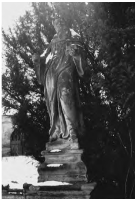
Fotografie ze 70. let 20. století