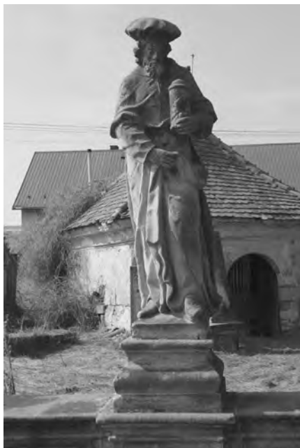
Současný stav sochy, foto 2010

Socha sv. Kosmy vytesaná z jemnozrnného pískovce, který byl pravděpodobně vytěžen v nedalekém lomu u Podhradí, je vysoká 185 cm. Je postavena na mírně se zužujícím soklu s výrazným oblounem ve středu výšky. Socha je pevně spojena s plintem, který je z části poškozený a doplněný maltou.