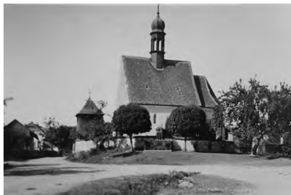
Kostel sv. Prokopa v Nadslavi, 1935