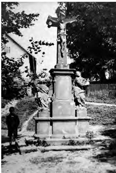
Bukvice, sousoší Kalvárie