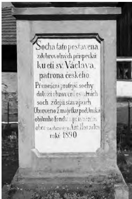
Nápisová deska soklu sochy, foto 2010

Autorem sochy sv. Václava, postavené na střevačské návsi v roce 1890, je Antonín Sucharda z Nové Paky. Socha byla vytesána z jemnozrnného pískovce. Je vysoká cca 400 cm, v nejširším bodě je objekt široký 95 cm.