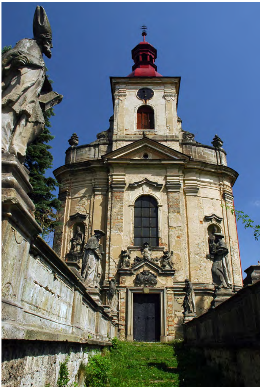
● Veliš, kostel sv. Václava s rampou se sochami českých patronů