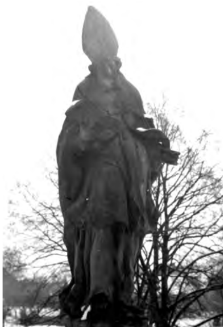
Fotografie ze 70. let 20. století