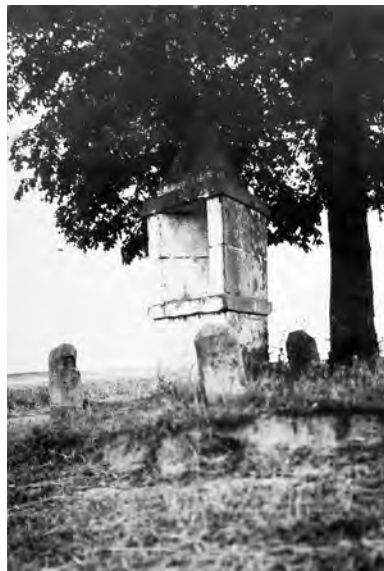
Trojboká kaple u polní cesty jižně od Chyjic