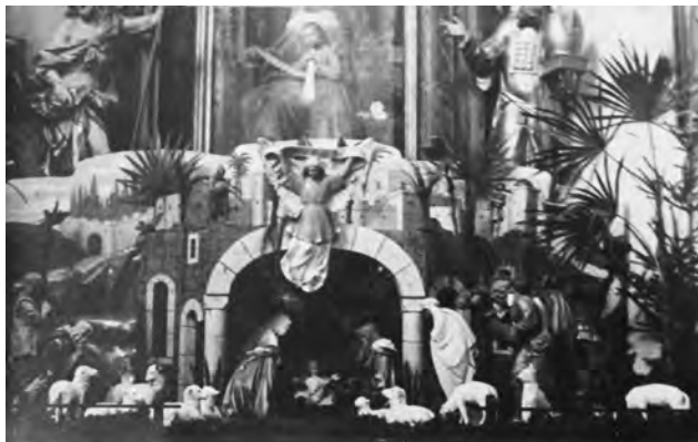
Jesličky ve velišském kostele, 30.–40. léta 20. století

Podotknouti sluší, že všechny oltářní obrazy vesměs mají široké, pozlacené, svrchu arabesky opatřené rámce.