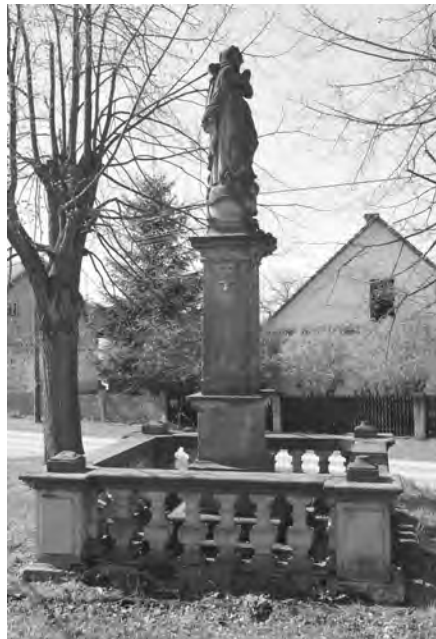
Pilíř se sochou Panny Marie, současný stav, 2010