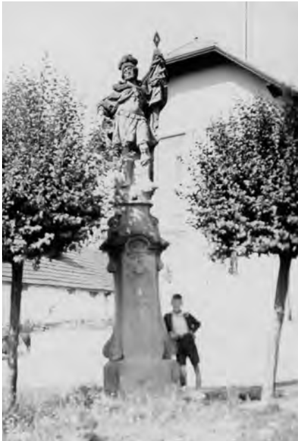
Historická fotografie sochy z roku 1933