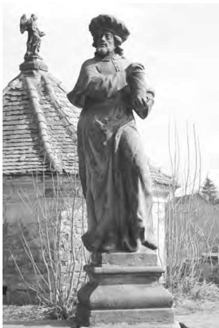
Současný stav sochy, foto 2010

Socha sv. Damiána je protějškem sv. Kosmy a je posazena na galerii jako druhá vlevo za vstupní branou. Je vysoká 185 cm a je postavena na soklu s výrazným oblounem ve středu výšky.