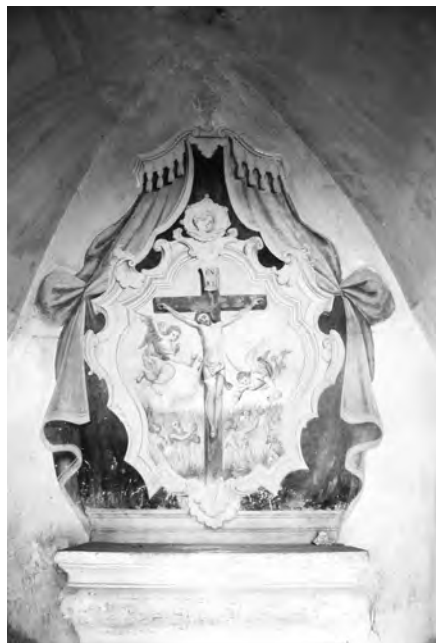
Malba s motivem Ukřižování a dušemi v očistci