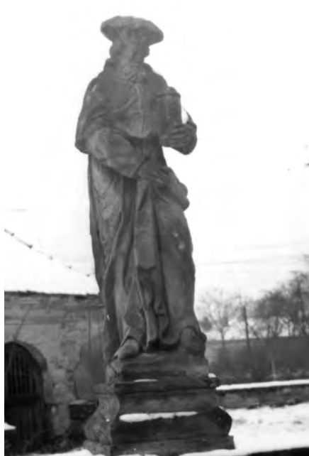
Fotografie ze 70. let 20. století