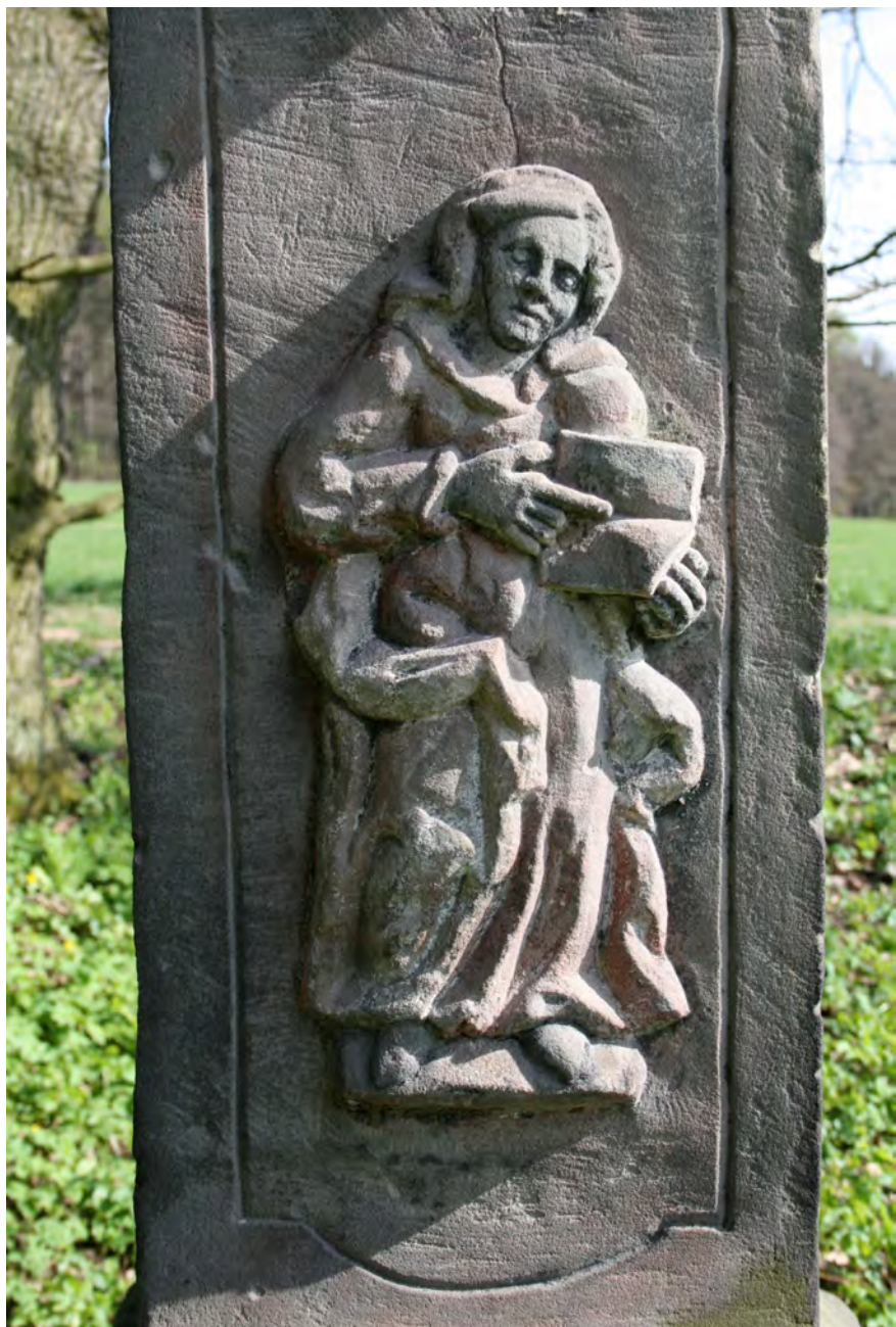
● Křelina, socha sv. Jana Nepomuckého, detail postavy (sv. Anny?) na střední části podstavce