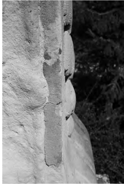
Detail omyté části reliéfu soklu s novodobým tmelem