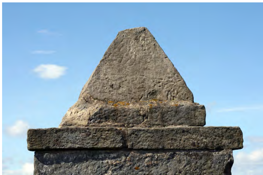
● Chyjice, trojboká kaplička, detail vrcholové části se špatně čitelným nápisem, snad CHYJIZ