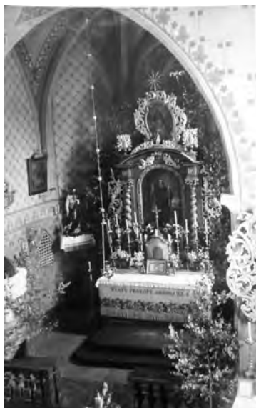
Interiér kostela sv. Prokopa v Nadslavi, nedatováno

I tento starožitný chrám Páně byl druhdy plebánským, při němž zřízeno bylo kaplanství. Pod zdejšího plebána slušela obec Nadslav, Štidla a Střevač. Plebán odváděl 8 českých grošů desátku papežského obročí zdejšího plebána záleželo v požiticích z farního pole a zahrady, v dříví ze zádušního lesa a v peněžitém důchodu. Tak ku příkladu mimo jiné dostával každoročně z dotace Smila ze Staré od plebána ve Staré 15 grošů. (L. erect. II. p. 212), počínaje 22. 1. 1384.