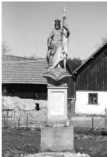
Současný stav sochy sv. Václava, foto 2010