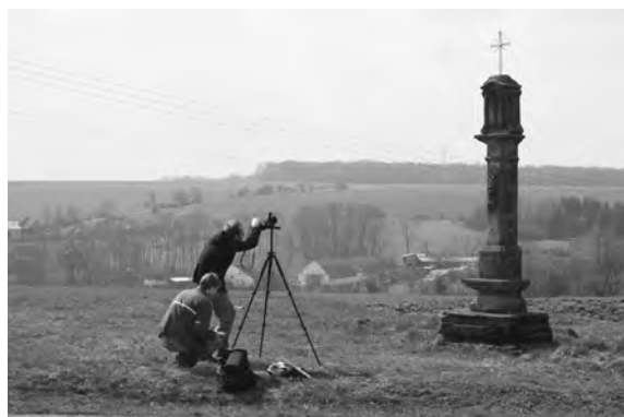
Fotodokumentace božích muk u kostela v Chyjicích