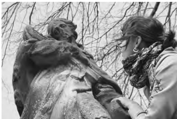
Průzkum sochy sv. Jana Nepomuckého pod vrchem Veliš