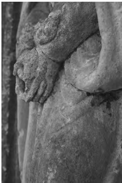
Detail poškození rukou na reliéfu Panny Marie

Novogotický kříž na křižovatce cest na západním okraji obce Křelina je obrácen směrem k východu. Stojí ve svahu nad cestou a je přístupný třemi stupni schodiště. Na podstavě o rozměrech 125 x 78 cm je umístěn masivní hranolový sokl o celkové výšce 228 cm s oddělenou spodní částí, která je v čele opatřena mramorovou deskou s tesaným nápisem s písmeny obtaženými černou barvou: Sem ku kříži/ chvátejte/vy kteří pracujete/ a obtíženi jste a/ budete občerstveni/ mat:11.28 . Nápis na zadní straně soklu ozřejmují autorství, objednavatele a dobu vzniku kříže: Zlat. Alois Khun/ Sochař ve Vojčích a Postaveno nákladem/ obce Křelinské/ roku 1880 .