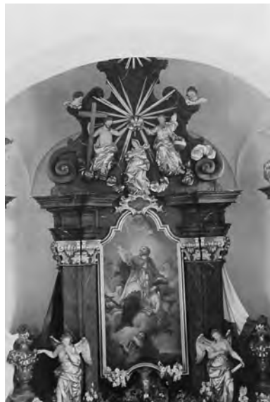
Oltářní obraz v kapli sv. Jana Nepomuckého v Bukvíči, obnovený v roce 1944