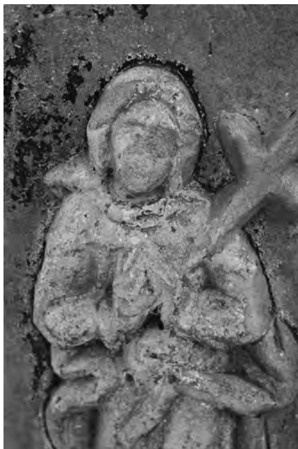
Detail reliéfu Bolestné P. Marie s doplňkem meče

Kříž stojí mezi vzrostlými stromy uprostřed křižovatky cest na západním okraji obce. Tvoří jej starší kamenný podstavec o výšce 180 cm, osazený na základně o půdorysu 100 x 100 cm, završený mladším litinovým křížem vysokým 86 cm. Stojí na tradičním místě, kde máme podobný objekt zachycen už na mapě stabilního katastru z roku 1842. Polní trať za cestou směrem k Chyjícím od něj dostala i název „U kříže“. Původní kříž se pravděpodobně poškodil a jeho vrcholová část byla umístěna do nedaleké ohradní zídky. Kříž stojí na kamenném soklu s profilovanou římsou. Na čelní straně je opatřen reliéfem s postavou Bolestné Panny Marie s rukama sepjatýma na hrudi probodené mečem, na které jsou patrné zbytky polychromie.