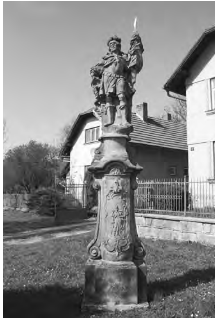
Současný stav sochy, foto 2010

Pilíř se sochou sv. Floriána o celkové výšce asi 4 m je situován u hlavní komunikace v obci a je vytesán ze světlého pískovce. Na čelní straně mírně konvexně vypouklého soklu na půdorysu 90 x 59 cm je postaven kónický podstavec, čelní strana je konvexní s volutovými příložkami po stranách ve spodní a horní části. Podstavec završuje segmentově vzduťatá římsa ve střední části, která je zdobena vytesanou mušlí. Uprostřed čelní strany podstavce je umístěn reliéf opata sv. Linharta. Světec je zobrazen v ozdobném liniovém orámování, v horní části se stylizovanou rokají. Nad orámováním je vytesáno A. D. //17/67 . Roku 1999 sochu restauroval Jan Kerel.