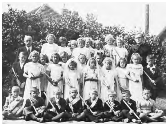
První svatě přijímání, 1945