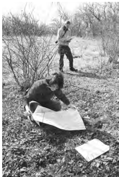
Ověřování polohy památky v mapách

Edice farní kroniky, zpracovaná v zimním semestru roku 2009 studenty Filozofické fakulty, byla využita přímo při práci v terénu. Dodala výzkumu důležitá vodítka v podobě písemných záznamů a fotografií. Mezioborová spolupráce fakult Univerzity Pardubice v letošním školním roce vyvrcholila publikací, kterou čtenář drží v ruce. Možná mu ale při čtení vystane na mysl neodbytná otázka: proč studenti pracují tak daleko od svého působiště v Pardubicích a Litomyšli? Jednoznačnou odpovědí je Mariánská zahrada. Barokní krajinný koncept sestavený z architektonických dominant, které vystupovaly v lesních průsecích a byly rámovány alejemi, je díky studiím z posledních let dobře znám, stejně jako nedaleká koncepce Valdštejnovy krajinné osy. 13 Mariánská zahrada ale není jen rekonstrukcí počínu