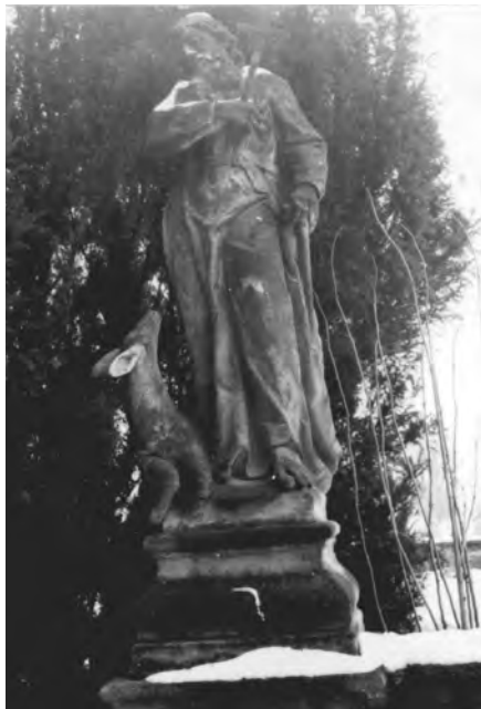
Fotografie ze 70. let 20. století