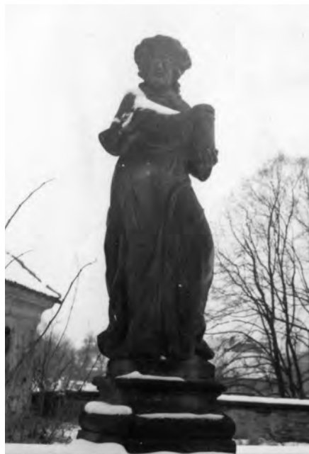
Fotografie ze 70. let 20. století