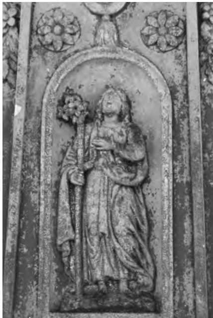
Reliéf sv. Josefa se zbytky zláčení a polychromie

Hranolovitý pilíř, který má ve středu zlatou niku s postavou sv. Josefa, nese sochu Panny Marie na zeměkouli stojící na hlavě hada. Celková výška objektu je 481 cm, z toho pilíř tvoří 311 cm a vrcholová socha 170 cm.