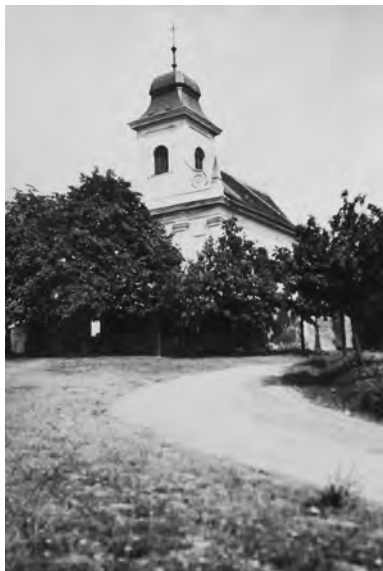
Kostel sv. Šimona a Judy v Chyjicích, 1935

Vzdělán jest ve slohu obyčejném, pod titulem svatých apoštolů Šimona a Judy, beze všech kamenických ozdob, jak vně tak i uvnitř.