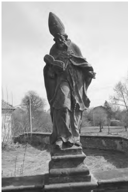
Současný stav sochy, foto 2010

Socha sv. Metoděje je vytesána z jemnozrnného pískovce, který pochází pravděpodobně z nedalekého lomu u Podhradí. Stojí na rampě jako první z řady soch vpravo na galerii za vstupní branou ke kostelu.