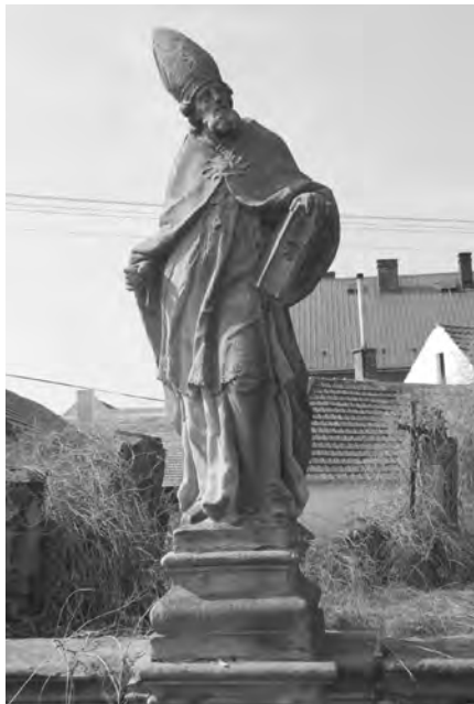
Současný stav sochy, foto 2010

Pískovcová socha sv. Cyrila stojí jako první z řady soch vlevo na galerii za vstupní branou ke kostelu. Jejím protějškem je socha sv. Metoděje.