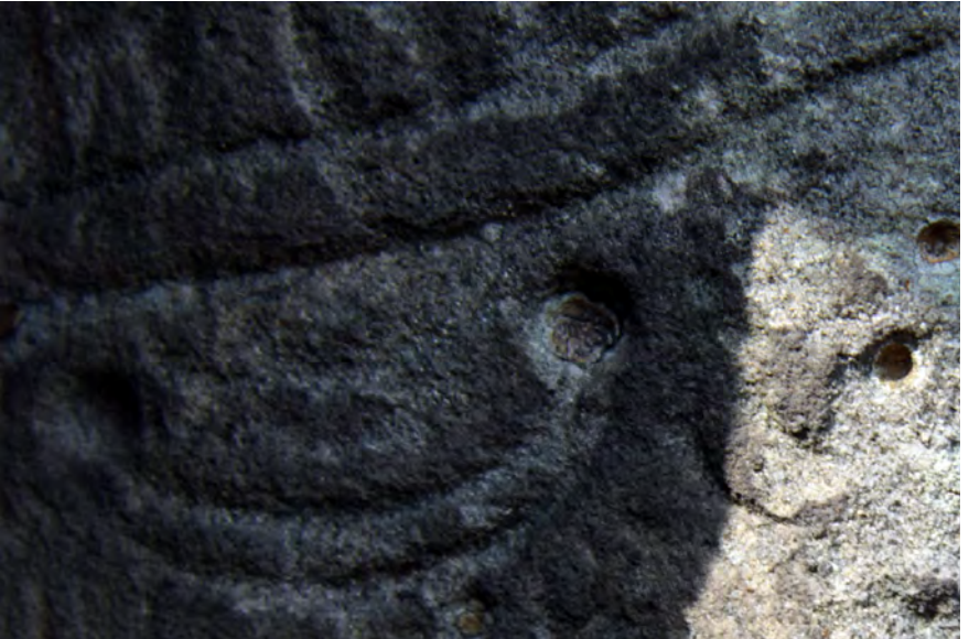
● Veliš, socha sv. Cyrila na rampě před kostelem, bordura roucha se zbytky barevných nátěrů