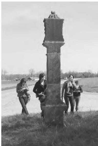
Dokumentace božích muk u Střevače

Studenti semináře Fakulty restaurování se v letním semestru roku 2010 věnovali dokumentaci vybraných drobných památek v oblasti velišské farnosti. Neměli možnost sledovat všechny obce, které farní obvod zahrnuje, a dokonce ani všechna díla ve vybraných obcích, přesto jejich práci můžeme považovat za počátek systematického zkoumání. Na místě samém určovali poškození děl, degradaci materiálu a její důvody. Objekty důkladně měřili, identifikovali pozdější doplňky a také hledali fragmenty původních barevných úprav povrchu kamene.