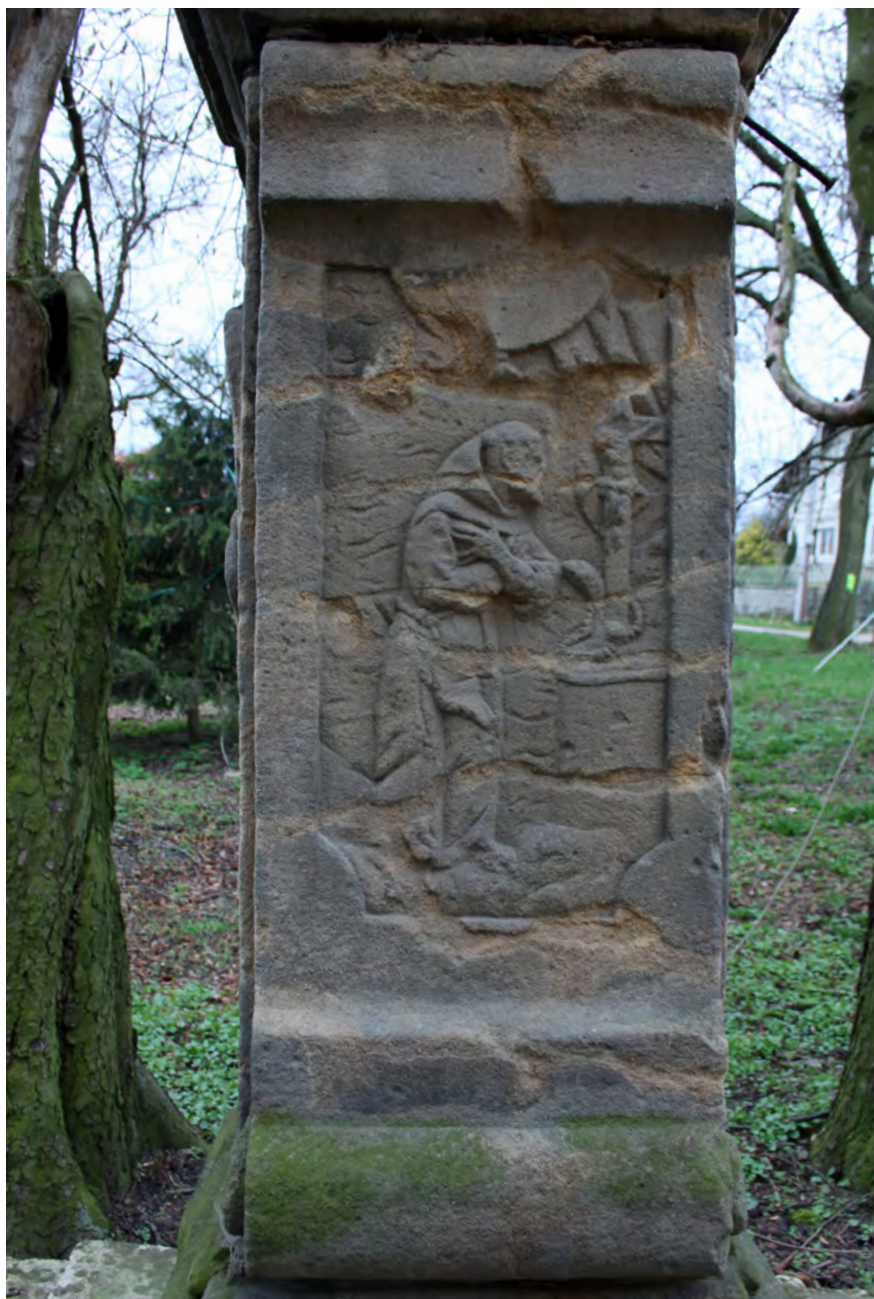
● Kostelec, pílř se sochou Panny Marie, detail soklu s reliéfem sv. Antonína Paduánského