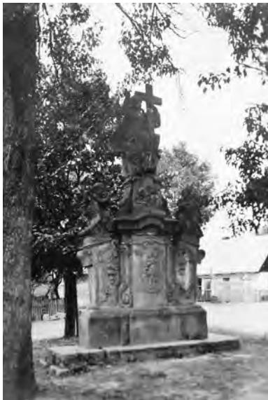
Podhradí, sousoší s Kristem Salvátorem