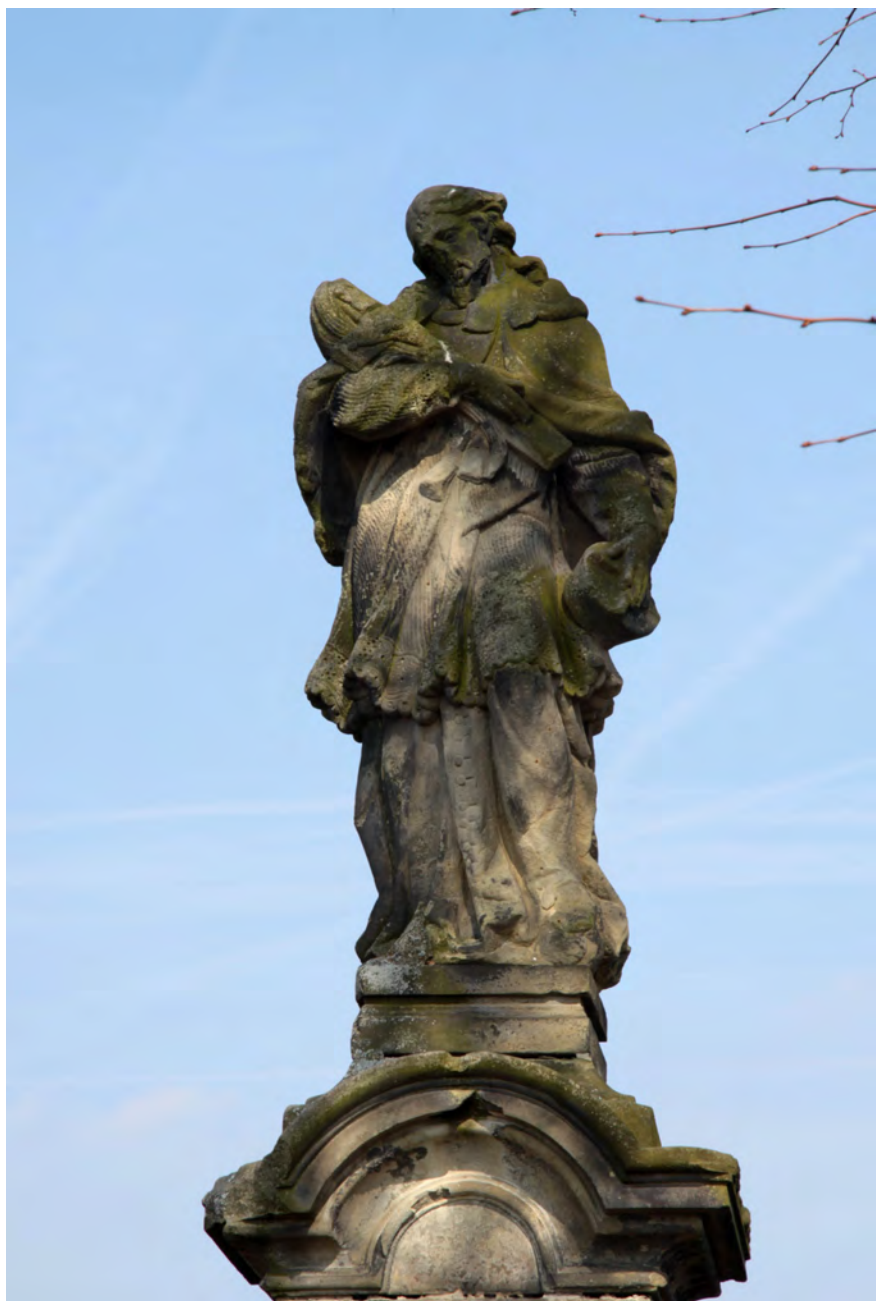
● Podhradí, sousoší sv. Jana Nepomuckého, Vavřince a Donáta, socha sv. Jana Nepomuckého