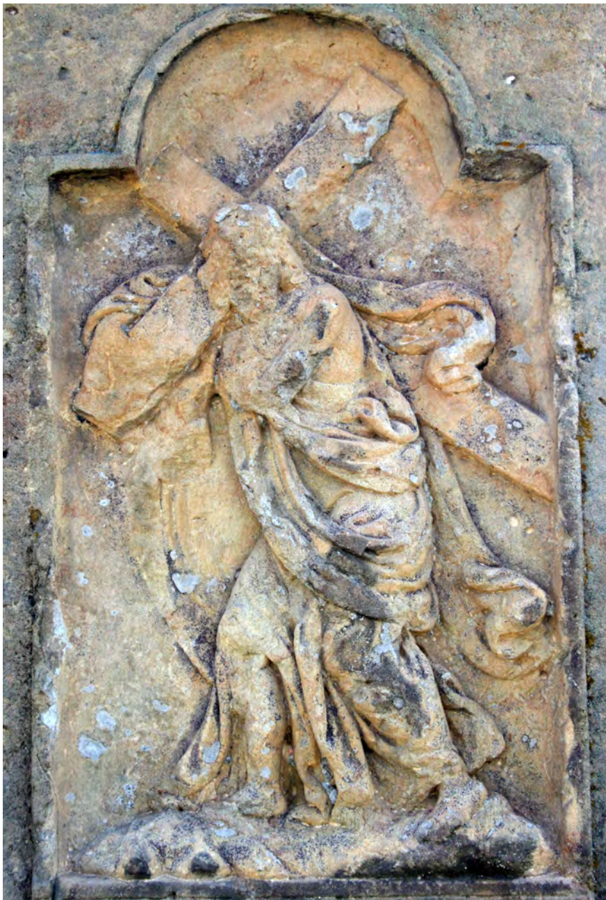
● Veliš, kříž u hřbitova, detail reliéfu Nesení kříže na soklu