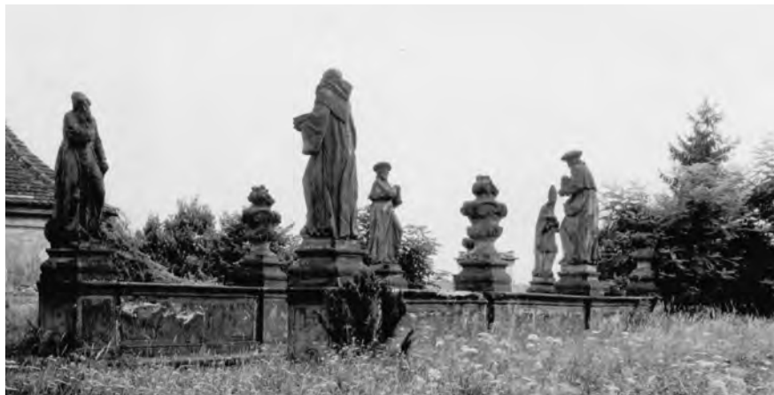
Galerie soch před kostelem v roce 1955

Rampa před kostelem sv. Václava ve Veliši vznikla při pozdně barokní přestavbě chrámu mezi lety 1748–1753. Vysoká ohradní zeď bývalého hřbitova, který byl vybudován na nově naspaném terénu, je doplněna dvěma kaplemi před jižním průčelím kostela. Podle informací velišské farní kroniky byly dvě další shodné kaple umístěny v rozích severní zdi areálu za presbytářem kostela. Mezi zachovanými kaplemi je situována sochařská galerie, která lemuje příčné schodiště vedoucí od vstupu do areálu ke vstupu do kostela.