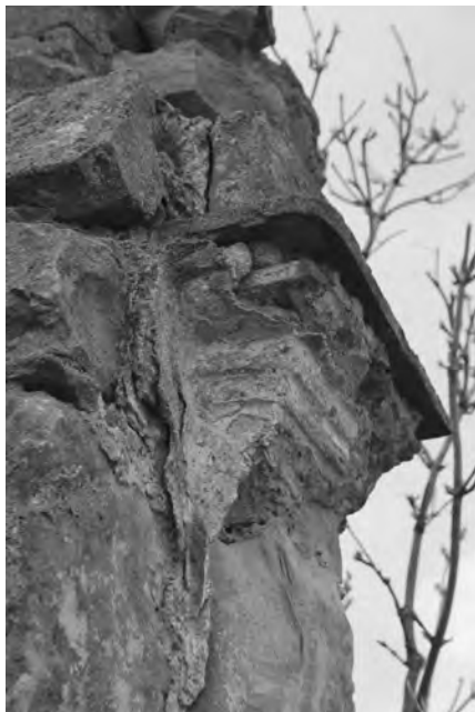
Detail hlavice pilastru se zbytkem omítky a nátěru

Kaplička se nachází severně od vsi Kostelec u polní cesty směrem na Chyjice. Na obdélném půdorysu o rozměrech 235 x 170 cm byla ze smíšeného zdiva (lomový kámen a pálené cihly) vystavěna drobná architektura vysoká po korunní římsu 270 cm. Její čelo bylo po stranách vstupu (či niky) opatřeno pilastry s římsovými hlavicemi. Pilastry nesly korunní římsu, která obíhala stavbu. Její profilaci naznačují vyčnívající římsovky dílem přitesané z běžných pálených cihel.