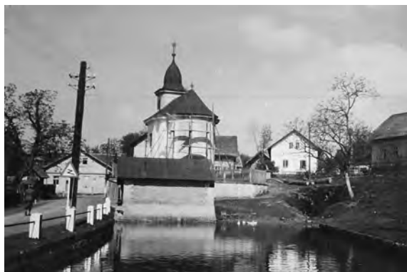
Bukvice, náves s kaplí sv. Jana Nepomuckého při opravě

Má nad návesním rybníčkem veřejnou kapli sub titulo sv. Jana Nepomuckého. Tento skrovničkový, ale úhledný chrámeček ještě ze všech ku velišské kolatuře slušících nejmladší, nebo teprv v 1767 jest vlastním nákladem občanů vzdělán a věnem dvou jiter 778 obecních pozemkův ku svému vydržování opatřen. Fundovány jsou při něm troje velké služby Boží a sice: o svátku sv. Jana Nepomuckého, v slavnosti Nejsvětější Trojice a v druhou neděli po sv. Václavu, jakožto v den posvěcení.