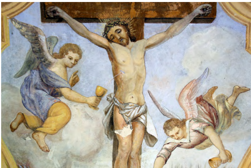
● Veliš, západní brábovní kaple, detail výmalby, scéna Ukřižování