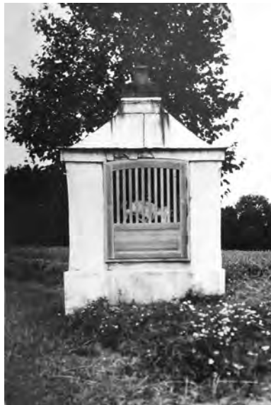
Bukvice, kaple se sousoším Piety