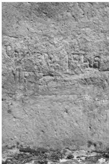
Špatně čitelný nápis o opravě božích muk u Chyjic v roce 1956

Složitější zásah čekal nástrovní malbu: „ požárem v roku 1838 celý kryt strávinšým bobužel nemálo utrpěla, jelikož z prosáklé klenbou vody plíseň vznikla, která leckteré partie nepoznatelnými učinila .“ V roce 1894 byla malba znovu vyčištěna a malována od akademického malíře Ludvíka Nejedlého z Nového Bydžova.