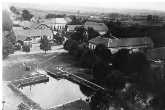
Pohled z věže kostela, nedatováno