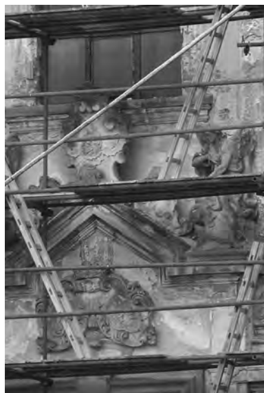
Detail střední části průčelí kostela sv. Václava ve Veliši, v současnosti opatřené lešením