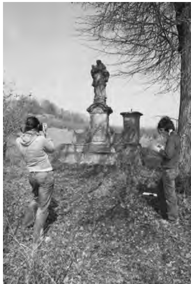
Fotodokumentace sousoší sv. Jana Nepomuckého, Vavřince a Donáta pod vrchem Veliš