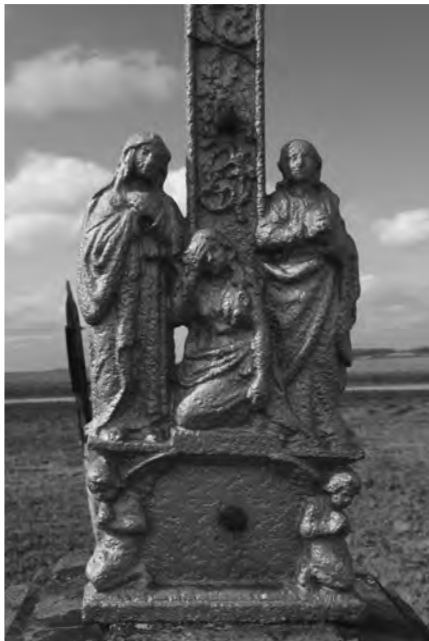
Detail paty kříže s novým nátěrem stříbrněnkou

Kříž se nachází jižně od Chyjic u polní cesty do Údrnic. Tvoří jej čtyři části: sokl, podstavec, hlavice a litinový kříž. Sokl je jednoduchý, bez profilace, podstavec je ve spodní části profilovaný, bez reliéfu a je zakončen profilovanou hlavicí. Na ní je zapuštěn litinový kříž se čtyřmi figurami. Celý objekt měří 278 cm na výšku, z toho 149 cm litinový kříž. V nejširším bodě z přední strany měří 75 cm a z boku 58 cm.