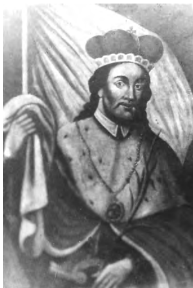
Obráz sv. Václava, původně umístěný v kanceláři fary, nedatováno

„Domus parochialis est vicina ecclesiae, constat ex bonis materialibus, est adhuc in statu mediocri, quia annis abhinc 24 de novo reparata, ad duas consignationes erecta quinque in se continet cubicula. Ad est horreum, utcumque in statu reparationis tamen nessesario. Habentur hic etiam stabula pro equis et vaccis et ovibus. Modernus protoparochus servat 4 equos nessesario, et saltem 8 vaccas et 18 oves. Parochialis domus est prope ad ecclesiam ubi et schola. Parochiam et scholam conservare et restaurare hoc usque habuit onus, ecclesia sin peculiam ecclesiae, qua ex causa, ignoratur.“ 215