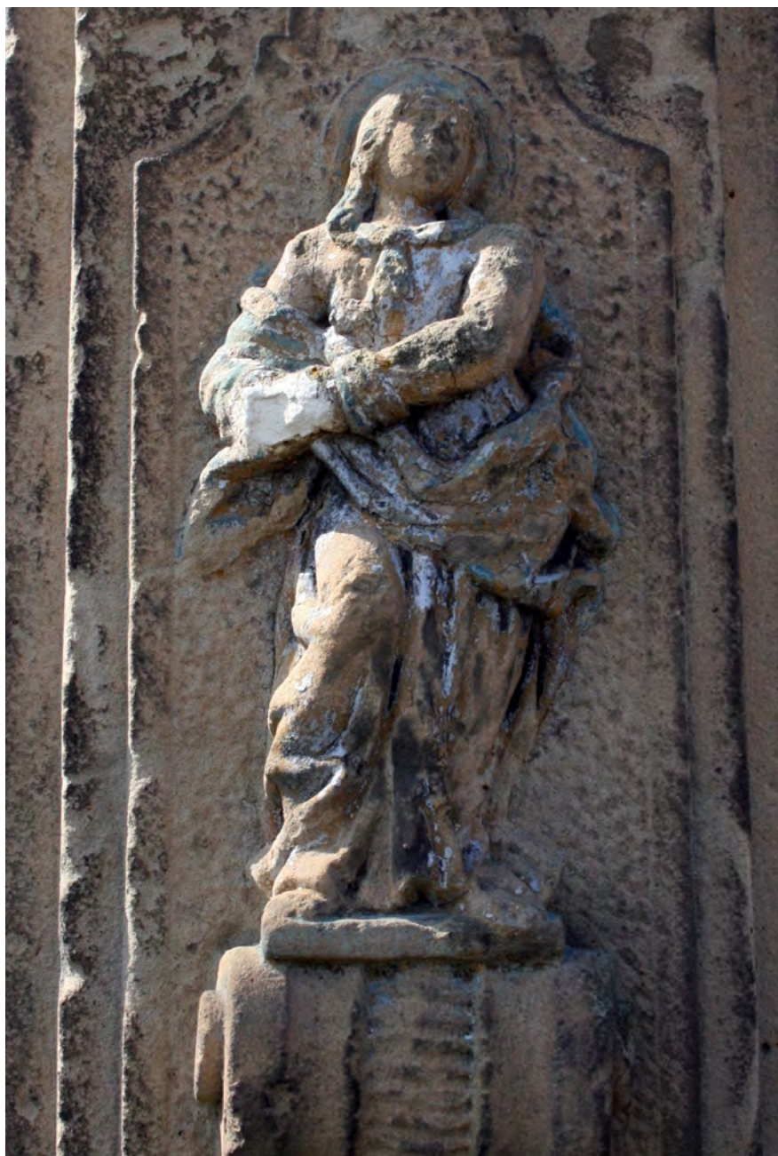
● Střevač, boží muka za obcí na Nadslav, reliéf Panny Marie ve středu piliře