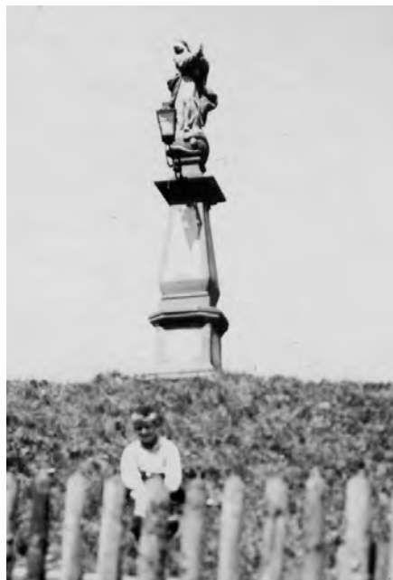
Pobled na pilíř v roce 1933