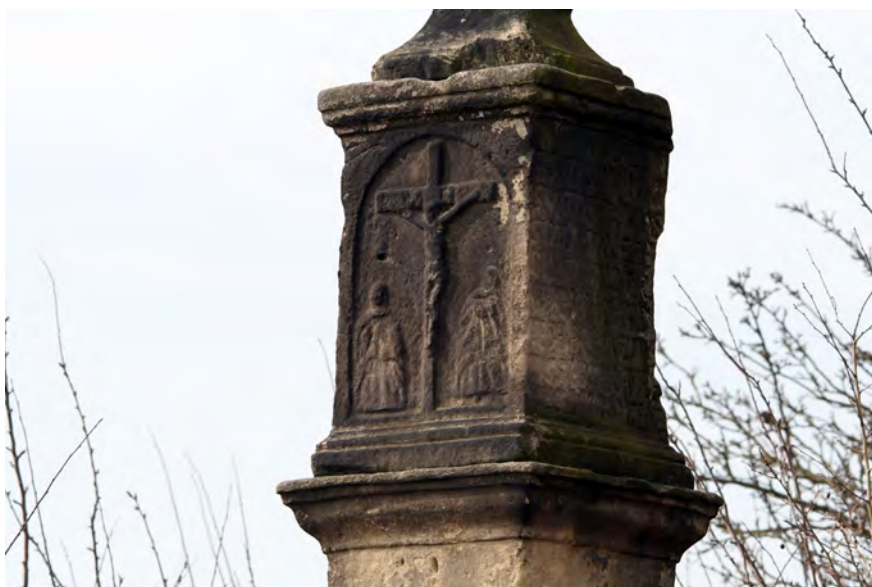
● Podhradí, boží muka, detail kaplice s reliéfem Kalvárie a s nápisem