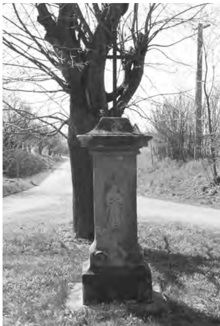
Kamenný sokel s mladším kovovým křížem, 2010