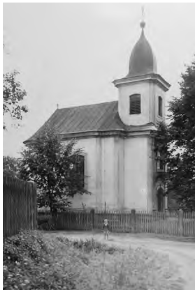
Kaple sv. Jana Nepomuckého v Bukvíči, nedatováno

Je potřebná ještě oprava oltáře, lavic a střechy kaple. Po opravě byly zahájeny slavné služby Boží na Hod Boží svatodušní 28. května 1944.