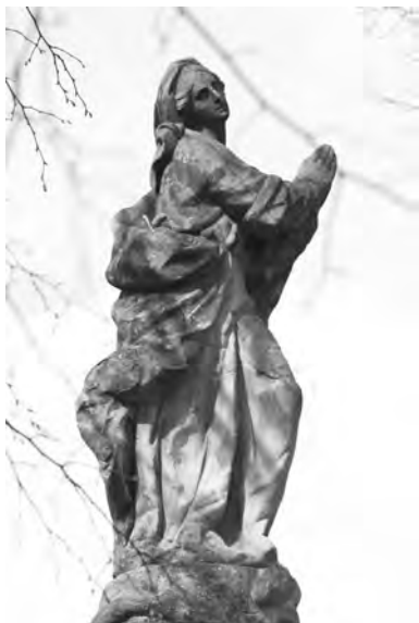
Vrcholová socha Panny Marie z pilíře ve Střevači

Některé podstatné informace autoři načerpali také ve velišské farní kronice. Využili seznam drobných památek nazvaný Veřejné sochy, kříže, kapličky, sepsaný na fóliích 133 a 135, který datovali do roku 1880. Tento soupis posloužil pro základní orientaci také studentům semináře na Fakultě restaurování v Litomyšli. Jeho údaje se týkají umístění objektů, zasvěcení, které mnohdy dnes už není známé, a jsou zde zmíněny i opravy a případné barevné pojednání povrchu soch. Seznam byl v průběhu času na okraji stránky doplňován poznámkami, takže jej v některých případech můžeme využít i pro sledování další existence památek. Například u sochy Krista nesoucího kříž můžeme s pomocí kroniky identifikovat původní umístění v poli jižně od obce Chyjice, kříž u hřbitova ve Veliši byl také posunut o několik desítek metrů a otočen čelem k cestě.