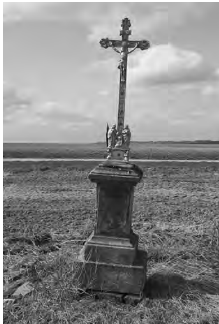
Výrazně nahnutý křížek z konce 19. století, 2010