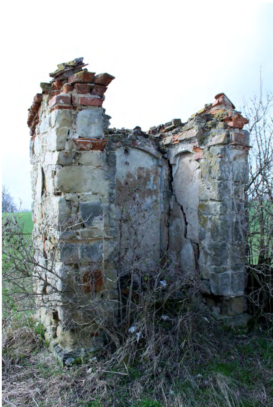
● Kostelec, kaplička u cesty do Chyjic