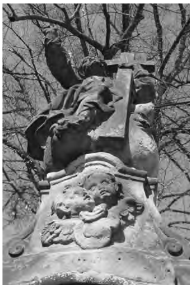
Detail andlíků na soklu sochy Salvátora v Podbrudí

Kronika velišské farnosti zahrnuje poslední dvacetiletí 19. století a první polovinu 20. století. Její význam pro specifický obor restaurování tkví hlavně v záznamech o starších opravách a restaurátorských zásazích na jednotlivých dílech. Dobrým příkladem může být popis stavu votivního obrazu, respektive obrazu založení kostela ve Veliši s portrétem Anselma Luraga: „ Památňý tento obraz, ondy na ždi na káuru zavěšený, nalezl vikář Tichý roku 1906 pobožený a potrhaný mezi různým haraburdím v takzvané komoře pod kárem, dal jej svým nákladem opravit, vyčistiti a pro jistotu, aby byl budoucnosti zachován, zavěsiti ve faře na boření chodbě “. O téměř čtyři desetiletí později byla olejomalba vrácena do kostela; při obnově interiéru v roce 1944 byla zavěšena na současné místo v presbytáři. Další záznamy o restaurování pláten se týkají obrazů sv. Augustina a sv. Jeronýma, které byly opraveny a v roce 1908 pověšeny zpět na své místo nad západní a východní dveře.