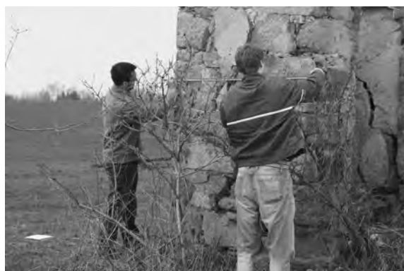
Měříčská dokumentace devastované kapličky u Kostece

Nad vchodem do kostela je umístěna kartuše se Staroboleslavským paládiem, nejuctívanějším mariánským obrazem, dle legendy darovaným kapitule ve Staré Boleslavi samotným sv. Václavem.