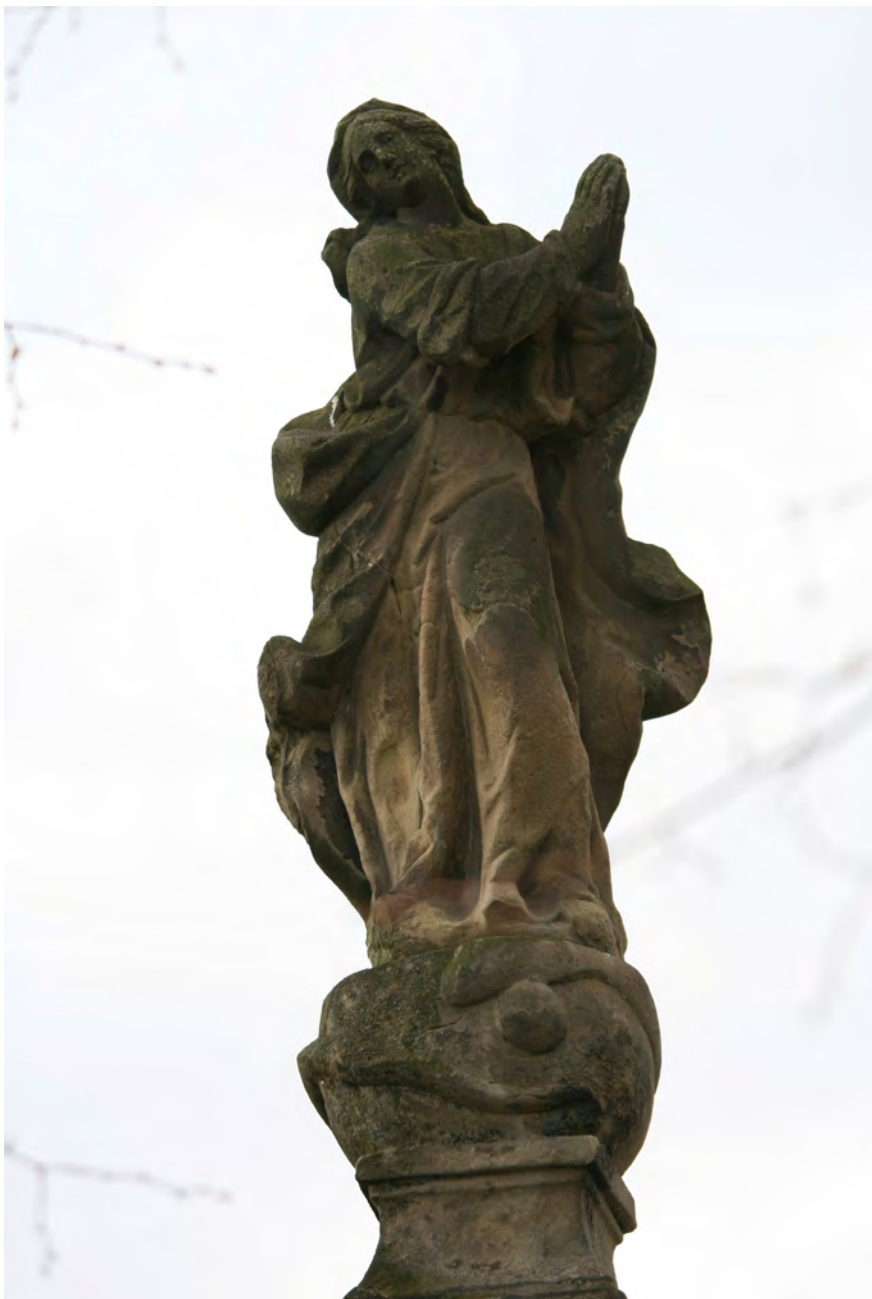
● Střevač, pílň se sochou Panny Marie, vrcholová socha