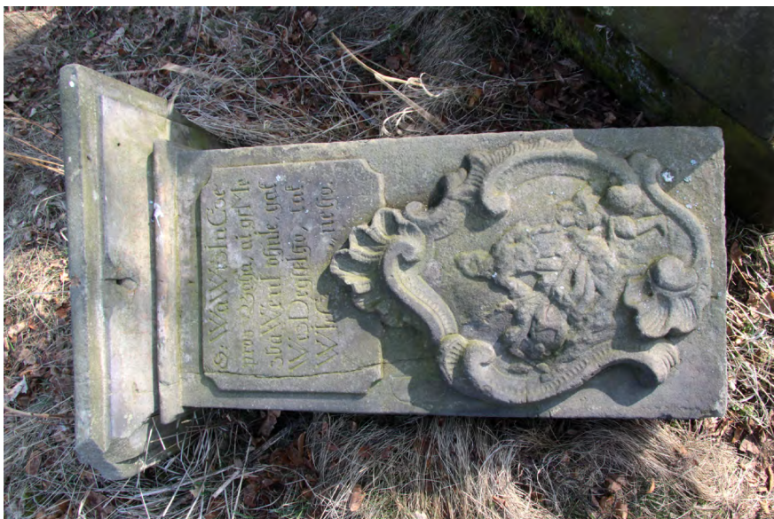
● Podhradí, sousoší sv. Jana Nepomuckého, Vavřince a Donáta, sokel ležící na zemi