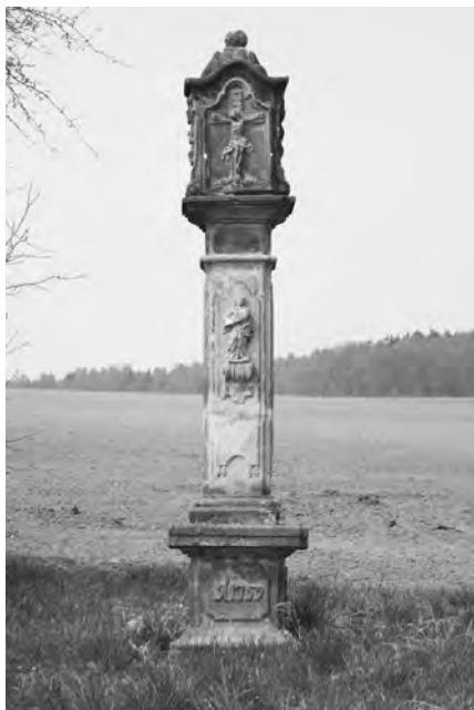
Boží muka datovaná na soklu 1759, foto 2010

Boží muka o celkové výšce asi 380 cm, postavená na podložním kameni o půdorysu 124 x 84 cm, se nachází za obcí západním směrem při odbočce na Batín. Nízký hranolový sokl, jehož čelní strana nese zrcadlo s prolamovanými rohy s uvnitř vytesaným nápisem A(nno) 1759 , je ukončen výrazně širší římsou jednoduchého profilu. Mírně předsazená zrcadla stejného tvaru jsou i na bočních stranách soklu. Na římsě stojí vysoký pilíř, na přední straně s reliéfem Panny Marie stojící na předsazeném volutovém soklíku. Postava s rukama lomícima u pravého boku je oděna v dlouhý bohatě řasený šat.