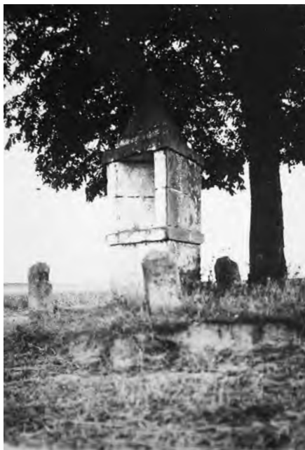
Kaplička na snímku z roku 1935