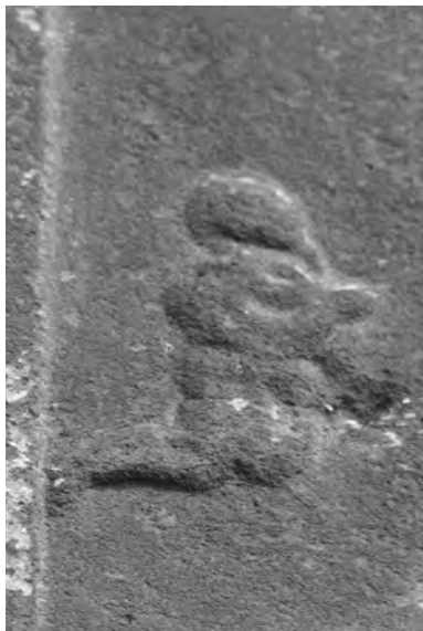
Detail reliéfu donátora na kapliči božích muk u Podhradí

Z nejmladších záznamů vybíráme jako charakteristickou ukázkou kronikářského zápisu o opravě interiéru kostela v roce 1944. Její autor dokonce (téměř odborně) reflektoval vrstvy výmalby stěn a přidal úsměvnou doušku reportážního charakteru: „Celý chrám byl vymalován ve dvou tónech slabě žlutých. Fresky zůstaly nedotčeny, jejich návrat k původnímu stavu počká do budoucnosti. Dle odkrytí vrstev na stěnách byla nyní malba, kterou jsme prováděli, čtvrtá od postavení kostela. Původní malba byla rovněž jednoduché tónování. Někteří věřící se neradi loučili s pestrá pokojovou malbou chrámu, na kterou byli zvyklí. Proto reptali. Nyní však jsou spokojeni“.