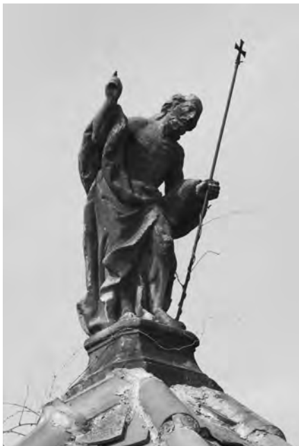
Žehnající Kristus ve vrcholu západní kaple, 2010