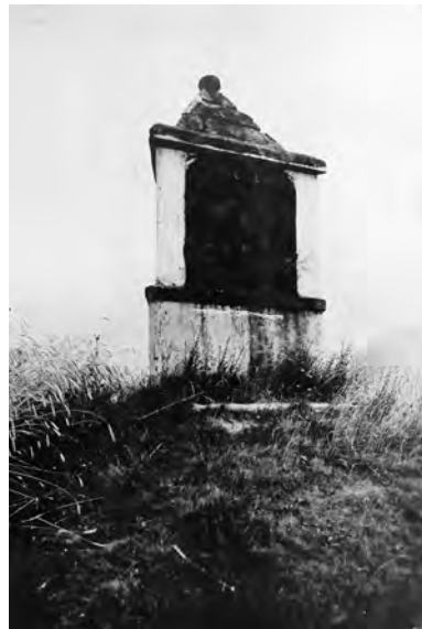
Veliš, trojboká kaple