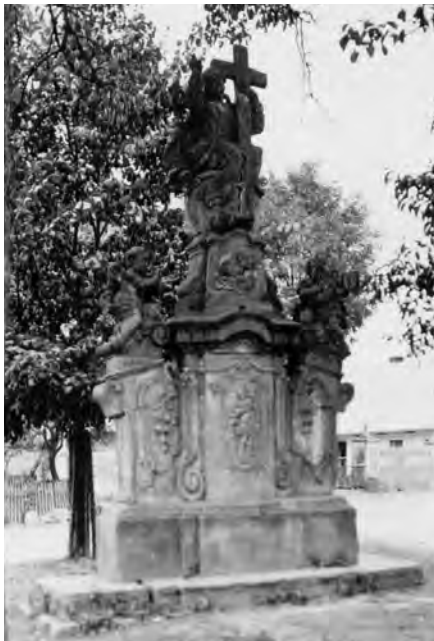
Fotografie z roku 1930