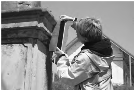
Oměřování profilace římsy Kalvárie v Bukvíci tzv. „břebelem“