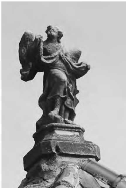
Anděl ve vrcholu východní kaple, foto 2010