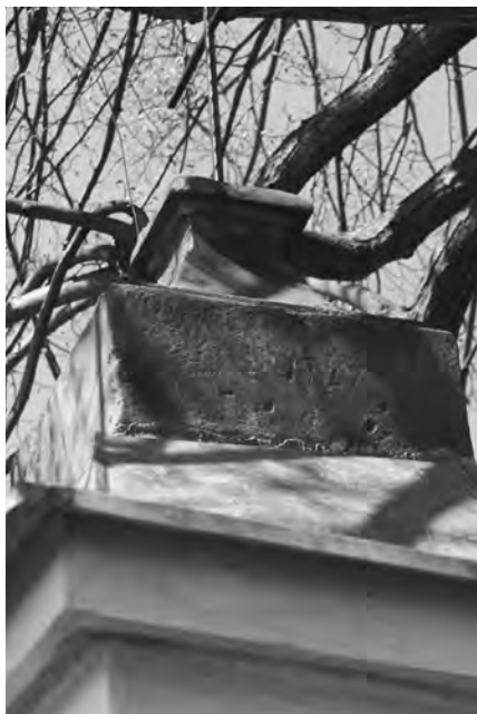
Detail vrcholové části nástavce s datací 1727

Omítnutá zděná výklenková kaplička ze smíšeného zdiva (cihly a kámen) stojí u polní cesty za obcí Bukvice. Podstava má rozměry 200 x 125 cm, výška kapličky je 320 cm. Za kapličkou stojí v těsné blízkosti lípa a keře.