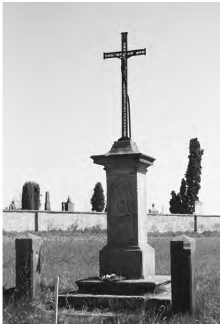
Současný stav kříže z roku 1834, foto 2010