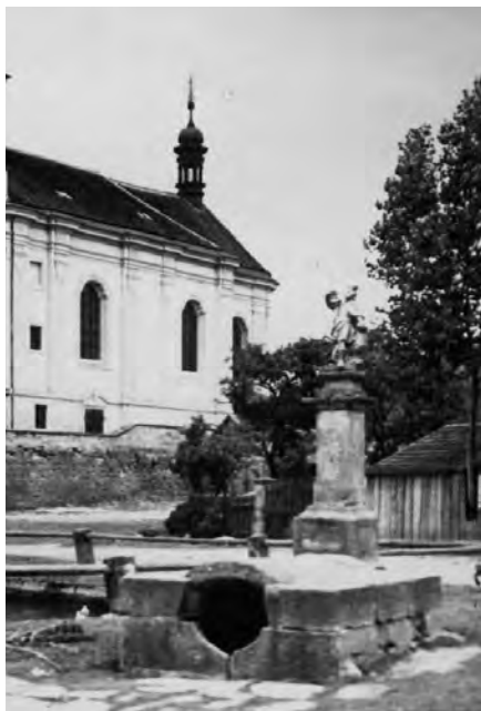
Prostranství se sochou sv. Václava v roce 1930