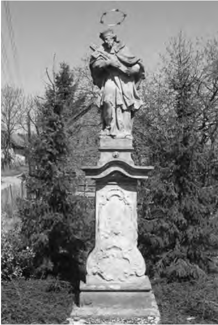
Současný stav sochy restaurované v roce 1994