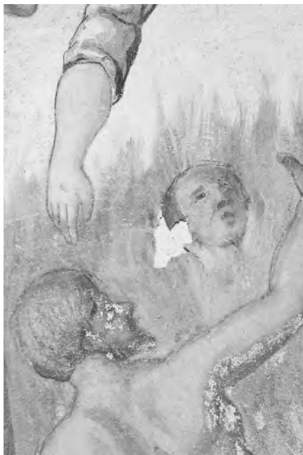
Detail odlupující se barevné vrstvy

Nástěnná malba se nachází nad oltářní sarkofágovou menzou v přízemní čtvercové kapli se skosenými nárožními částmi fasády. Stěny jsou složeny ze smíšeného, pískovcovo-cihlového, zdiva a omítnuty. Interiér je zaklenut klášterní klenbou. Kaple nese stanovou střechu s pálenými taškami. Na vrcholu střechy stojí kamenná socha Salvátora.