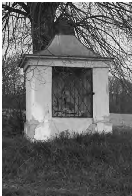
Současný stav kapličky s mříží a chybějící Pietou