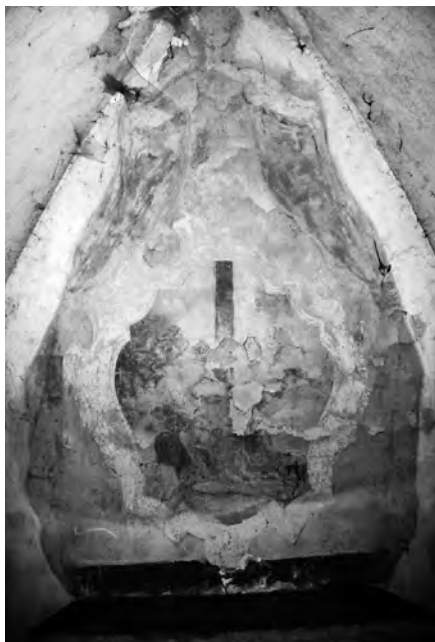
Současný stav poničené malby, foto 2010