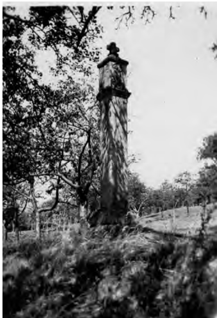
Fotografie z roku 1930