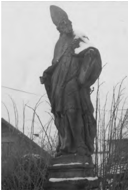
Fotografie ze 70. let 20. století