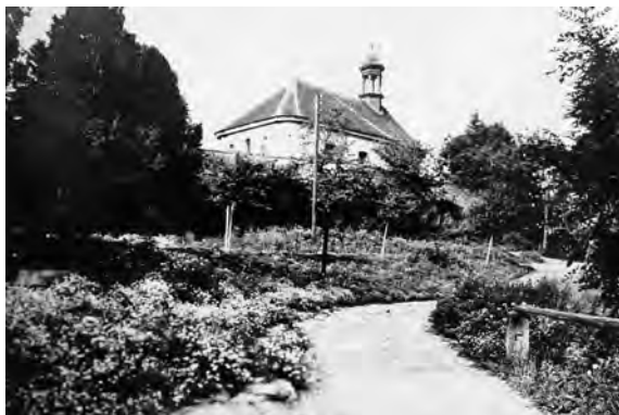
Kostel Nanebevzetí Panny Marie v Kostelci, 1936

Tento na návrší obce Kostecké postavený kostel jest sice co do výstavnosti nepatrný, nic však méně v mnohém ohledu pamětihodný. Býval za starých časů kostelem plebánským, tj. měl svou samostatnou duchovní správu, svou vlastní křtitelnicí a své pohřebiště. Založeno bylo při něm kaplanství, těšil se mnohým příznivcům a dobrodincům a chová v sobě posléze vícero náhrobních kamenů s nápisy pochovaných v něm urozených osob.