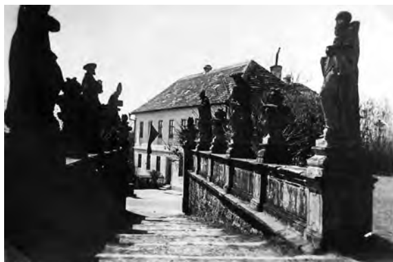
Galerie soch před kostelem, nedatováno