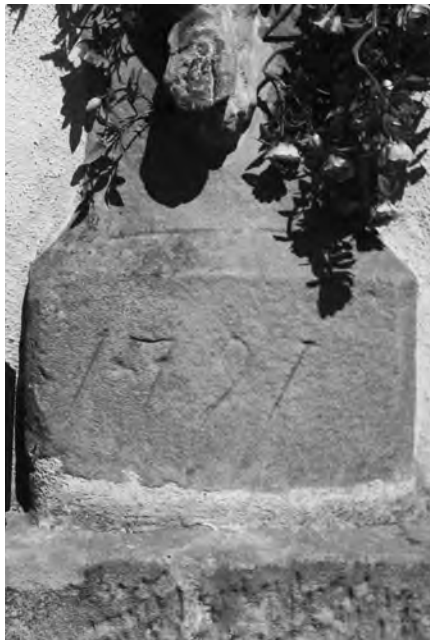
Současné zasazení fragmentu staršího kříže, 2010