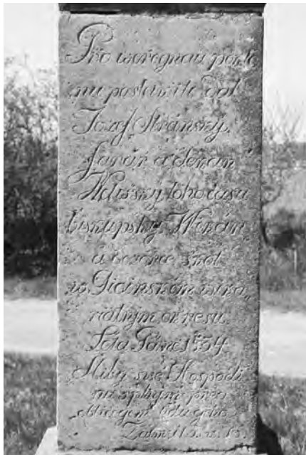
Detail erekečního nápisu na zadní straně soklu

Kříž o celkové výšce 3 m sestává ze tří kamenicky opracovaných dílů a vrcholového litinového kříže. Stojí na třech schodech mezi dvěma pískovcovými patníky. Na podstavci (v nejširším místě 72 cm) je umístěn horizontální blok zakončený římsami. Na něj nasedá vertikální sokl s reliéfem Krista nesoucího kříž a textem. Celý výjev včetně textu je orámován. Sokl zakončují římsy. Na soklu je připevněn litinový kříž s Ukřížovaným. Tato konstrukce je zezadu podepřena železnou profilovanou tyčí. Litinové části jsou černé.