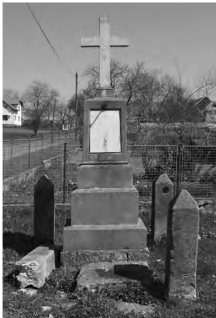
Novodobý kříž s poničenou obrádkou, foto 2010