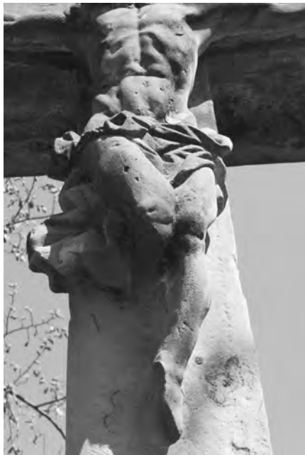
Detail poškození korpusu Krista, foto 2010

Barokní sousoší o výšce 440 cm a podstavě 240 x 60 cm je vytvořeno z jemnozrnného pískovce. Skládá se ze sedmi kamenicky opracovaných dlůl na jedné základové pískovcové podestě, složené ze tří kusů spojených železnými kramlemi. Na podestě stojí tři sokly (střední je masivnější). Na bočních soklicích původně stávaly sochy sv. Jana Evangelisty (nalevo) a Panny Marie (napravo). Sokly jsou k sobě spojeny shora železnými kramlemi.