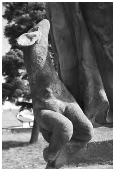
Detail laně u nobou sochy sv. Ivana na rampě u kostela ve Veliši