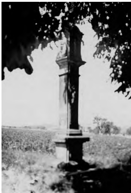
Historická fotografie božích muk z roku 1933