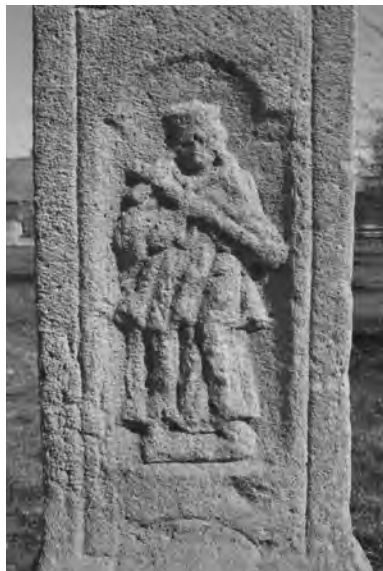
Detail reliéfu sv. Jana Nepomuckého na pilíři sochy sv. Václava ve Veliši