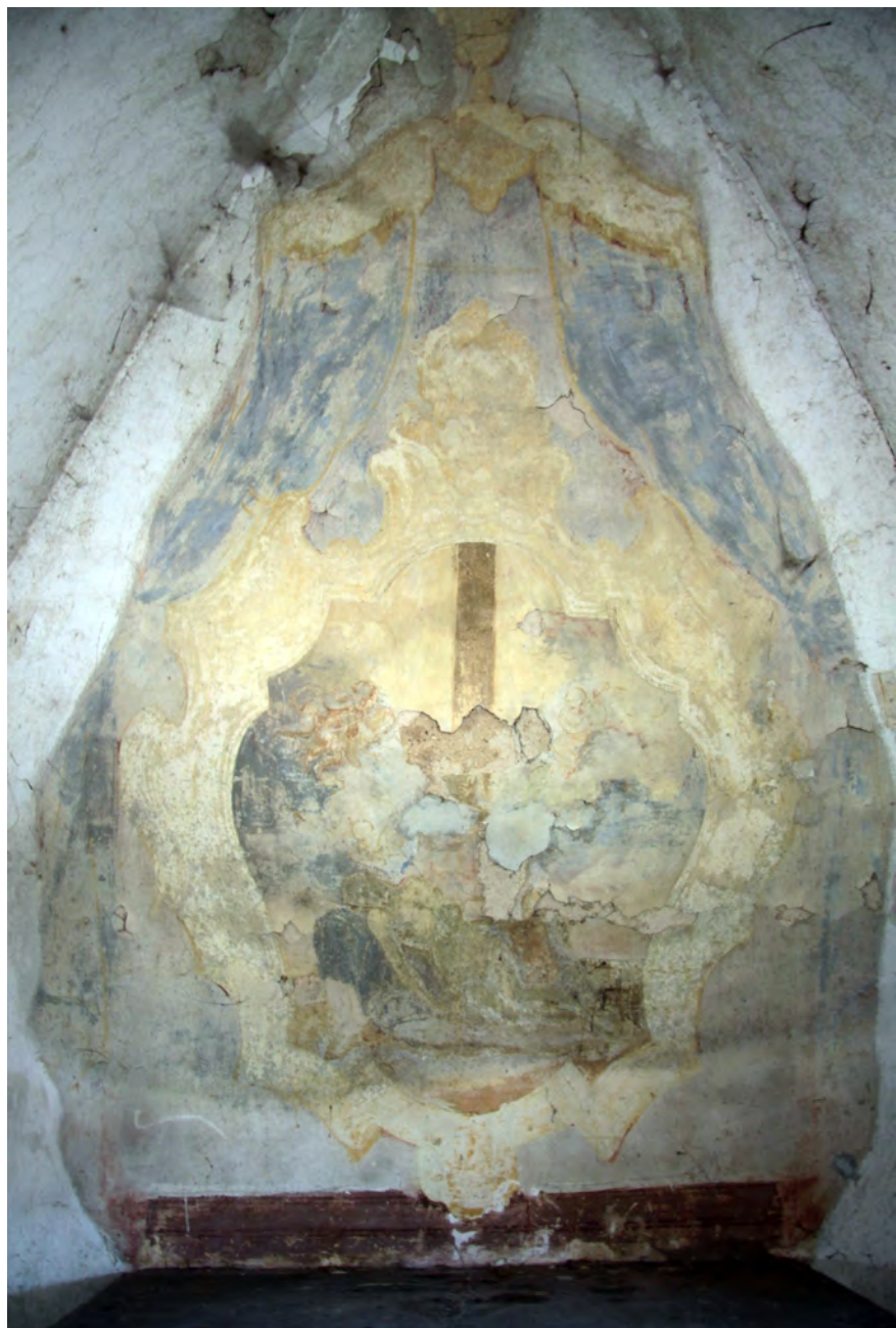
● Veliš, východní brýtovní kaple, celek malovaného oltáře