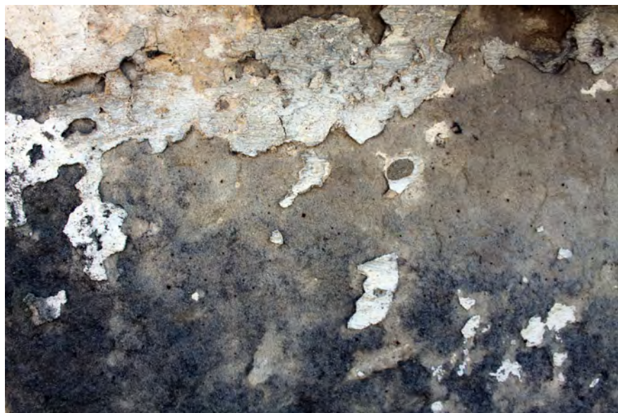
● Chyjice, trojboká kaplička, zbytky starších povrchových úprav