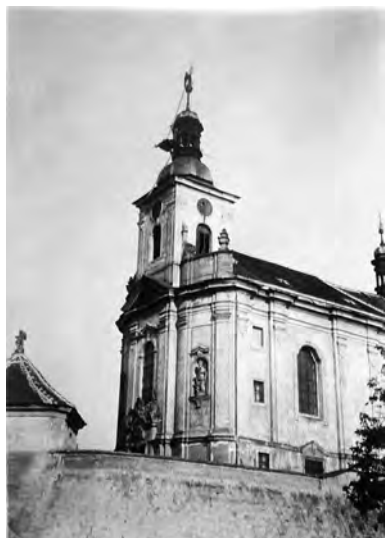
Kostel při opravě (nátěr, plechování) v roce 1945