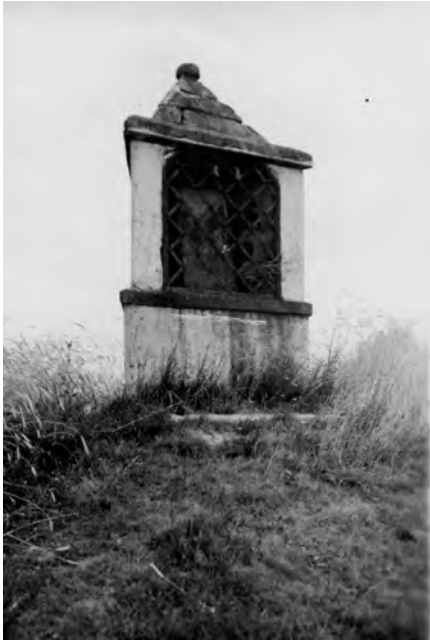
Snímek kapličky z roku 1930