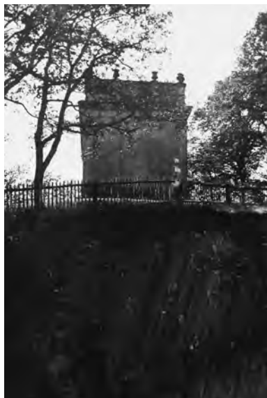
Kaple Loreta – pobled z lomu, 1930

● Ouhrem 17 křížů, 13 soch, troje sousoší a tři kapličky.