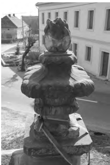
Ze souboru osmi váz na rampě u kostela ve Velišiš se zachovaly pouze dvě nad vstupem