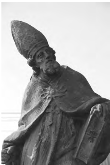
Detail postavy sv. Cyrila na rampě u kostela ve Veliši