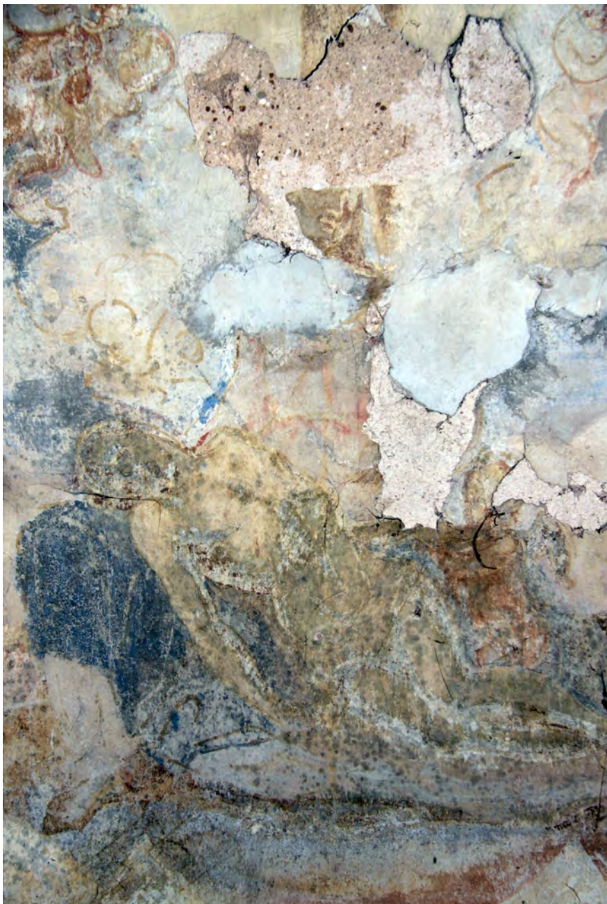
● Veliš, východní hřbitovní kaple, detail Piety