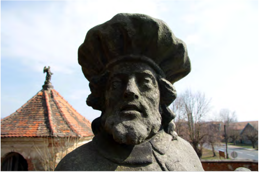
● Veliš, socha sv. Damiána na rampě před kostelem, detail hlavy