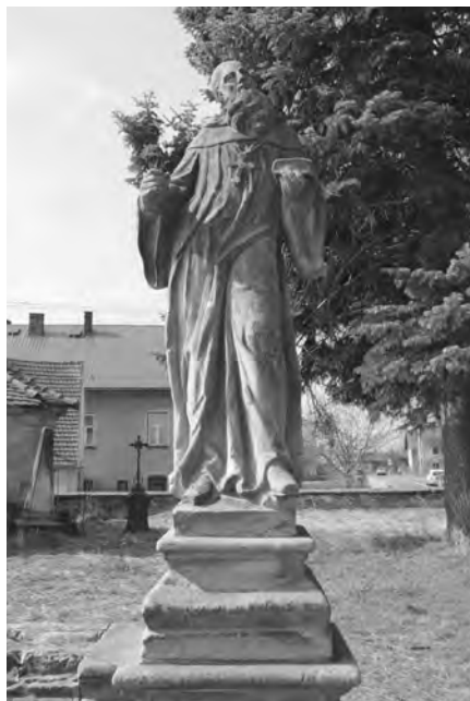
Současný stav sochy, foto 2010

Socha světce, jehož ikonografické určení není zatím úplně vyjasněno, snad se jedná o sv. Benedikta, je provedena ve světlém jemnozrnném pískovci pocházejícím s největší pravděpodobností z nedalekých panských lomů velišsko–vokšického panství.