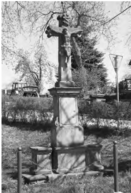
Kalvárii chybí sochy sv. Jana a Panny Marie, 2010