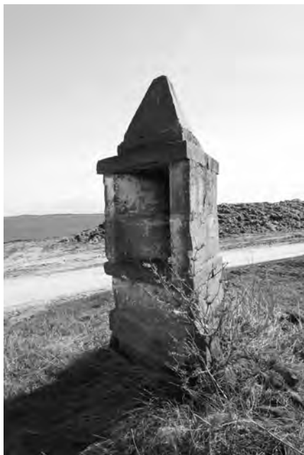
Současný stav kapličky, foto 2010

Trojboká kaplička stojí jižně od Chyjic, u polní cesty mezi Libání a Dolany. Vznikla asi v první polovině 18. století. Podle tvaru drobné architektury by bylo možné uvažovat o původním zasvěcení objektu Nejsvětější Trojici. Tuto hypotézu potvrzuje mapa stabilního katastru z roku 1842, kde je sousední polní trať označena názvem „U trojice“. Podle informací z roku 1935 byla kaplice „zcela vyprázdněna a poslední v ní byl obraz P. Marie s Jezulátkem“.