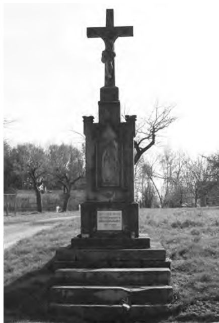
Kamenný kříž s novogotickým tvaroslovím, 2010