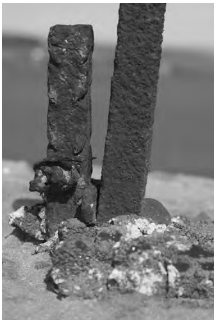
Detail uchycení litinového kříže u staršího čepu

Křížek se nachází jižně od Chyjic, u polní cesty mezi Libání a Dolany, neda- leko vysoké lípy. Objekt stojí na kamenném základu obdélníkového tvaru. Na něm je umístěn jednoduchý sokl a podstavec s nízkým figurálním reliéfem z přední a ze zadní strany. Podstavec je zakončen hlavicí s jednoduchým profi- lem, do které je vsazen litinový kříž. Celý objekt měří 336 cm na výšku, z toho kříž 125 cm. V nejširším bodě z přední strany měří 71 cm a z boku 50 cm. Litinový vrcholový kříž je silně zkorodovaný. Kámen je středně degradován, objevují se zde praskliny různého charakteru, z toho ze zadní strany hlavice je ke středu silná prasklina. Lokálně je kámen porostlý mechy, lišejníky, občas se objevují krusty. Na některých místech jsou patrné úbytky hmoty modela- ce. Základ celého objektu je silně poničen, část z něj chybí, takže kříži hro- zí zřícení.