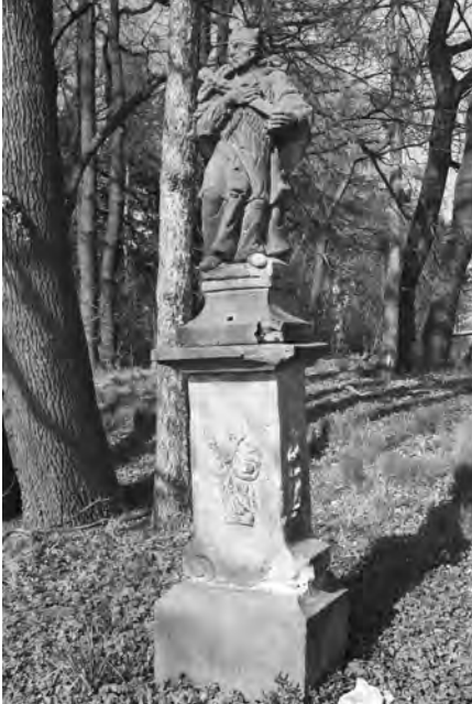
Socha sestavená z různých částí, foto 2010