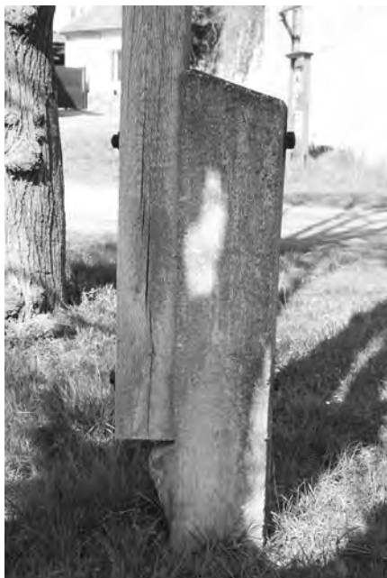
Dřevěný misionářský kříž, současný stav, foto 2010