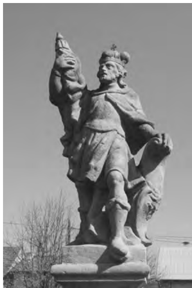
Socha sv. Václava z pilíře ve Veliši