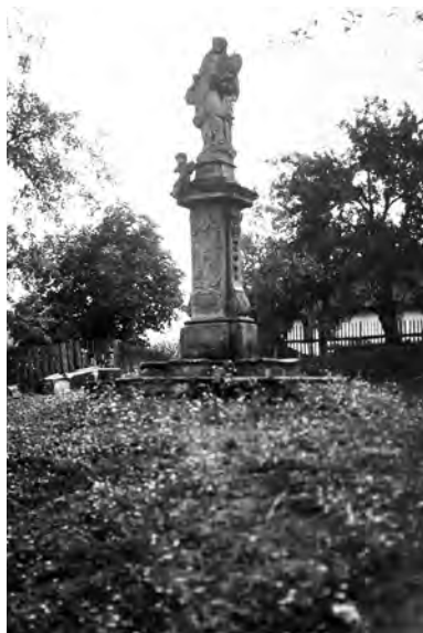
Chyjice, socha sv. Karla Boromejského