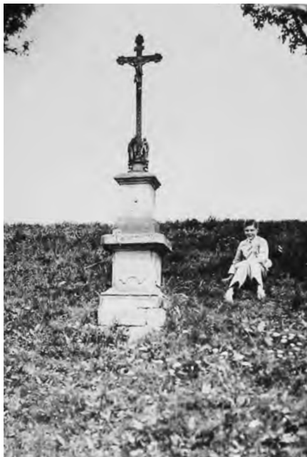
Litínový kříž na podnoží starých božích muk, 2010 Foto křížku z roku 1936

Křížek se nachází na východním okraji obce Kostelec ve svahu nad silnicí do Jičíněvsi. Jeho podstavec patřil staršímu objektu – pravděpodobně pískovcovým božím mukám, v podobě jak ji známe (i s charakteristickou úpravou soklu s vystupujícím zrcadlem s vyřiznutými rohy a specifickými číslicemi datace) z nedaleké Střevače. Po zničení původního pilíře s kaplicí (případně kamenného kříže) byl osířelý sokl na přelomu 19. a 20. století doplněn drobnějším podstavcem a litínovým křížem.