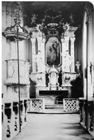
Interiér kaple sv. Matouše v Dolanech, 1935