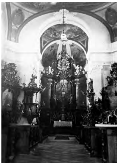
Interiér kostela sv. Václava, nedatováno