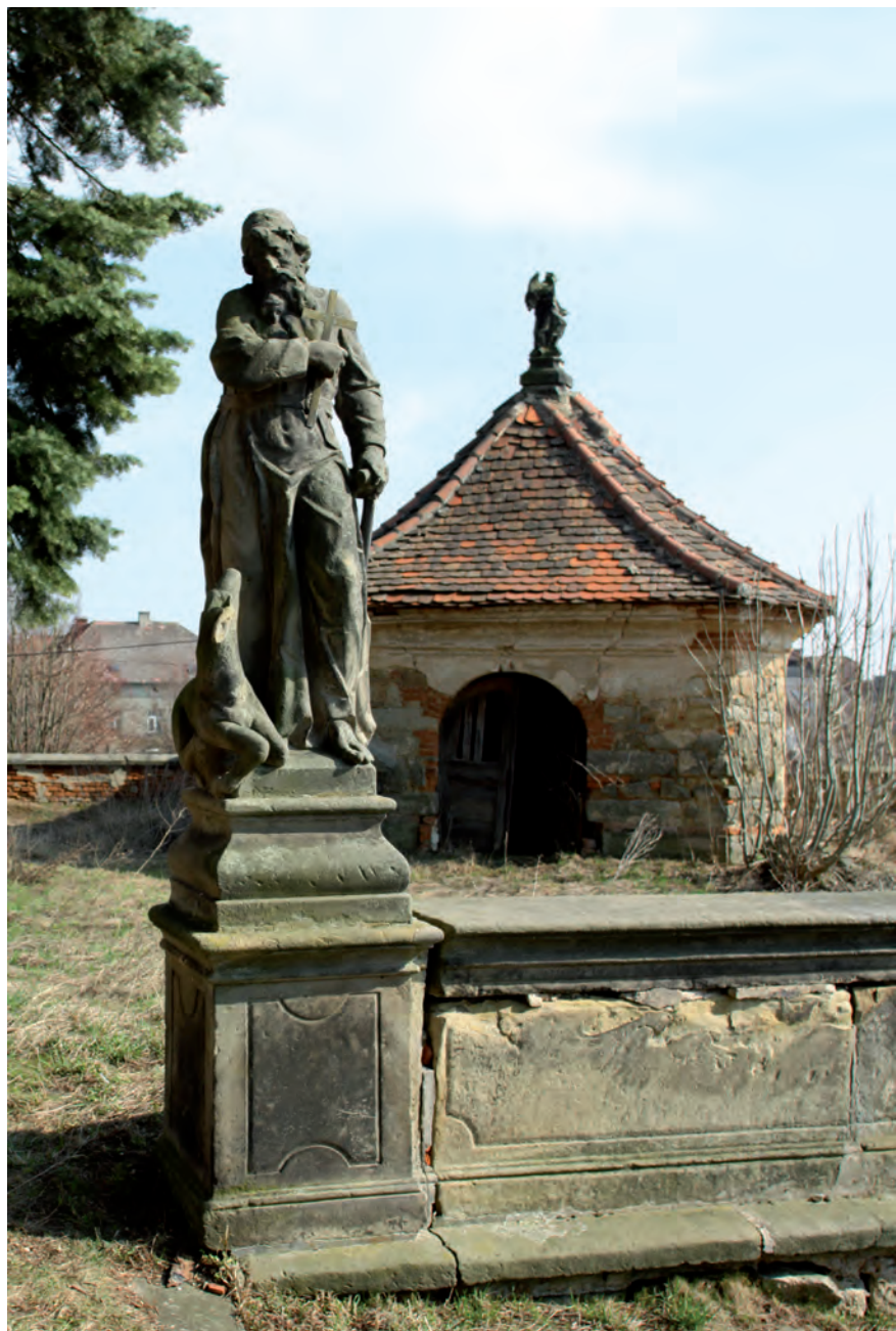
● Veliš, socha sv. Ivana na rampě před kostelem, vlevo poškození pískovcového zábradlí