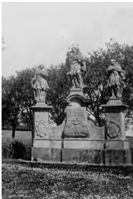
Sousoší s chybějícími bočními postavami světců, 2010 Sousoší na okraji poblednice z počátku 20. století

Autorem sousoší o rozměrech 60 x 270 x 51 cm, posazeného pod jihovýchodním svahem kopce Veliše, je nejspíše sochař Martin Krupka. Tři samostatné sochy světců stály na mírně prohnuté základně s prostředním vyvýšeným soklem s profilovanou, vpředu vytaženou segmentovou římsou. Ústřední postavou je sv. Jan Nepomucký, po pravé straně jej doplňoval sv. Donát na hranolovém soklu a vlevo na stejném podstavci sv. Vavřinec.