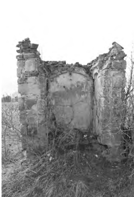
Zdevastovaná kaplička, foto 2010