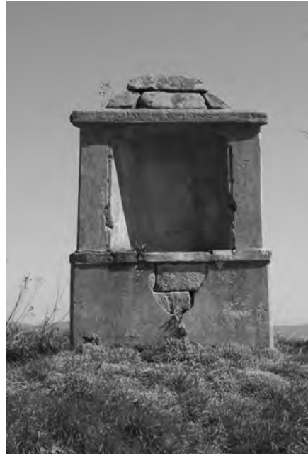
Poničená kaplička v roce 2010

Velišská farní kronika v soupisu z konce 19. století označuje drobnou architekturu výklenkové kaple v sedle polní cesty ze Šlikovy vsi do Veliše jako kapličku Nejsvětější Trojice a udává, že je obnovená. Dataci této obnovy najdeme ve špaletě niky vpravo, kde je uveden rok 1898. Naproti vlevo je v novodobé omítce opakován rok 1726, kdy kaplička pravděpodobně vznikla.