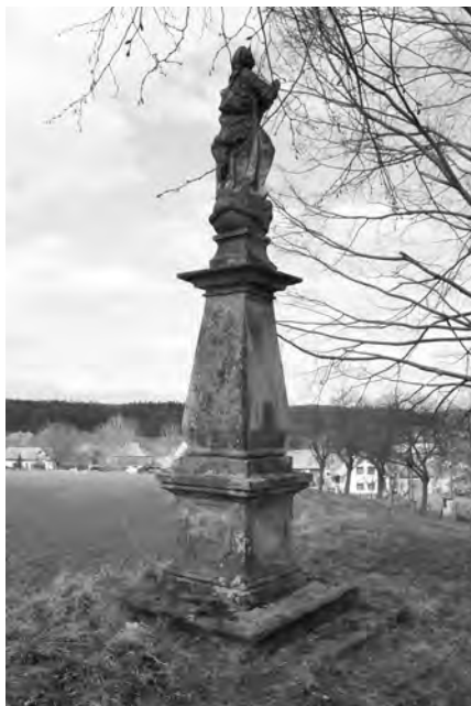
Současný stav pilíře se sochou Panny Marie, 2010

Pilíř se sochou Panny Marie stojí na okraji obce Střevač, na vyvýšenině nad křižovatkou cest do Bystřice a Chyjic. Pozdně barokní skulptura je datována sekaným nápisem na soklu do roku 1754. Celý objekt je vytesán ze světlého pískovce a je čelem obrácen ke křižovatce.