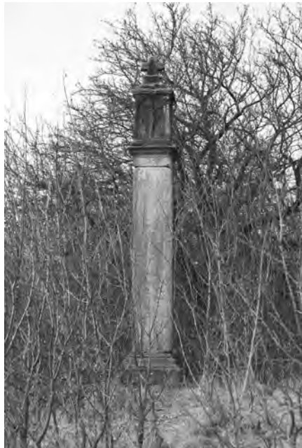
Současný stav božích muk, foto 2010

Boží muka, umístěná nad hřbitovem vlevo od cesty z Veliše do Podhradí, mají podobu hranolového pilíře s kaplicí a skládají se ze šesti až sedmi samostatných bloků. Hrubozrnný kámen pochází s největší pravděpodobností z regionálních zdrojů.