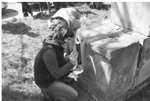
Průzkum podstavce sousoší Kalvárie v Bukvíci

Do budoucnosti můžeme absolventům pardubických a litomyšlských seminářů popřát, aby měli možnost vidět, jak se výsledky jejich práce uplatňují v praxi. Památkám, ať už se jedná o velkolepé barokní kostely nebo drobné kaple a křížky, pak přidejme přání dostatku nadšených badatelů a zároveň osvědčených majitelů, kteří jim budou věnovat soustavnou péči a zachovají je pro další generace obdivovatelů.