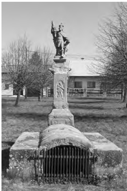
Současný stav sochy nad pramenem, foto 2010

Socha sv. Václava byla nad pramenem umístěna roku 1783, jak dokládá datace vytesaná v kameni. Stojí nad studánkou, kterou dohromady tvoří deset pískovcových, kamenicky opracovaných dílců na betonové podezdívce. Skládá se ze dvou kvádrovitých podpor (každá ze tří kvádrů) překlenutých pískovcovými oblouky (čtyři kusy spojené kovovými kramlemi a spárovací hmotou). Otvor nádrže je v současnosti oproti původnímu menší a je zamřížován kovovou mříží. Celý objekt je proti původnímu rozsahu nižší.