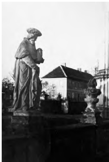
Socha sv. Kosmy před kostelem, v pozadí fara, nedatováno