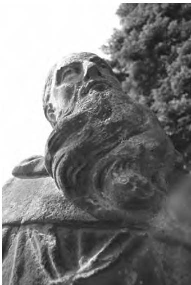
Detail vousu sochy sv. Benedikta (?) na rampě u kostela ve Veliši

Zasazení sledovaných soch do ikonografické koncepce celku lze shrnout následovně: schodiště vedoucí k hlavnímu vchodu kostela sv. Václava bylo lemováno časově nejstaršími českými svěťci – za branou shlížejí věrozvěsti sv. Cyril a Metoděj, za nimi následují svatí lékaři Kosma a Damián, jimž byl zasvěcen kostelík ve Staré Boleslavi a kteří jsou uctíváni jako spolupatroni české země. Další dvojice představuje vpravo sv. Ivana poustevníka a vlevo pravděpodobně sv. Benedikta, který byl jedním z pěti svatých bratří z benediktinského řádu, uctíváných mezi českými zemskými patrony. Na hlavním průčelí jsou v nikách sv. Prokop, první opat, a sv. Vojtěch.