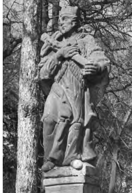
Detail sochy sv. Jana Nepomuckého, foto 2010