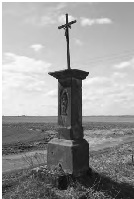
Celek kříže se soklem z roku 1801, foto 2010