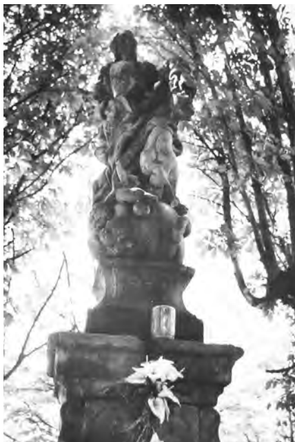
Pilíř se sochou Panny Marie hrozí spadnutím, 2010 Fotografie vrcholové sochy Panny Marie z roku 1981

Socha Immaculaty se nachází na návsi u křižovatky, naproti bývalé výsadní hospodě. Jedná se o vrcholně barokní skulpturu ze druhé čtvrtiny 18. století, která je sekaná z jemnozrnného pískovce. Podstavec je vytvořen z hrubozrnného pískovce. Socha s podstavcem stojí na dvou odstupňovaných betonových schodech. Sokl má obdélníkový půdorys o rozměrech 77 x 63 cm a je zakončený jednoduchou profilovanou římsou. Samotný podstavec o výšce 112 cm začíná dvěma volutami po stranách, je zdobený zrcadly s nízkým figurálním reliéfem zobrazujícím světce (sv. František, sv. Jan Nepomucký) na bočních stranách. Podstavec je zakončen bohatě profilovanou římsou, na níž stojí soklík se zeměkoulí a Pannou Marií, v tradičním ikonografickém ztvárnění Immaculaty.