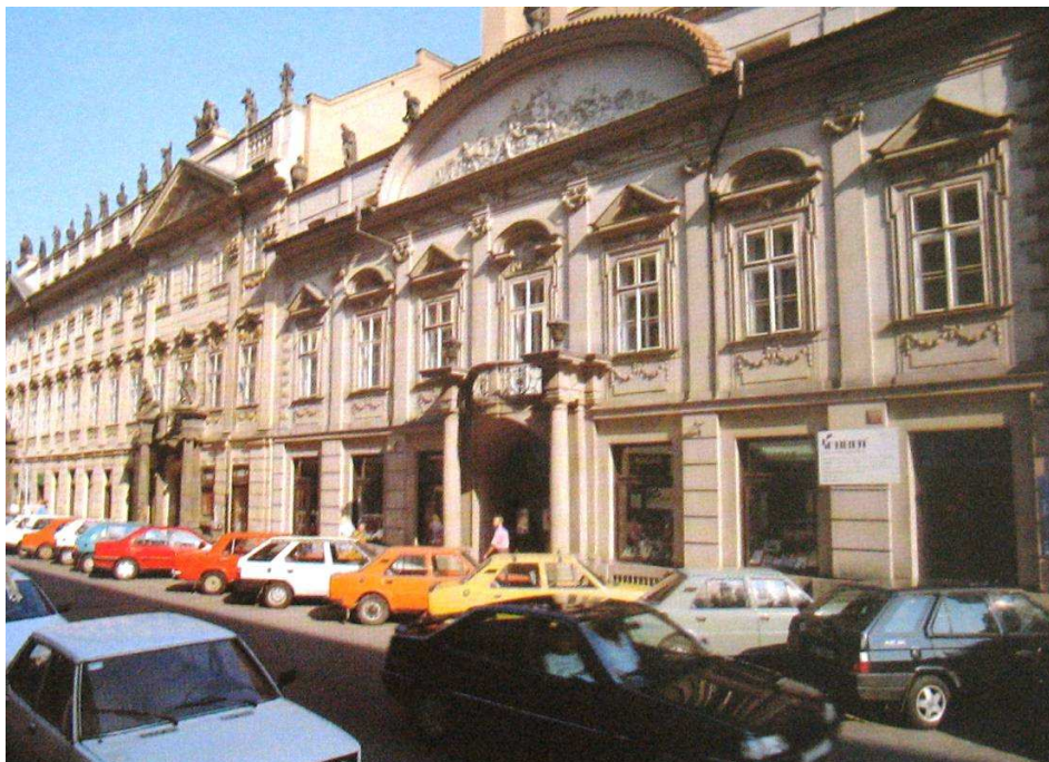
OBRÁZEK č. 5: Sweerts-Šporkovský palác, zdroj: LEDVINKA, Václav – MRÁZ, Bohumír – VLNAS, Vít. Pražské paláce: Encyklopedický ilustrovaný přehled . Praha, 1995, s. 293

Majitel se nespokojil s rozlohou paláce a pokusil se ho po obou stranách ještě jednou rozšířit. Sousední východní dům přikoupil za 17 000 zlatých v roce 1790. Během následujících dvou let proběhla již druhá přestavba sídla, a to pod vedením architekta Jana Palliardiho. 276 Bývalý klášter hybernů, jenž stál na západní straně komplexu, hrabě koupil o další tři roky později. K poslední zamýšlené přestavbě již ovšem nedošlo a celý projekt zůstal torzem. Plány překazily finanční potíže, do kterých se Sweerts-Šporkové dostali. Filip Benitus byl nakonec donucen prodat celý komplex budov v roce 1803. 277