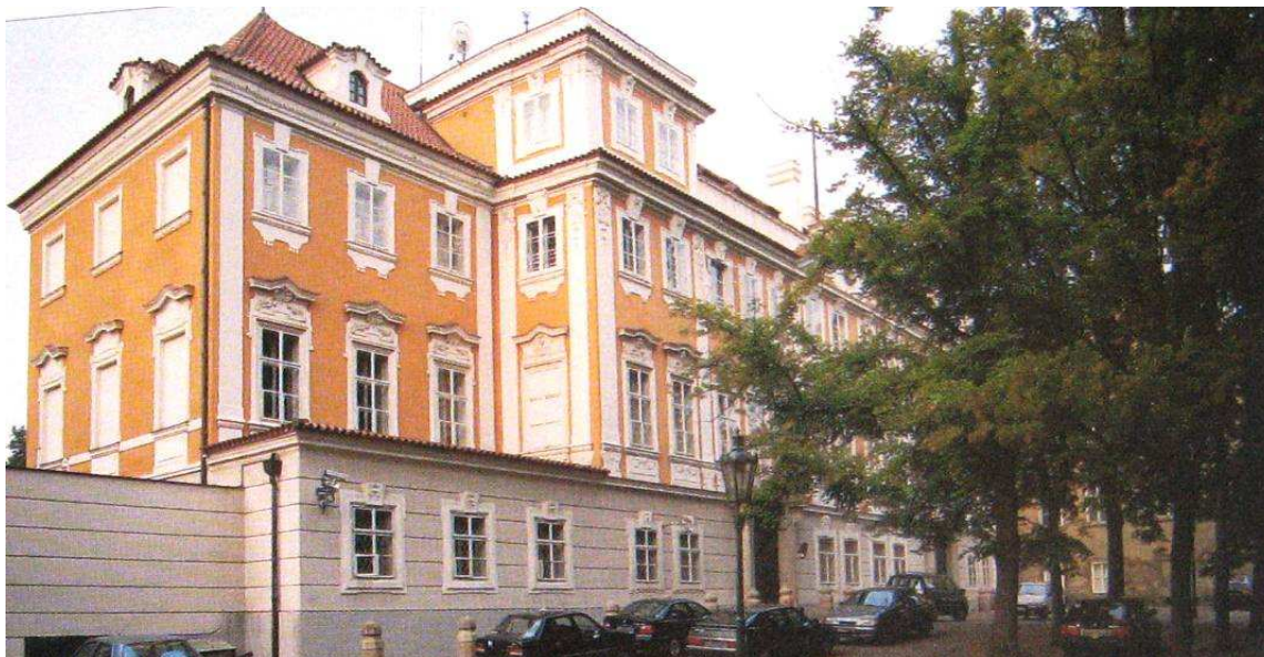
OBRÁZEK 1: Buquovský palác

1748. Ta mu stavbu prodala za poměrně vysokou částku 32 000 zlatých, což bylo odrazem nákladné přestavby a scelení domu. Sídlo se stalo nejvýstavnějším palácem na Malé Straně. 206