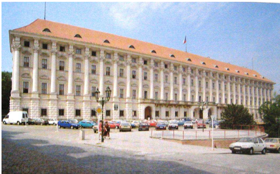
OBRÁZEK 2: Černínský palác, zdroj: LEDVINKA, Václav – MRÁZ, Bohumír – VLNAS, Vít. Pražské paláce: Encyklopedický ilustrovaný přehled . Praha, 1995, s. 91

Sedm let po dostavbě paláce byla hradčanská rezidence začleněna do rodinného fideikomisu. 228 Po náhlé smrti hraběte Černína jeho ovdovělá manželka ještě dokázala uchránit pro Prokopa Vojtěcha hradčanský palác i s celou obrazovou galerií a zařízením v parádních pokojích. 229 Ovšem poté byl palác zrušen nejprve ve čtyřicátých letech 18. století bavorským a francouzským vojskem a následně znovu při pruském ostřelování Prahy v roce 1757. Musel tak podstoupit vždy nutné opravy. Rezidence začala postupně pustnout a od 1777 bylo sídlo dokonce již neobýváno. Stalo se pro rodinu finanční zátěží. 230