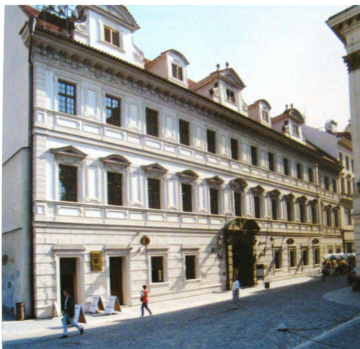
OBRÁZEK 4: Kolovratský palác, zdroj LEDVINKA, Václav – MRÁZ, Bohumír – VLNAS, Vít. Pražské paláce: Encyklopedický ilustrovaný přehled . Praha, 1995, s. 161

Hlavní rezidencí Novohradských z Kolovrat se stal od druhé poloviny 17. století Kolovratský palác. Tento palác se nachází na jihozápadní straně Ovocného trhu. Jedná se o raně barokní, dvouposchodový palác s vnitřním dvorem. Stavba vznikla na místě původně dvou domů, domu U Hroznu a domu U Bílého medvěda, který nesl později název U Vrabců. 262