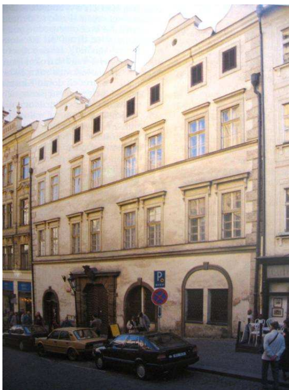
OBRÁZEK 3: Palác Kinských

Od druhé poloviny 17. století vlastnila chlumecká Linie rodu Kinských palác, který se nacházel na Malé Straně proti průčelí kostela Panny Marie u theatinů, v tehdejší Ostruhové ulici. Rozlehlý palácový soubor gotického původu býval označován jako dům „U Zlaté koruny“. Celý palác vyrůstal v několika stavebních etapách a vznikl stavebním propojením dvou domů. Z nich první se nazýval Marštalkovský a druhý Hansturkovský dům. 240