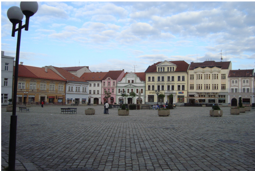
2. Masarykovo náměstí ve městě Pelhřimov