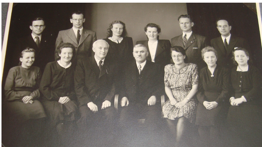
8. Učitelský sbor roku 1942.