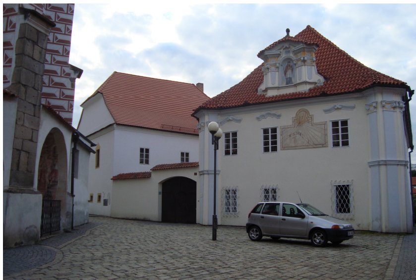
3. Městská fara, kde dříve byla v 15. století škola