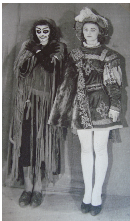
17. Divadelní představení „Červený květ“ roku 1942