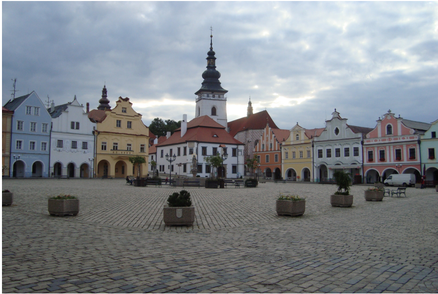
1. Masarykovo náměstí ve městě Pelhřimov