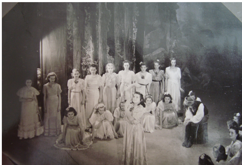
16. Divadelní představení „Červený květ“ roku 1942