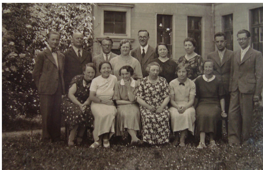
7. Učitelský sbor dívčí školy v roce 1936.