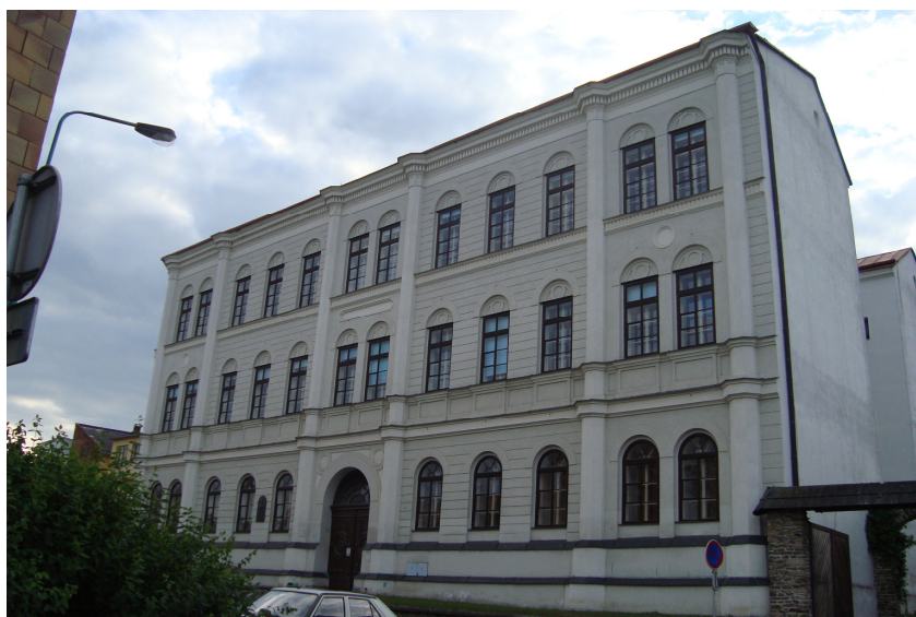
4. Dnešní průmyslová škola, kam byla roku 1878 přestěhována dívčí škola.