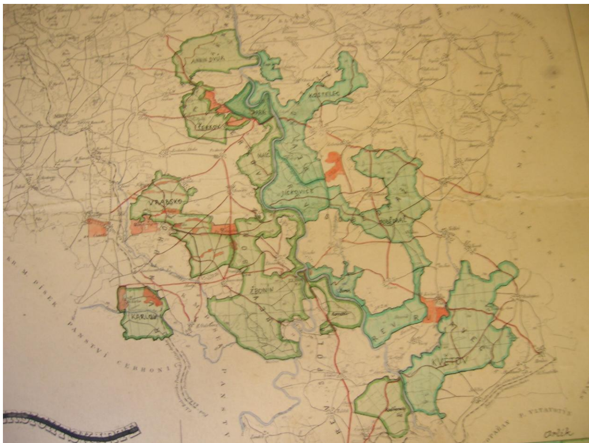
Mapa orlického panství z roku 1947