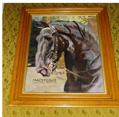
Obrázek č. 15