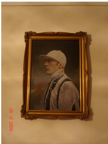
Obrázek č. 17