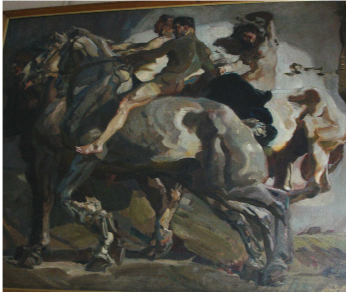
Obrázek č. 16