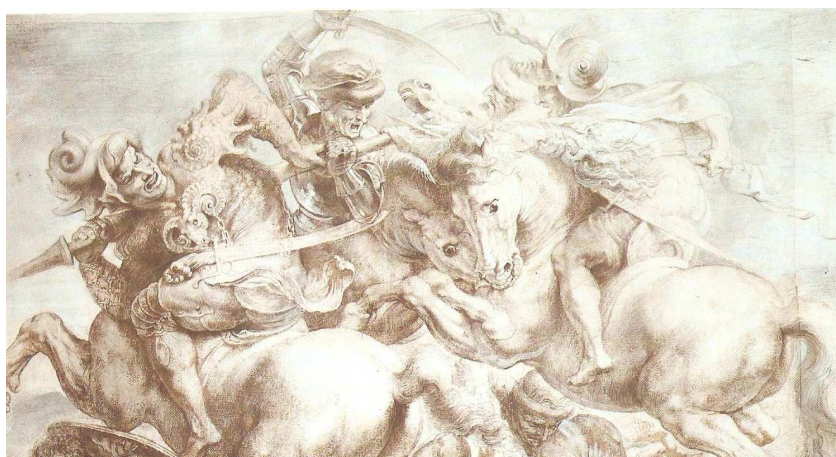
Obrázek č. 10