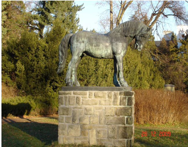
Obrázek č. 18