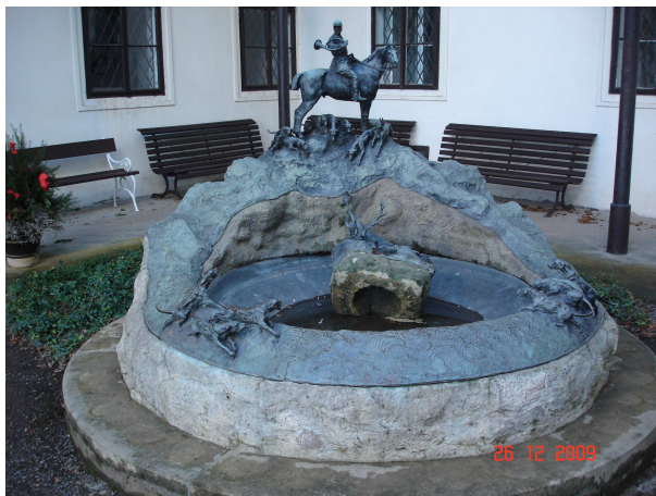
Obrázek č. 19