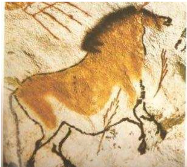
Obrázek č. 9