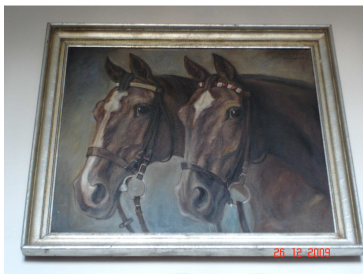
Obrázek č. 13

Vybrané fotografie z uměleckých sbírek Státního zámku Slatiňany