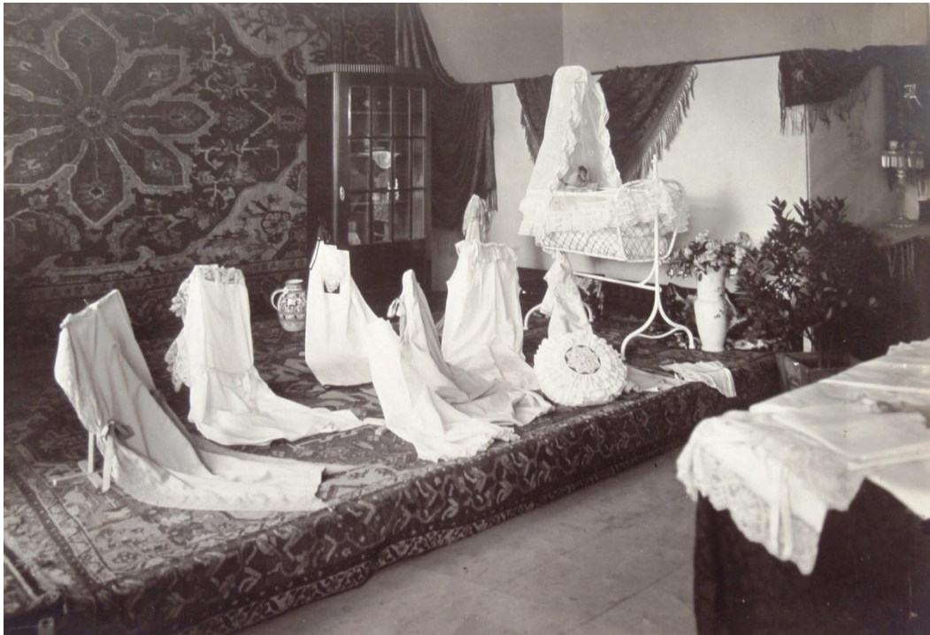
Obr. č. 9 – Ukázka z výstavy konané 21. - 22. července 1925