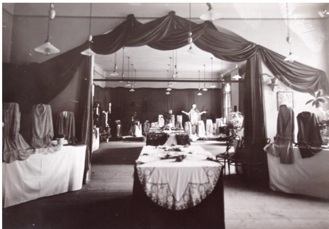
Obr. č. 11 – Ukázka z výstavy konané 21. - 22. července 1925