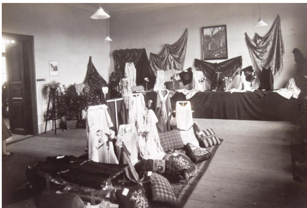
Obr. č. 8 – Ukázka z výstavy konané 21. - 22. července 1925