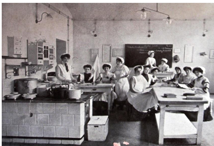
Obr. č. 6 – Cvičná kuchyně průmyslové dívčí školy. Žákyně II. kuchařského kurzu.