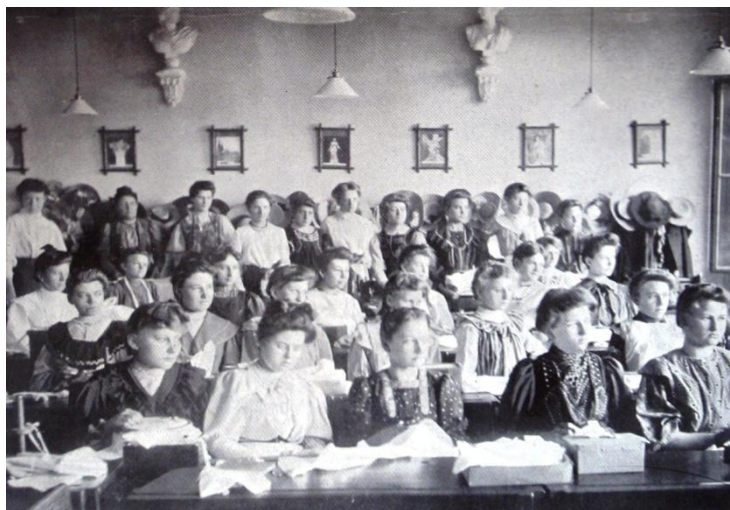
Obr. č. 5 – I. ročník průmyslové školy