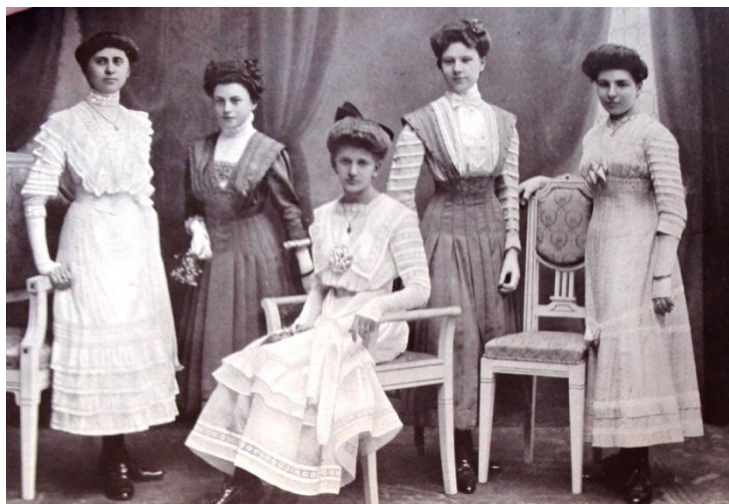
Obr. č. 7 – Ukázka ručních prací zhotovených v ročníku II.