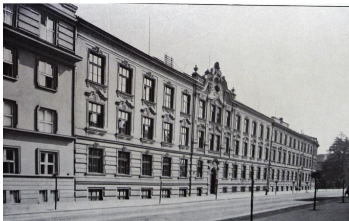
Obr. č. 1 – Budova Východočeské Vesny