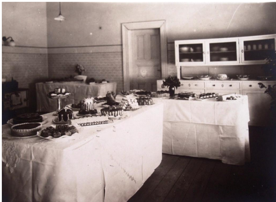
Obr. č. 10 – Ukázka z výstavy konané 21. - 22. července 1925