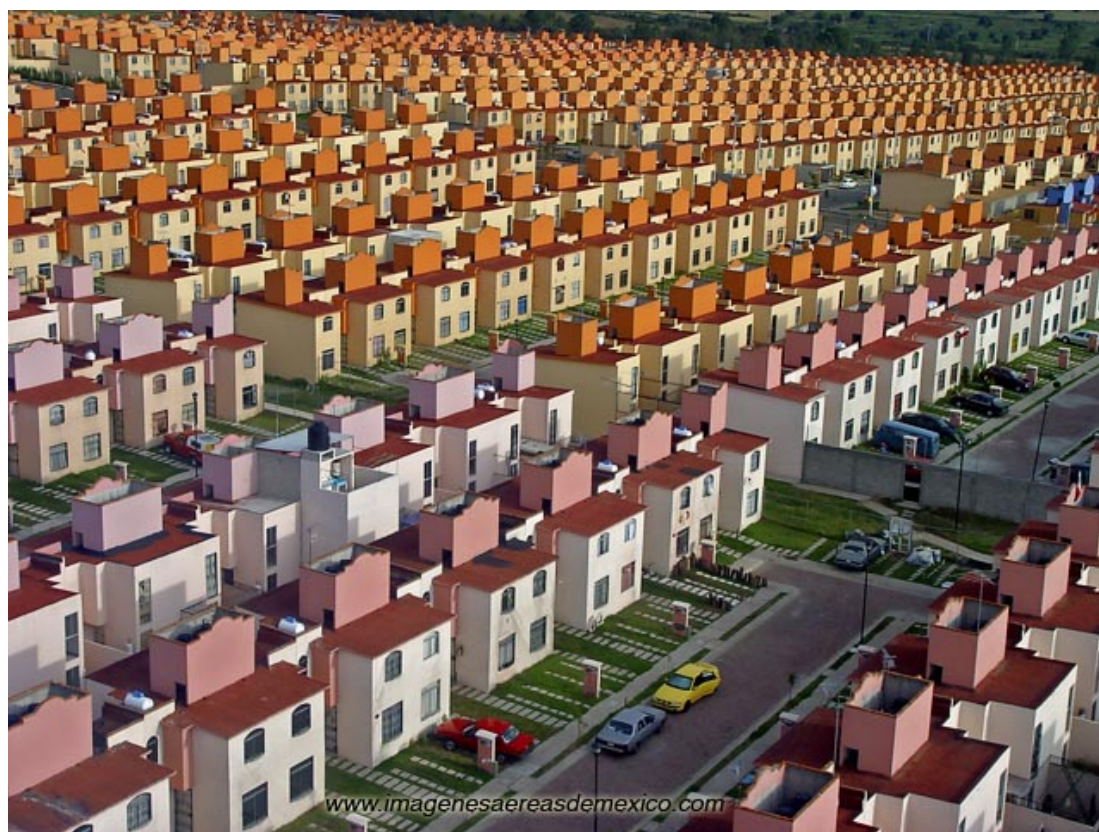
Obr. 1 MexicoCity

Způsobů, jak můžeme vnímat krajinu, je velmi mnoho. Co si člověk pod pojmem "krajina" představí, určitě z velké části záleží na tom, kde a jak vyrůstal, ale také na druhu jeho vzdělání. Pro každého může to samé slovo znamenat něco trochu jiného a různé profese mohou mít ke krajině odlišný vztah.