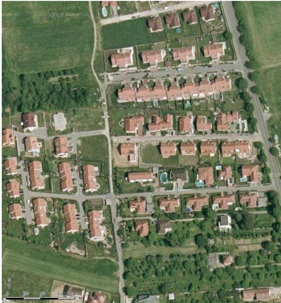
Obr. 2: Suburbanizace v České republice - Brno - Česká

Současnost nám přináší celou řadu změn, které jsou mimo jiné výrazem formování nových parametrů a kritérií ve využívání krajiny. Z pohledu dnešního vývoje krajinné struktury ČR prochází dynamickou transformací zejména oblast krajinného typu kterou označujeme jako příměstskou krajinu – ta vlastně tvoří zónu přechodu mezi městem a volnou krajinou. Tuto oblast významně zasahují především projevy toho co krajinu ohrožuje nejvíce. [2]