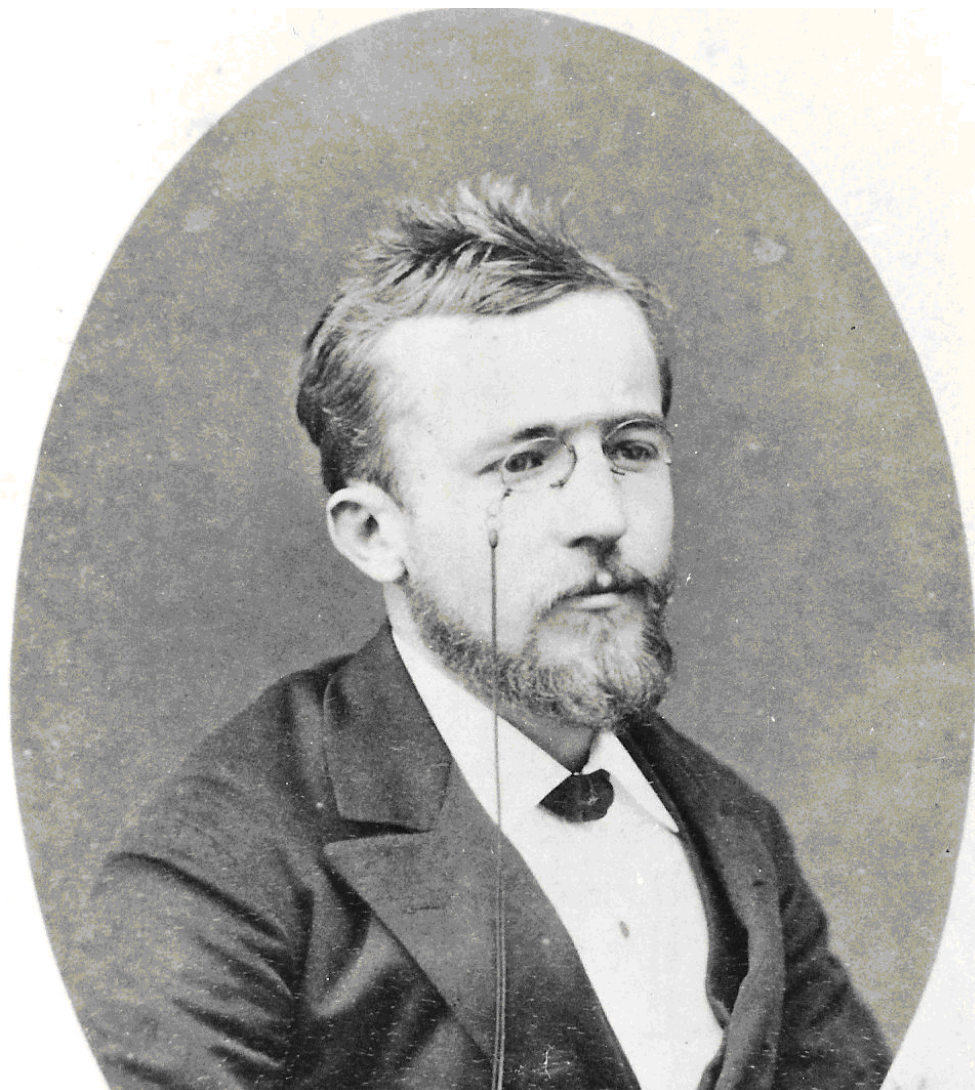
Obr. 2: Profesor Hermenegild Škorpil na počátku své bulharské pedagogické kariéry.