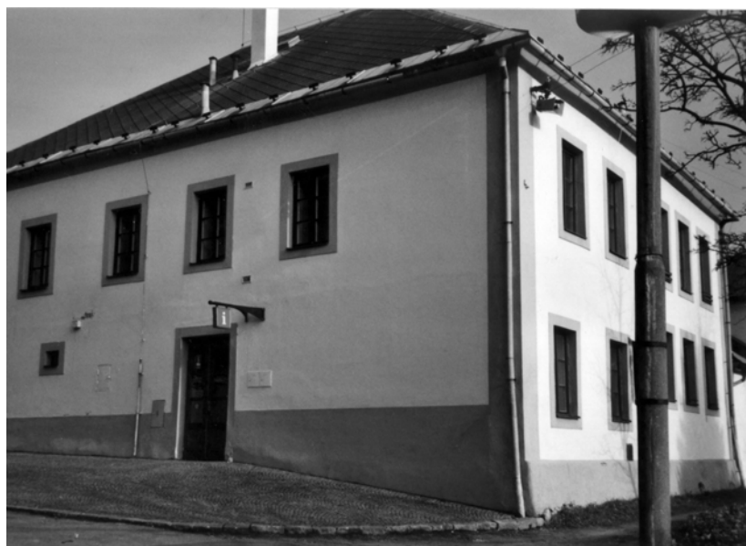
Obr. 17: Nové Město na Moravě. Dům č. 97. Současný stav.