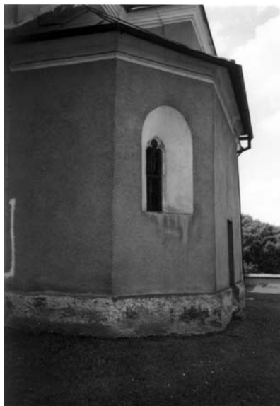
Obr. 1: Nížkov. Kostel sv. Mikuláše. Současný stav. Snímek Jaroslav Teplý.