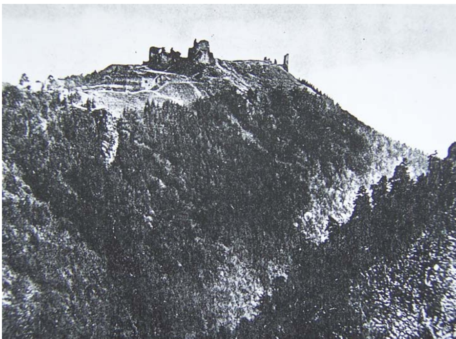
Obr. 9: Hrad Lichnice. Pohled od severu přes Lovětínskou rokli. Stav okolo roku 1930.