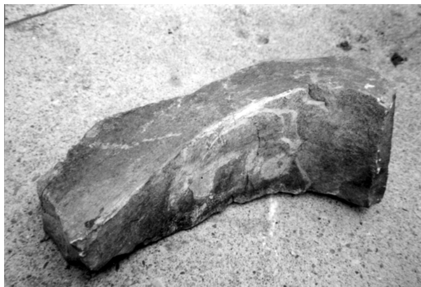
Obr. 15: Hradiště hradu Bobrová. Stavební článek: část do oblouku tesaného ostění.