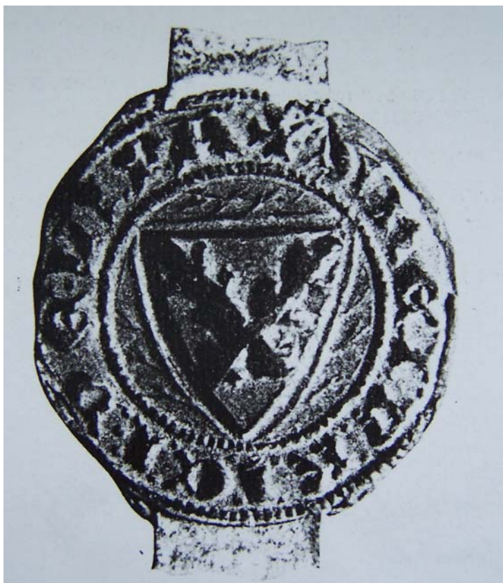
Obr. 18: Pečeť Jindřicha z Lipé, přivěšená k jeho listině z 25. dubna 1316. (František Beneš: Pečetě v Českých zemích.)