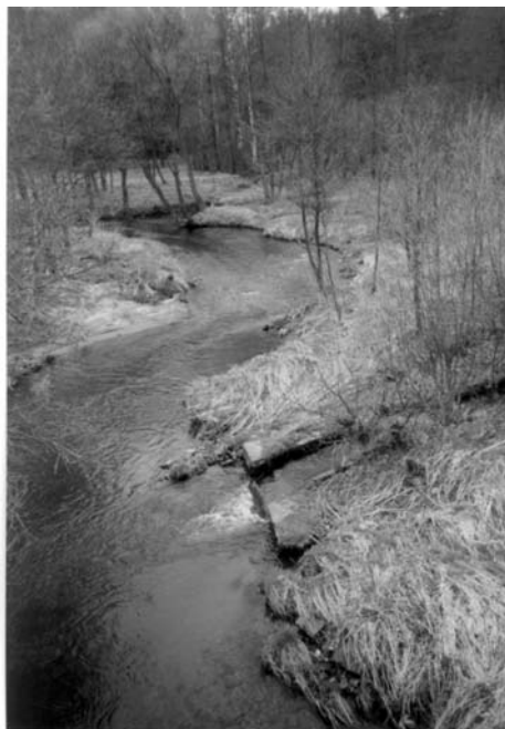
Obr. 2: Újezd Slubičky, jímž protéká potok Slubice. Jeho dolní tok před ústím do Chrudimky západně od Hlinska. Současný stav.