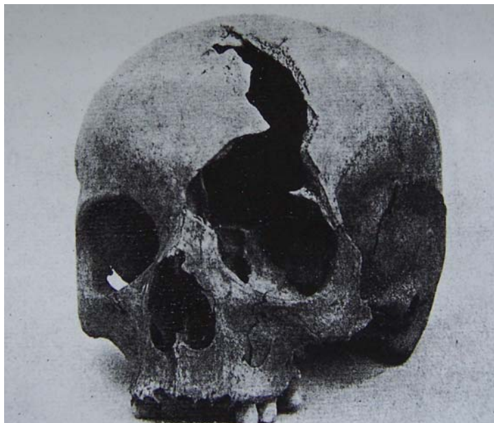
Obr. 16: Žďár nad Sázavou, klášter. Konventní kostel P. Marie a sv. Mikuláše. Jižní závěrová kaple, tumba s pozůstatky členů rodu erbu tří pruhů. Lebka dospělého muže. Tumba byla otevřena v roce 1947. (Metoděj Zemek - Antonín Bartůšek: Dějiny Žďáru I.)