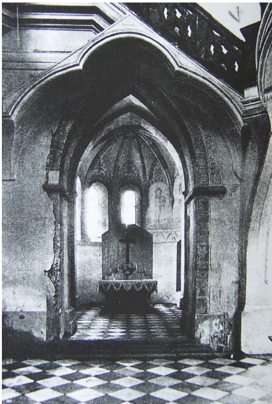
Obr. 5: Žďár nad Sázavou, klášter. Konventní kostel P. Marie a sv. Mikuláše, pohled z boční lodi do severní závěrové kaple. Stav v polovině dvacátého století. (Metoděj Zemek – Antonín Bartůšek: Dějiny Žďáru I.)