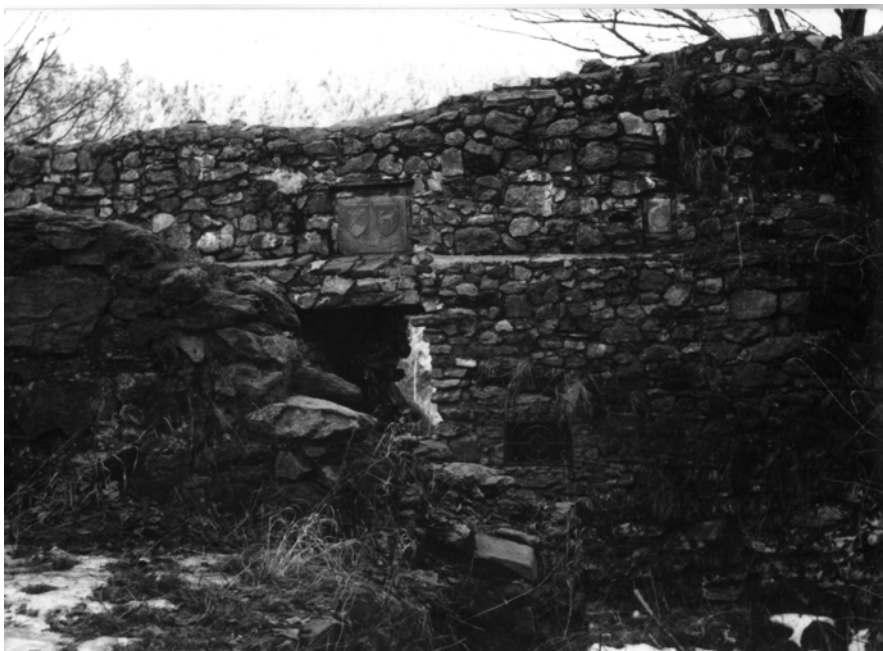
Obr. 10: Hrad Ronovec. Hradní jádro. Současný stav.