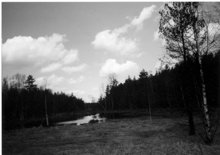
Obr. 3: Bezejmenné slatinné jezírko u jihozápadního okraje Radostínského rašeliniště. Současný stav.