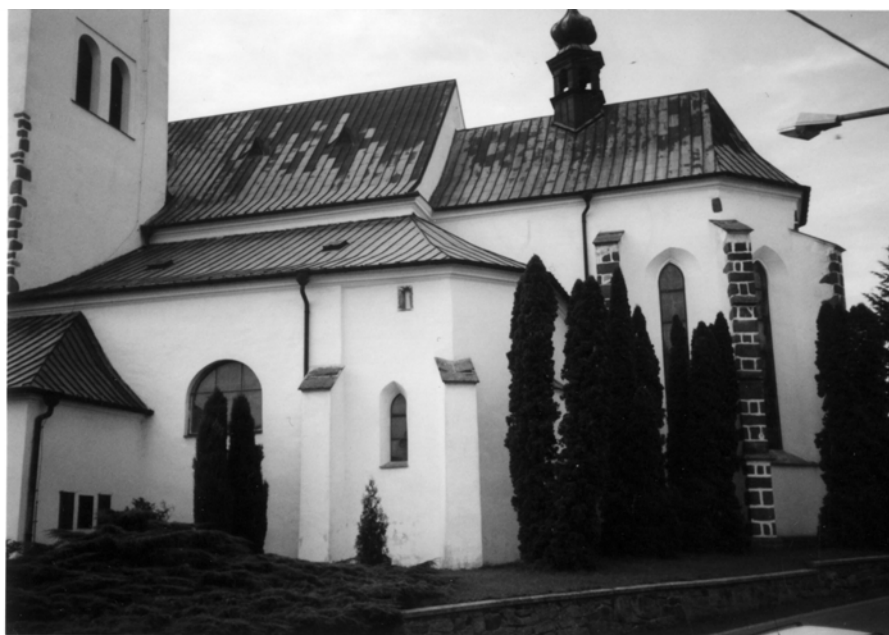
Obr. 4: Křižanov. Kostel sv. Václava, severní strana. Současný stav.