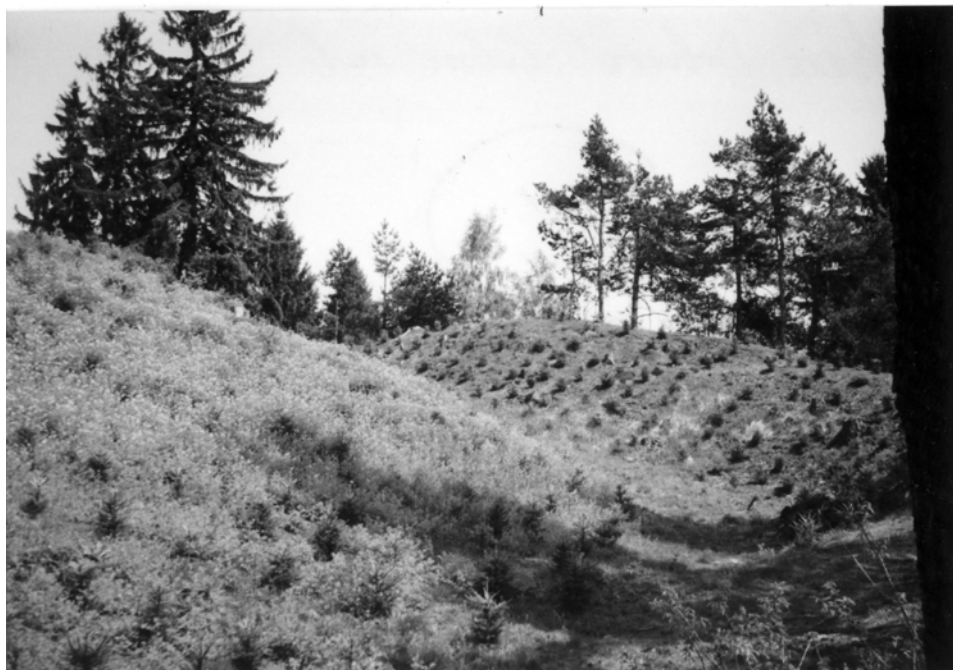
Obr. 14: Hradiště hradu Bobrová. Čelní val. Pohled z vnitřního příkopu směrem k severovýchodu. Současný stav.