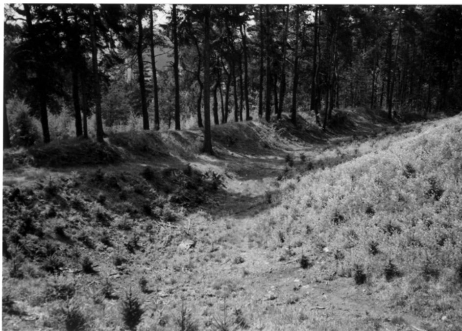
Obr. 13: Hradiště hradu Bobrová. Val na jižní straně, pohled z čela akropole k jihozápadu. Současný stav.