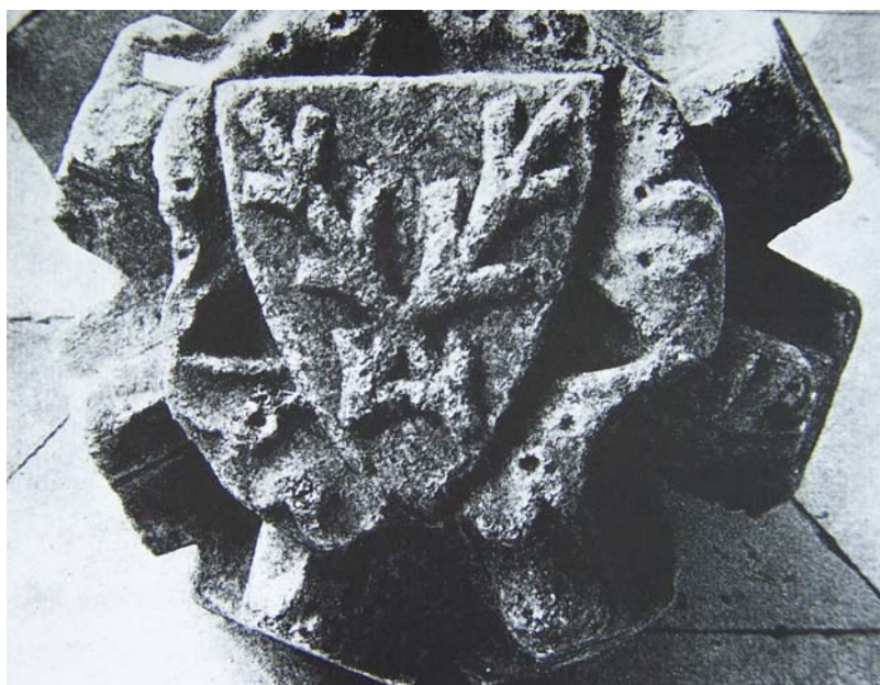
Obr. 11: Svorník s erbem skřížených ostrvů, nalezený v areálu kláštera. Lapidarium musea ve Žďáru nad Sázavou. Současný stav.