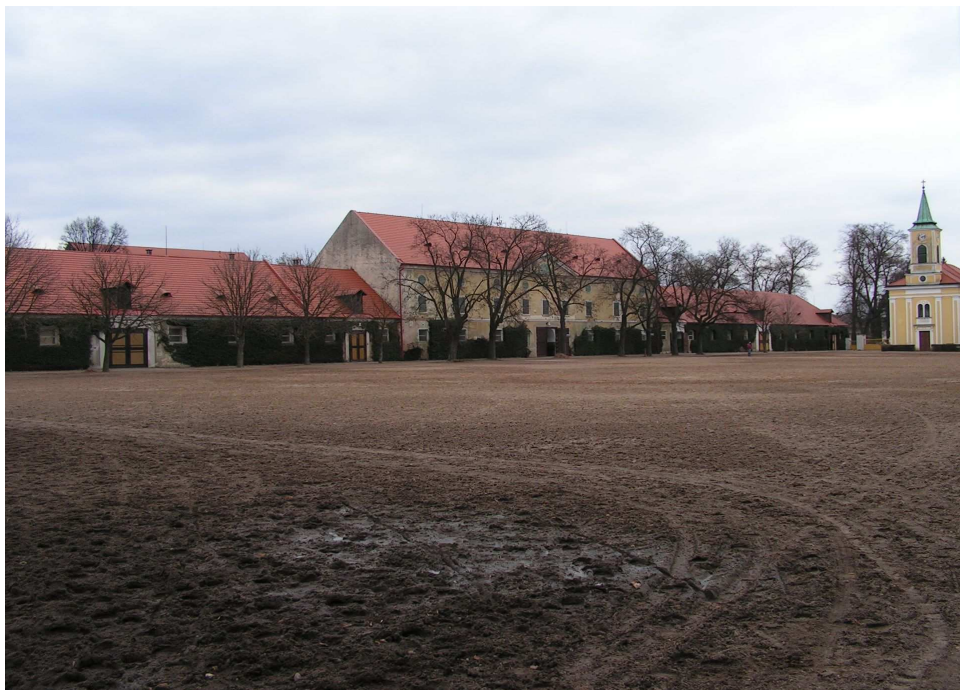
Příloha č. 1 – Areál hřebčína