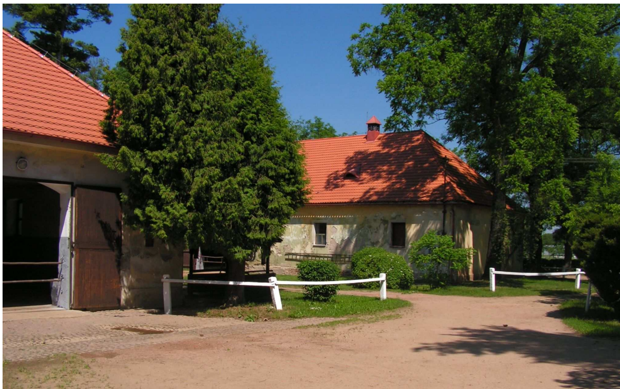
Příloha č. 9 – Josefov