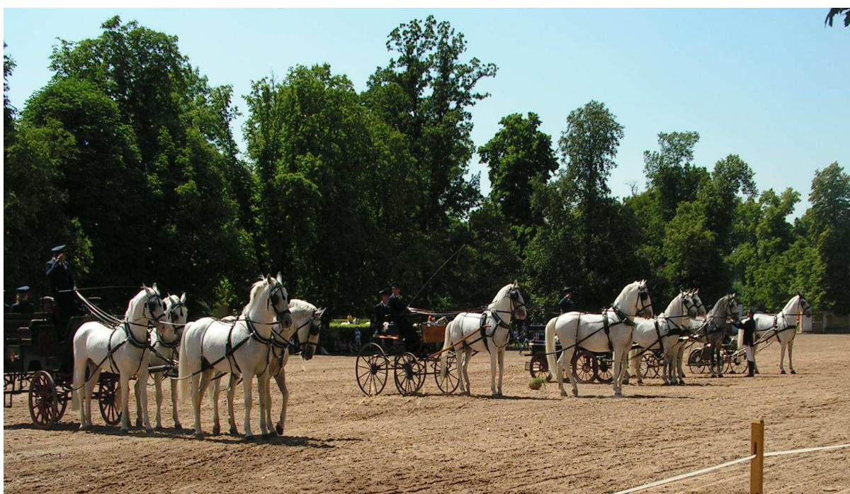
Příloha č. 18 – Ukázka druhů zápřeže