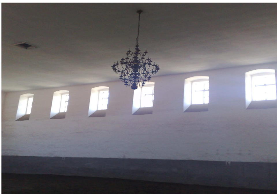
Příloha č. 2 – Jízdárna