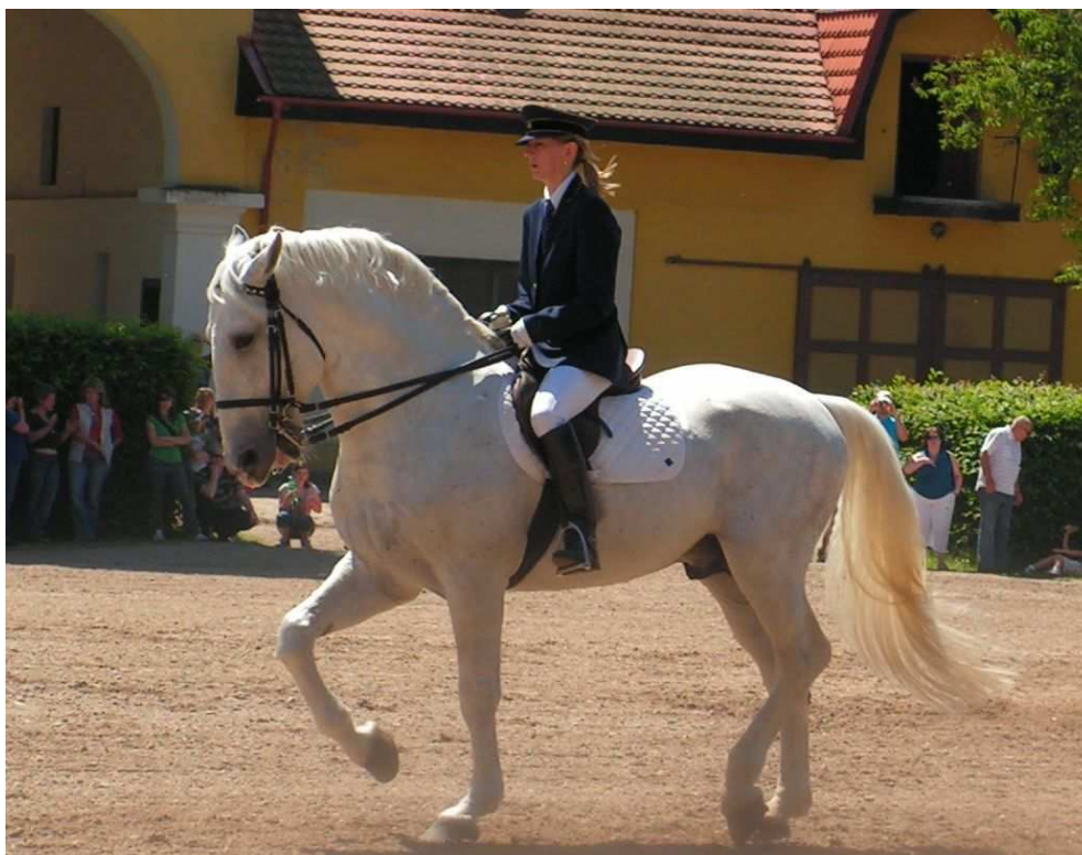
Příloha č. 14 – Hřebec z linie Generalissimus