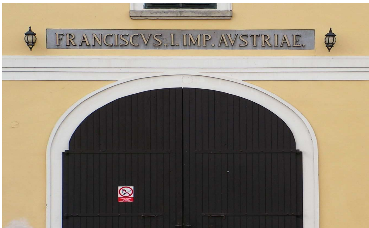
Příloha č. 10 – Nápis na Františkově