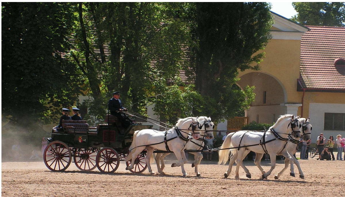
Příloha č. 17 – Čtyřspřeží s panem Vozábem