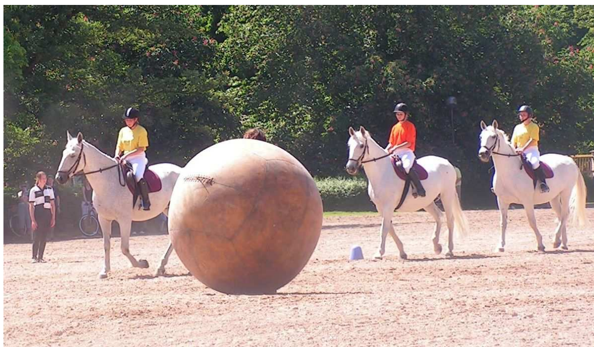
Příloha č. 16 – Pushball