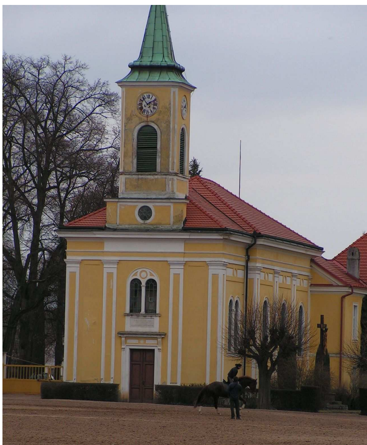
Příloha č. 8 – Kladrubský kostel