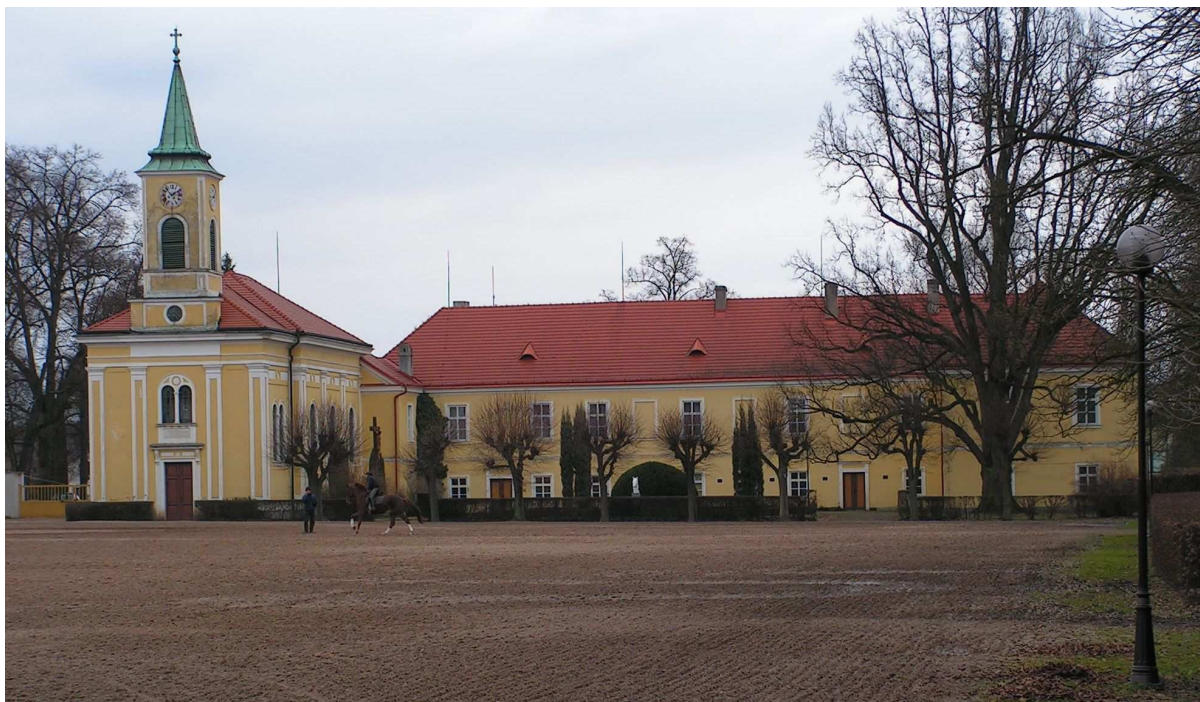
Příloha č. 7 – Zámek dnes