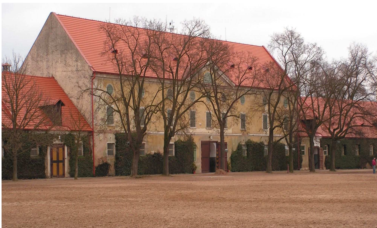
Příloha č. 4 – Areál porostlý břechťanem