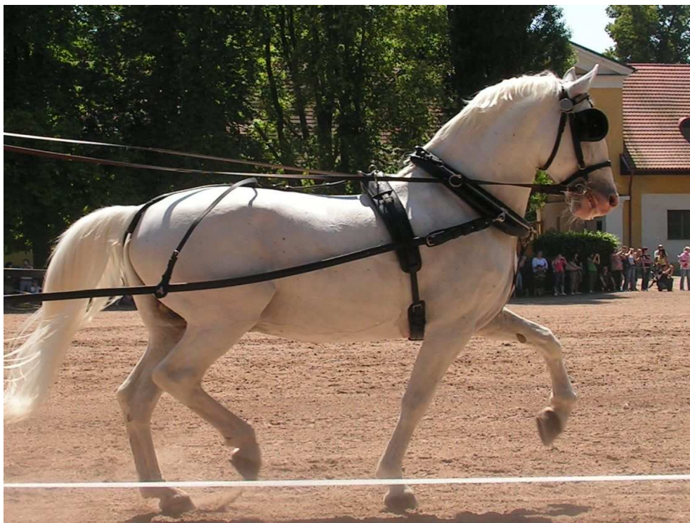
Příloha č. 13 – Vysoká akce předních končetin