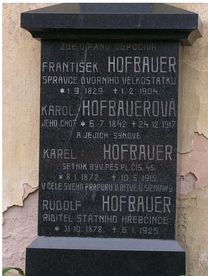
Příloha č. 15 – Náhrobek bývalého ředitele Hofbauera