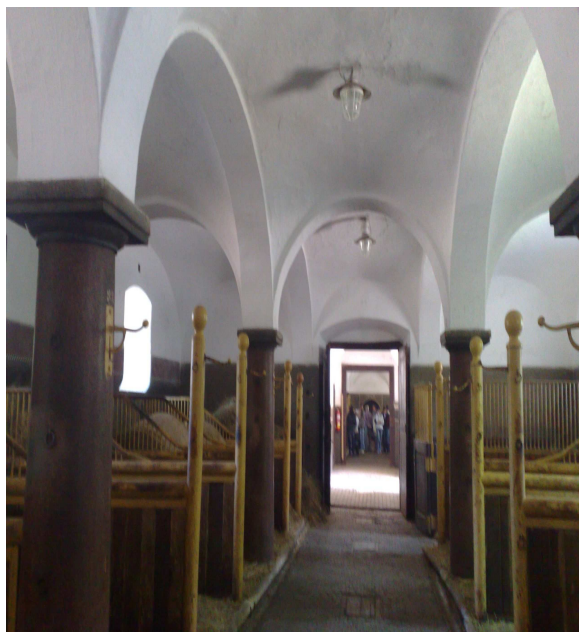
Příloha č. 3 – Vnitřní pohled do stájí