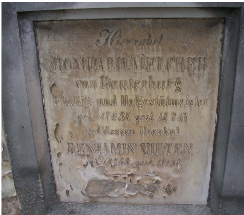
Příloha č. 12 – Melcherův hrob