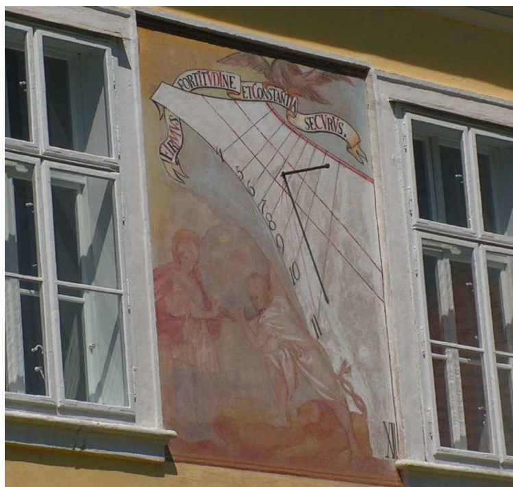
Příloha č. 5 – Sluneční hodiny s Atlasem