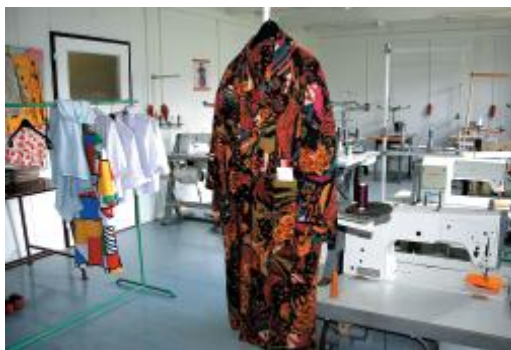
Obr. č.3 - Dílny ŠVS

ŠVS ve Věznici Pardubice je samostatná budova. Součástí střediska je přilehlá zahrada, kde odsouzení aplikují své poznatky z kurzu rodinné školy. Budova má několik učeben, dílnu odborného výcviku (šicí dílnu – viz. obr. č.3), studovnu, počítačovou učebnu, učebnu vaření, sborovnu, kabinet pomůcek a kancelář vedoucího vzdělávacího střediska.