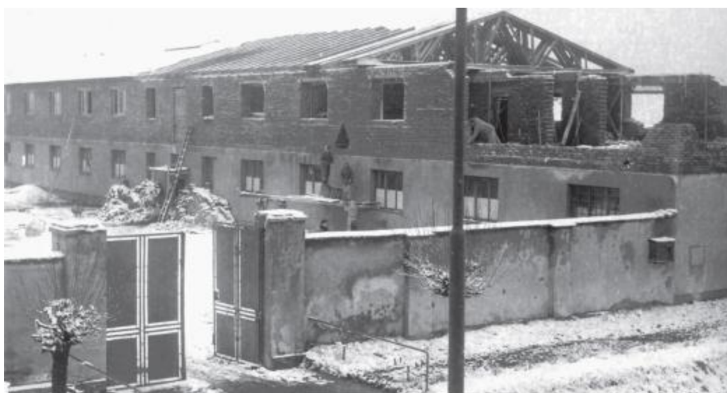
Obr. č.2 – Výstavba ubytovny

Počet odsouzených byl poměrně vysoký (přes 1200 osob), což vedlo k méně příznivým podmínkám týkajících se ubytování nebo zacházení s vězni. V ubytovnách byly stísněné poměry a absence soukromí a osobních věcí vedla ke konfliktům, agresi, depresím či porušování norem. Tato situace se vyřešila stavbou nových objektů v roce 1976. Tehdy byla zprovozněna i budova, kde se vykonávaly kázeňské tresty.