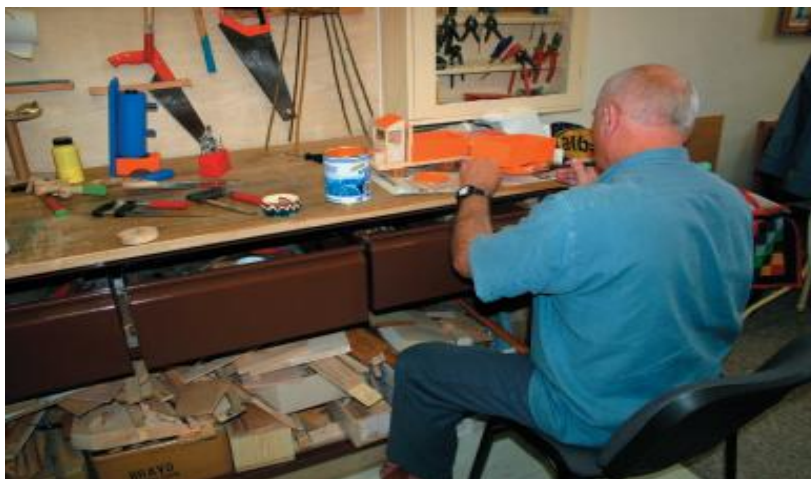
Obr. č. 5 - Odsouzený při arteterapii Zdroj – interní materiály Věznice Pardubice

papíru, slámy a různých netradičních materiálů. S odzbrojující jistotou tvrdí, že tvůrčí činnost je obecná vlastnost každého člověka, kterou lze i do sebe uzavřeného nebo vzdorujícího člověka přivést k zážitku vzácného pocitu sebeuplatnění a dále ho pak kultivovat, snižovat jeho agresivitu a harmonizovat jeho chování.