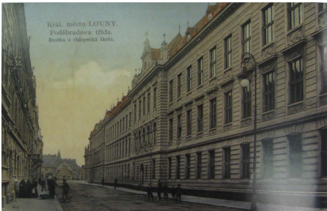
Obr. č. 12 – Budova reálky, v pozadí chlapecké školy, 1909