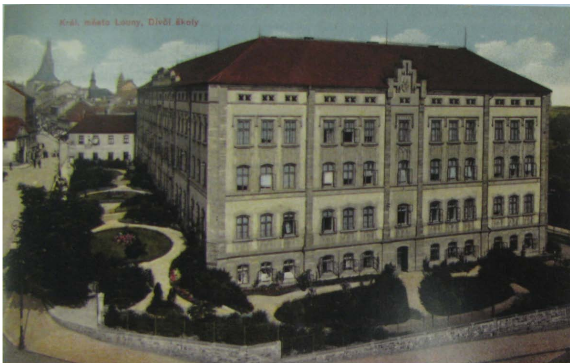
Obr. č. 10 – Měšťanská a obecná škola dívčí, 1911