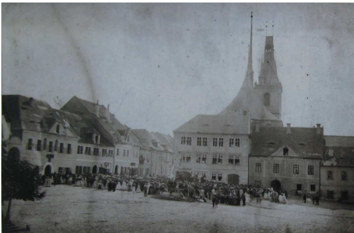
Obr. č. 14 – Tábor lidu na náměstí města Loun, 25. července 1869