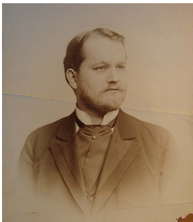
Obr. č. 9 – Architekt Kamil Hilbert