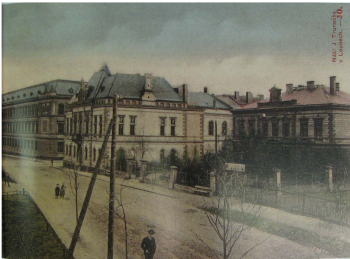
Obr. č. 13 – Zprava zimní hospodářská škola, sokolovna, chlapecké školy, mezi nimiž začíná Poděbradova třída (výřez z panoramatické pohlednice prvorepublikového Rašínova náměstí), 1910