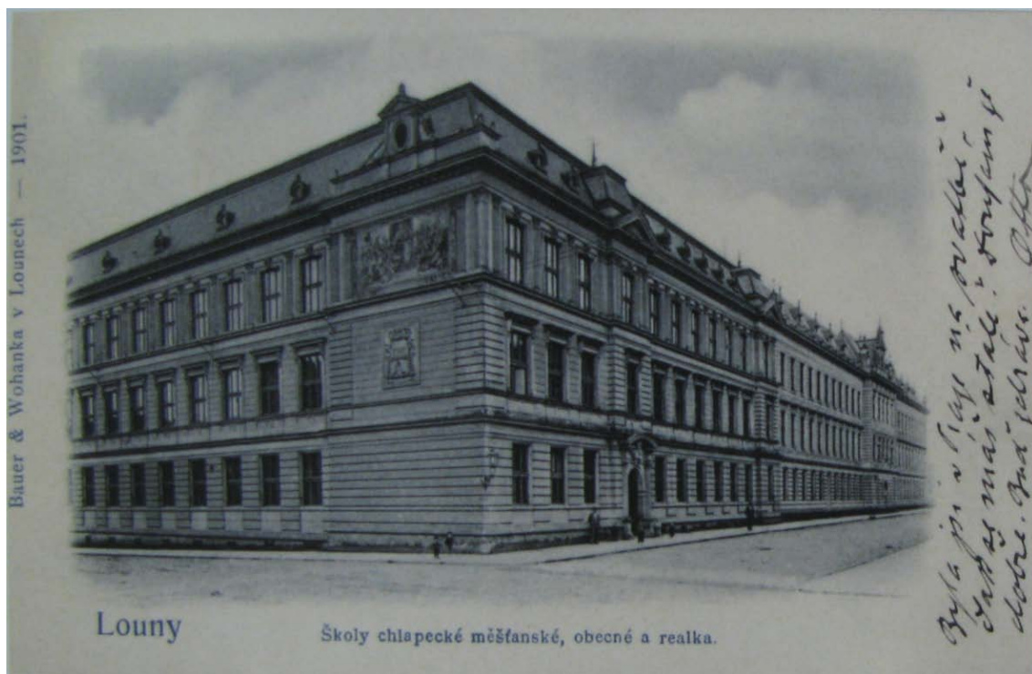
Obr. č. 11 – Budova chlapeckých škol a vyšší reálné školy, 1901