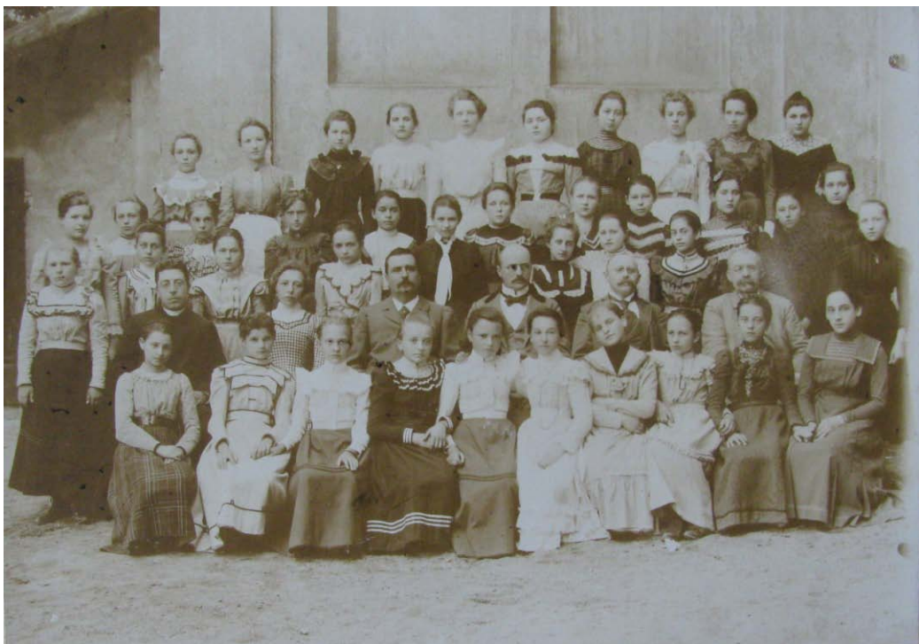
Obr. č. 6 – III. ročník měšťanské školy dívčí s učitelským sborem, 1900