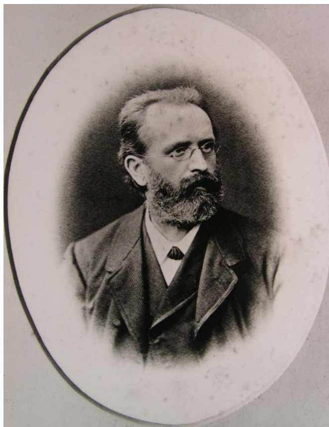
Obr. č. 8 – Starosta Petr Pavel Hilbert