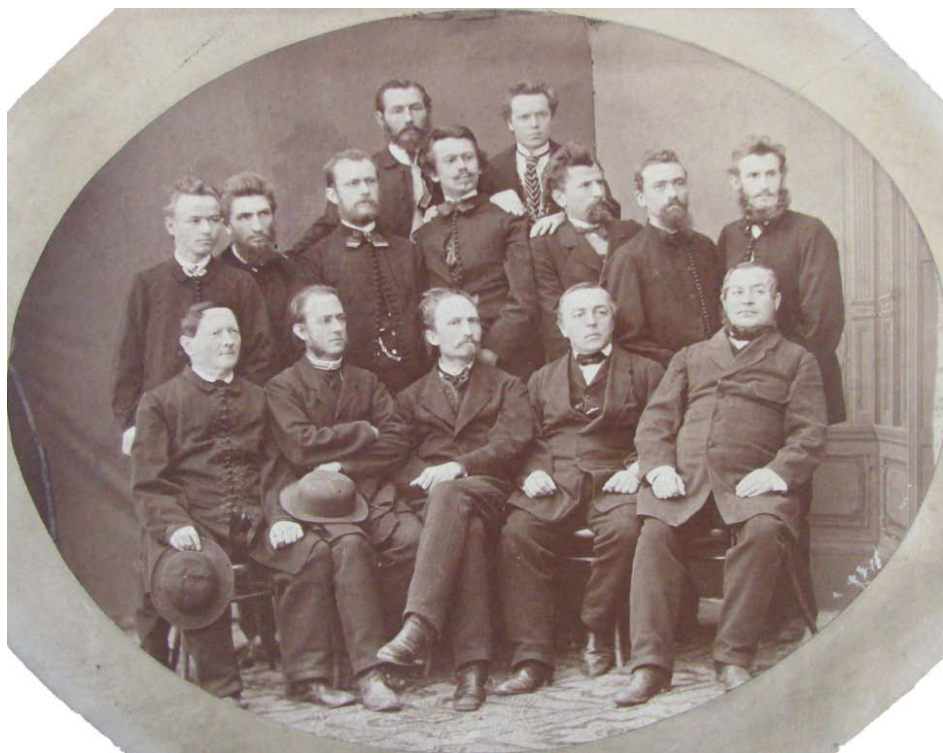
Obr. č. 1 – Učitelský sbor obecné a měšťanské školy chlapecké, 1873