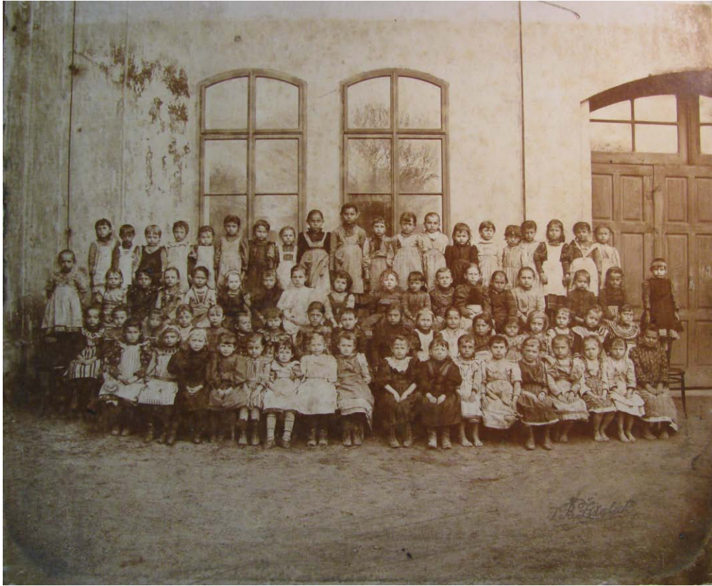
Obr. č. 3 – Mateřská škola, 1870