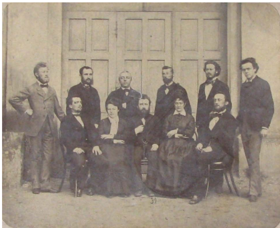
Obr. č. 2 – Učitelský sbor obecné a měšťanské škola dívčí, 1875 – 1876