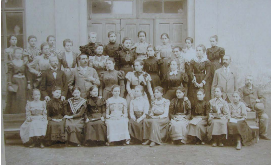
Obr. č. 5 – III. ročník měšťanské školy dívčí s učitelským sborem, 1899