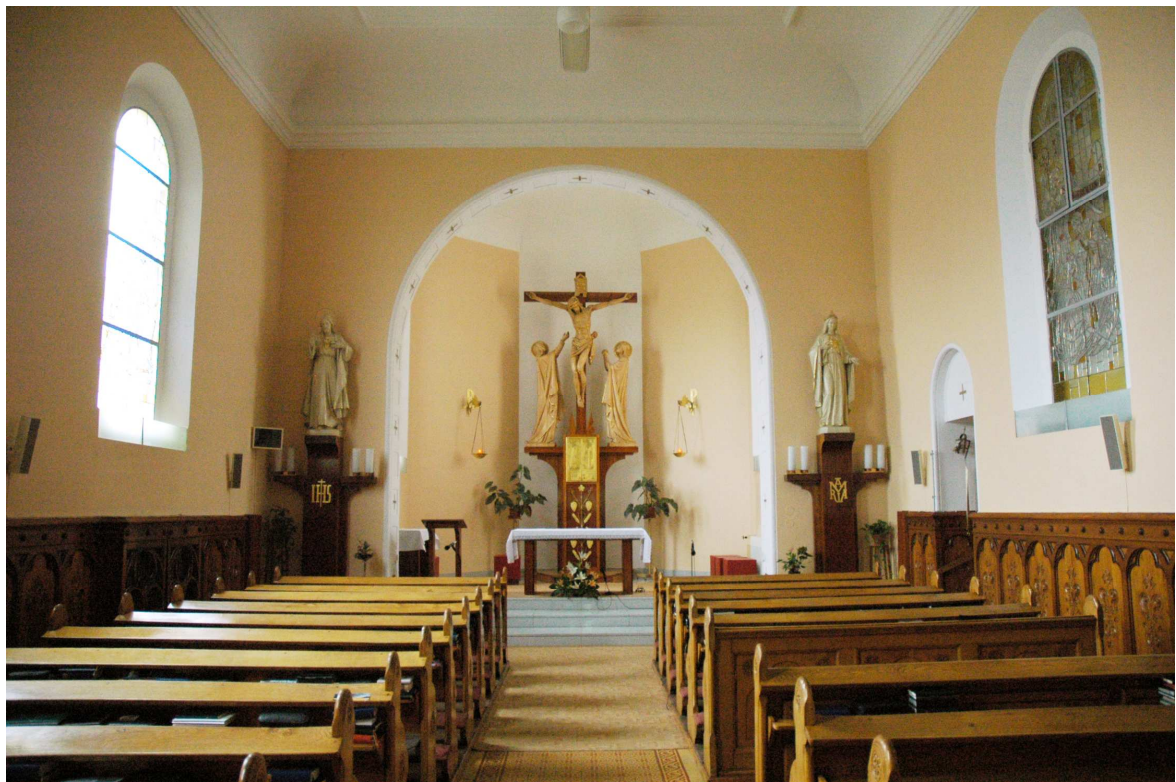
Hlavní kaple sester boromejek