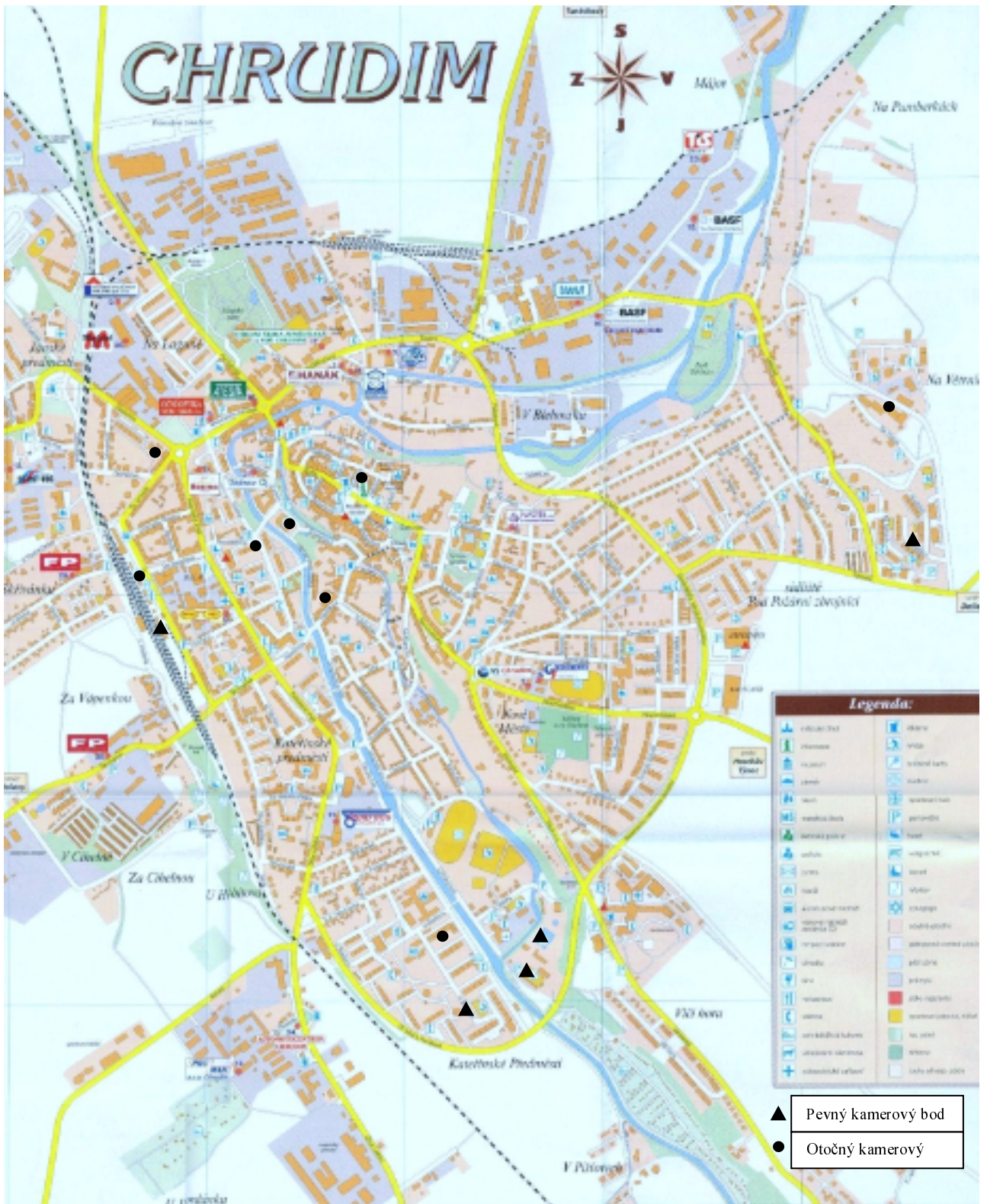
Obrázek č. 1: Rozmístění kamerových bodů v Chrudimi