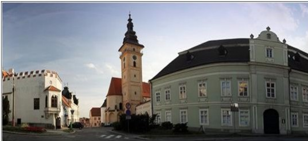
Obr. č. 2: Zámecké panorama

Z hlediska aktivní turistiky lze doporučit jak cyklostezky, které křížují zdejší oblast, tak i značené pěší turistické trasy, z nichž nejznámější je tzv. Březinova cesta. Jde o červeně značenou trasu o délce 64,5 km tématicky zaměřenou na život a působišť Otokara Březiny.