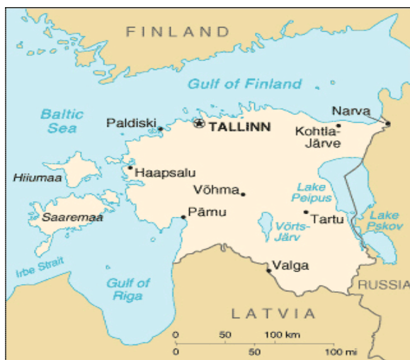
Obrázek 1: Mapa Estonska

Veškeré informace byly uvedeny v estonštině, ale každá z těchto stránek měla i anglickou verzi, které jsem využila a přeložila ji. Informace o dané zemi nebylo obtížné najít a informovanost z výše uvedených webových stránek je na velmi dobré úrovni a stránky jsou stále aktualizovány. Během sepisování a hledání informací jsem se nesečkala s žádnými obtížemi.