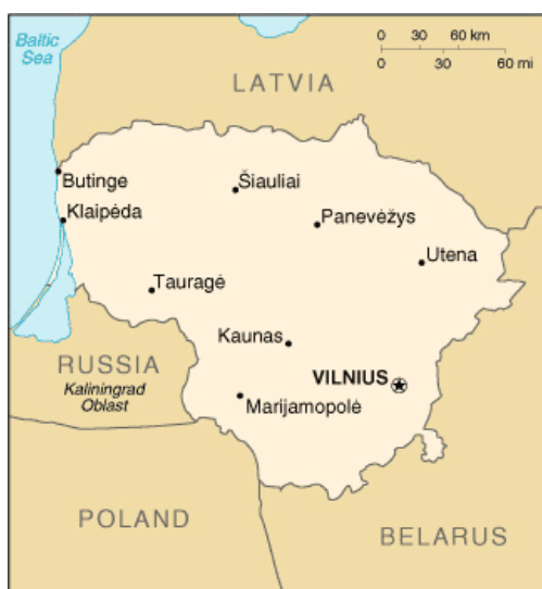
Obrázek 3: Poloha Litvy

Hledání těchto informací bylo poněkud obtížnější, avšak ne tolik, jako při hledání určitých informací o rodinné politice v Lotyšsku. Bohužel zde ale nemohu uvést, jak často jsou dané informace aktualizovány a z jakého roku pocházejí, protože na jejich stránkách neuvádějí ani rok zveřejnění a aktualizace.