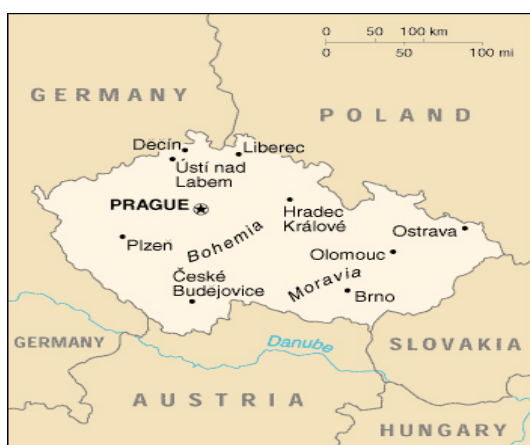
Obrázek 4: Poloha České republiky

Údaje o státní podpoře pro rodiny s dětmi jsem čerpala hlavně ze stránek Ministerstva práce a sociálních věcí dostupných na www.mpsv.cz v sekci Rodina, Státní sociální podpora a Sociální služby, a dále pak z informativních stránek o evropském vzdělávání dostupných na www.eurydice.org . Dále jsem chtěla využít informace z webových stránek Ministerstva školství, mládeže a tělovýchovy dostupných na www.msmt.cz , avšak nemohla jsem najít informace, které bych využila v této práci a jejich webové zpracování mi nepřipadalo příliš přehledné, stejně jako u webových stránek Lotyšské republiky.