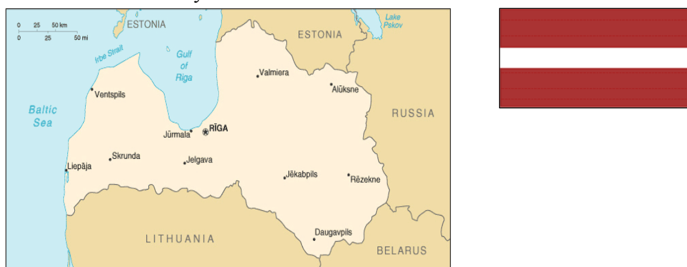
Obrázek 2: Poloha Lotyšska

Informace na oficiálních stránkách jednotlivých ministerstev jsou sice aktualizovány, ale bylo obtížné je dohledat. Také velké množství informací, které jsem potřebovala, mi nevyhovovalo z důvodu neúplnosti, nebo jsem váhala, jak daný obsah správně pochopit.