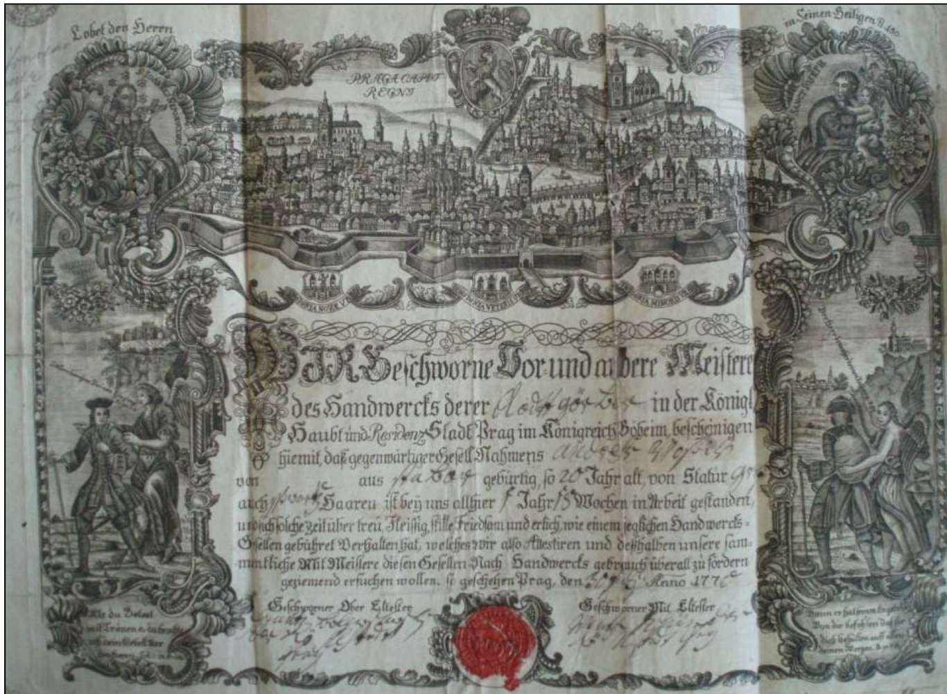
Obrázek č. 1 – Potvrzení o výkonu řemesla v Praze z roku 1770 (In: SOKA Tábor, Cech koželuhů Tábor, inv. č. 17.)