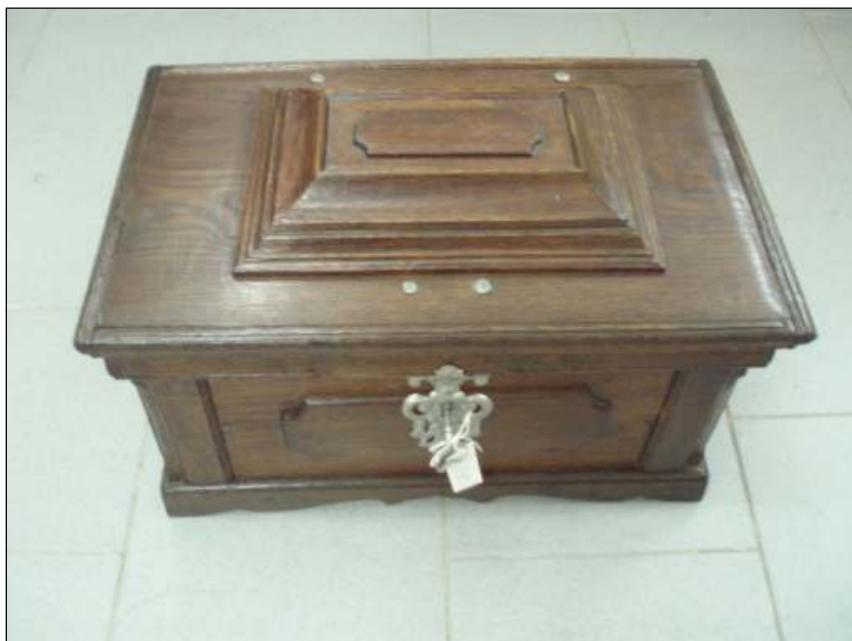
Obrázek č. 4 – Cechovní truhlice, Muzeum Prachatice