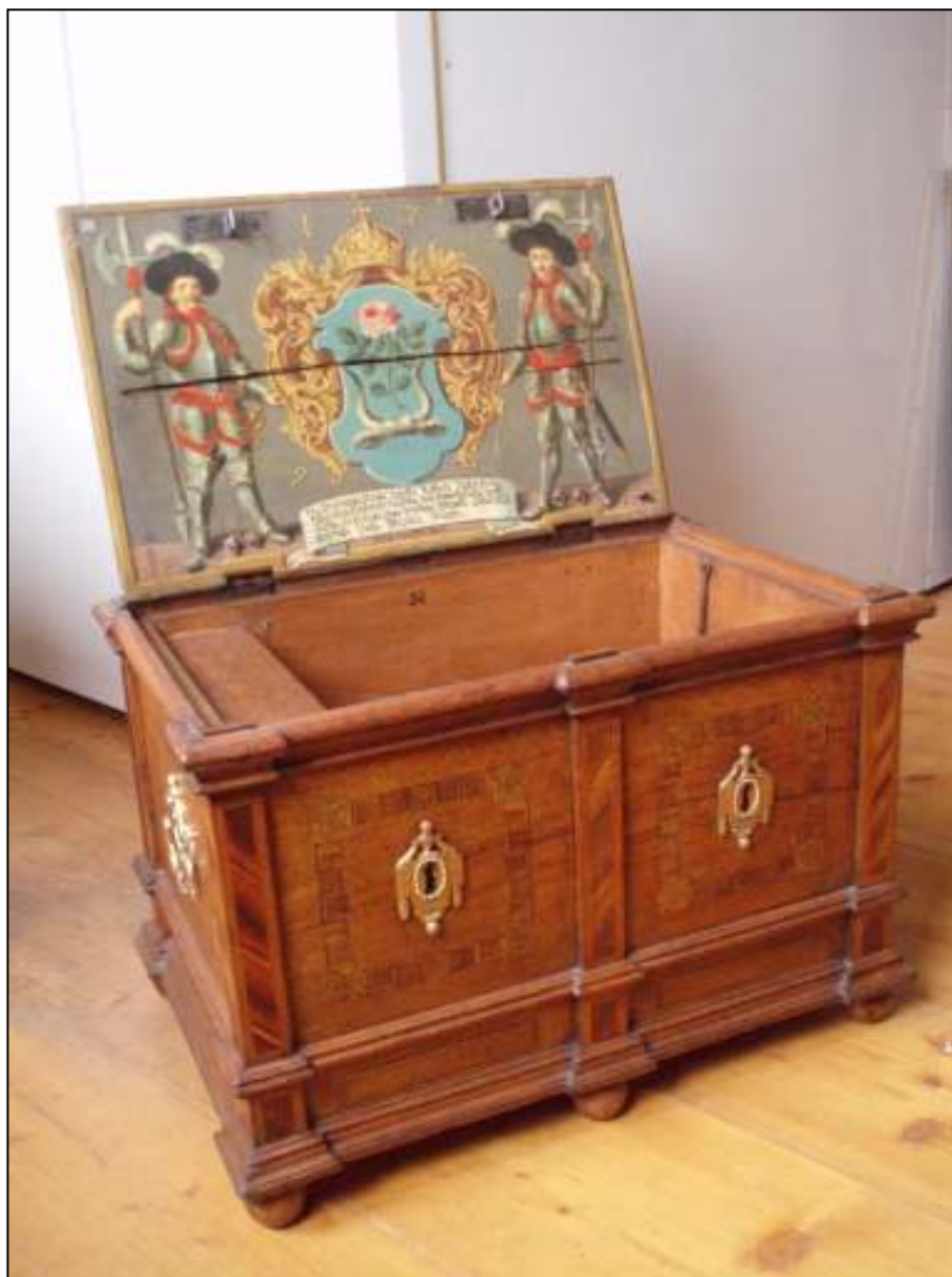
Obrázek č. 3 – Cechovní truhlice, Regionální muzeum Chrudim