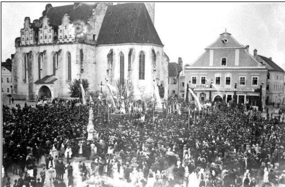
Obrázek č. 7 – Žižkovy slavnosti 1877, Tábor