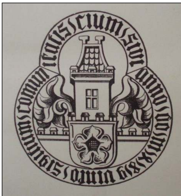
Obrázek č. 9 – Znak Trhových Svinů

(In: HORKÝ, Václav. Trhové Sviny 500 let městem . Trhové Sviny, 1938.)