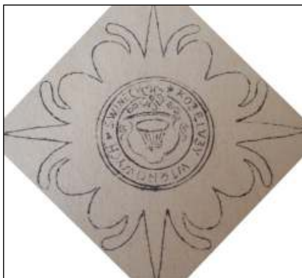
Obrázek č. 8 – Pečeť koželuhů v Trhových Svinech

(In: HORKÝ, Václav. Trhové Sviny 500 let městem . Trhové Sviny, 1938.)