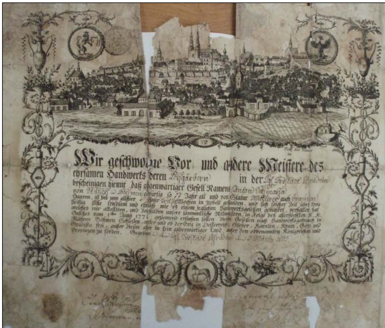
Obrázek č. 2 – Potvrzení o výkonu řemesla v Chrudimi z roku 1802 (In: SOkA Chrudim, Cech koželuhů, II. ostatní listiny, inv. č. 179 b.)