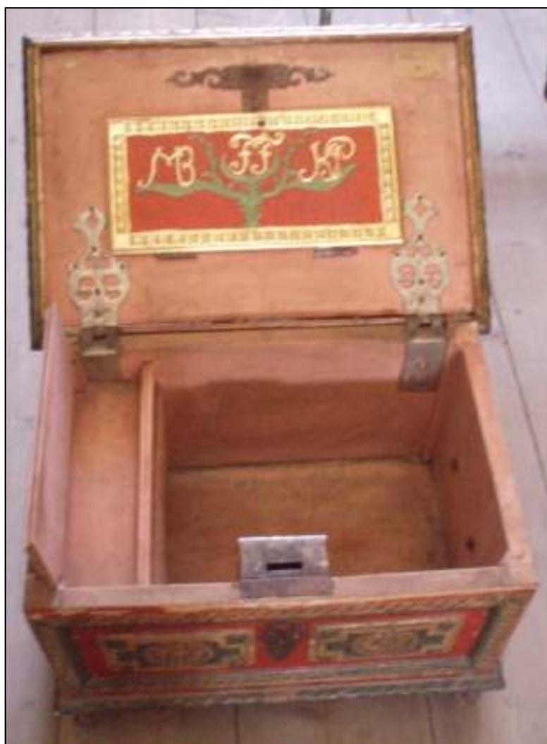
Obrázek č. 5 – Cechovní truhlice, Husitské muzeum Tábor