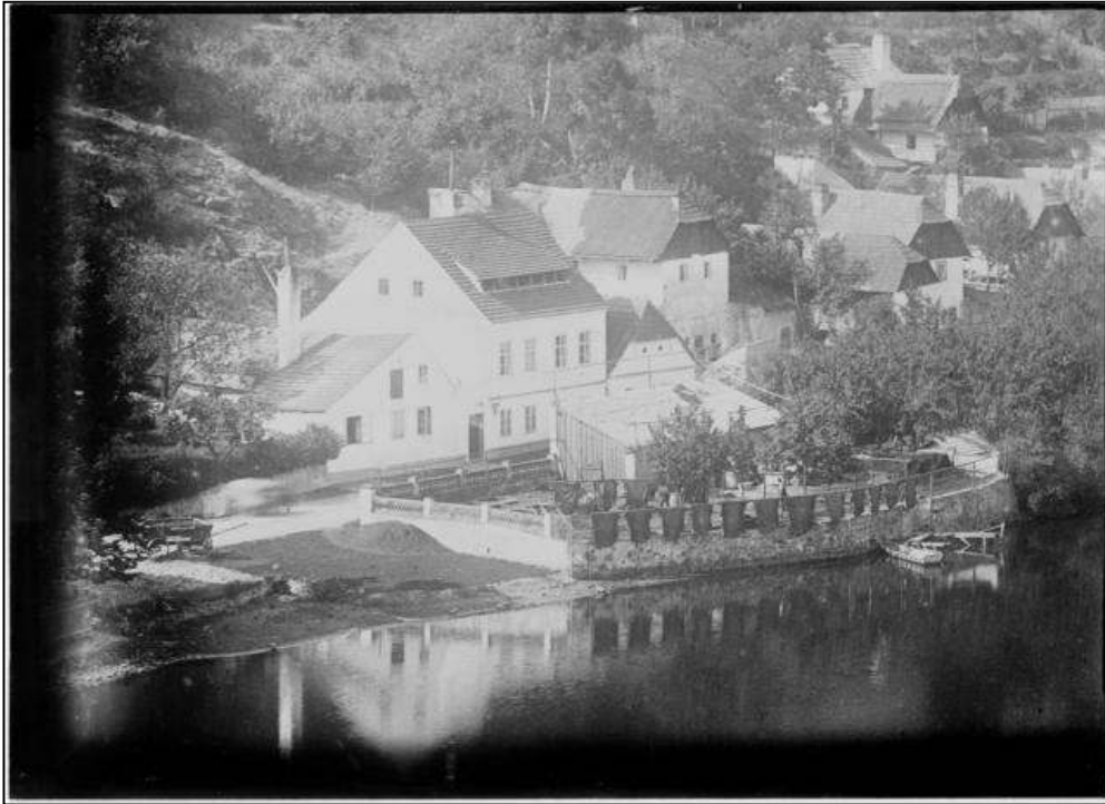
Obrázek č. 6 – Koželuhy, Tábor (již neexistující dům vedle Fischlovy továrny na kůži)