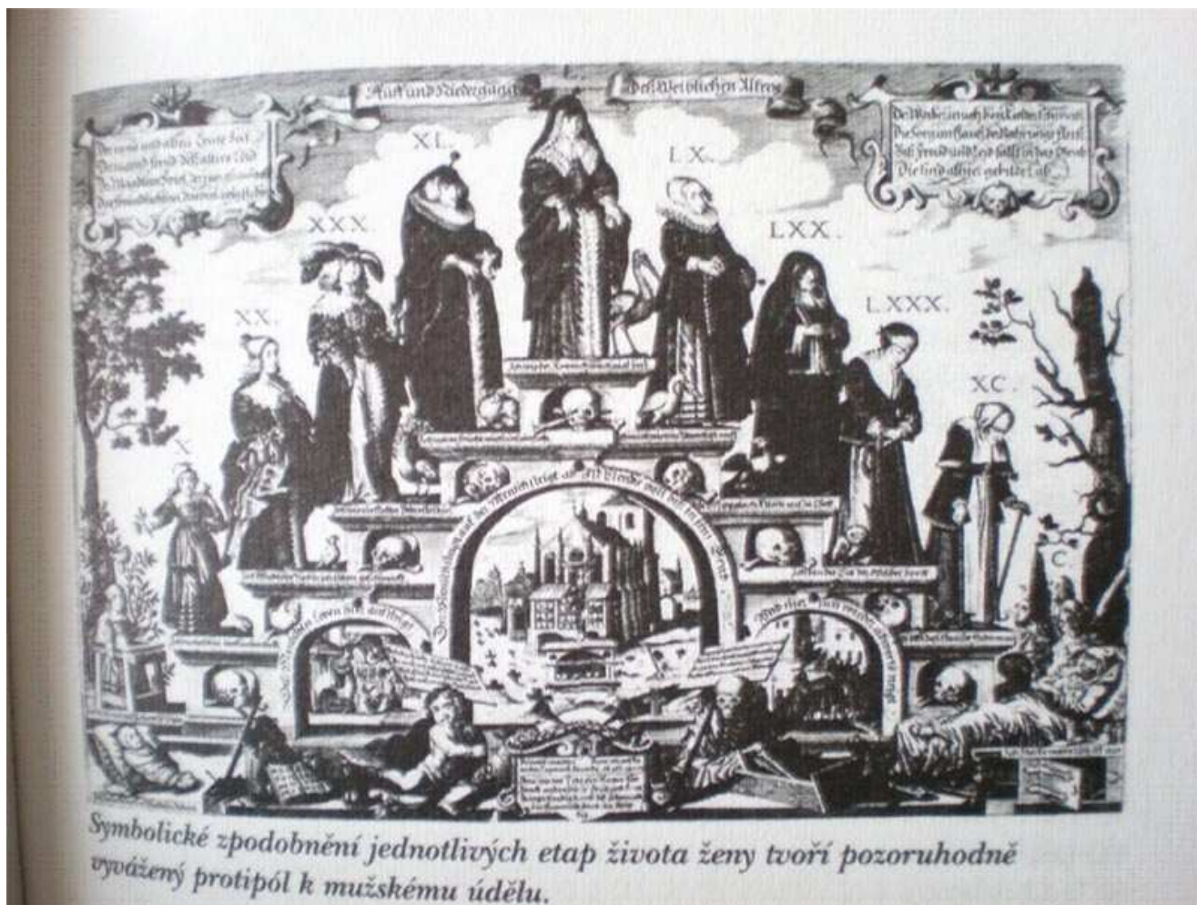
Obr. 1. – převzato KOLDINSKÁ, M. Každodennost . s. 7.