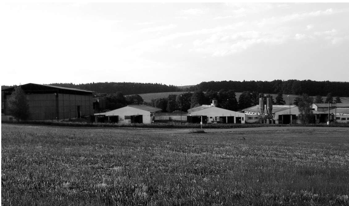
Příloha č. 16: Dnešní stav komplexu bývalého dvora Okrouhlík a opuštěného vepřína za obcí